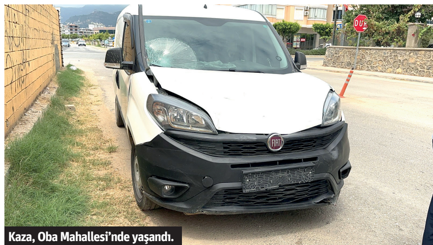
Kaza, Oba Mahallesi'nde yaşandı.

Alanya'da hafif ticari araç ile motosikletin çarpıştığı kazada 1 kişi ağır yaralandı. Edinilen bilgiye göre, R.K. yönetimindeki 07 HHH 62 plakalı motosiklet, Oba Mahallesi, Fabrika Caddesi'nde bulunan kavşakta, M.Ü. idaresindeki 34 DIY 067 plakalı hafif ticari araç ile çarpıştı. Kazanın ardından bölgeye jandarma ve ambulans sevk edildi. Kazada motosiklet sürücüsü R.K. ağır yaralandı. Yapılan ilk müdahalelerinin ardından ambulansla hastaneye kaldırılan sürücünün hayatı tehlikesinin devam ettiği öğrenildi. Jandarma kazayla ilgili inceleme başlattı. - Mehmet AL