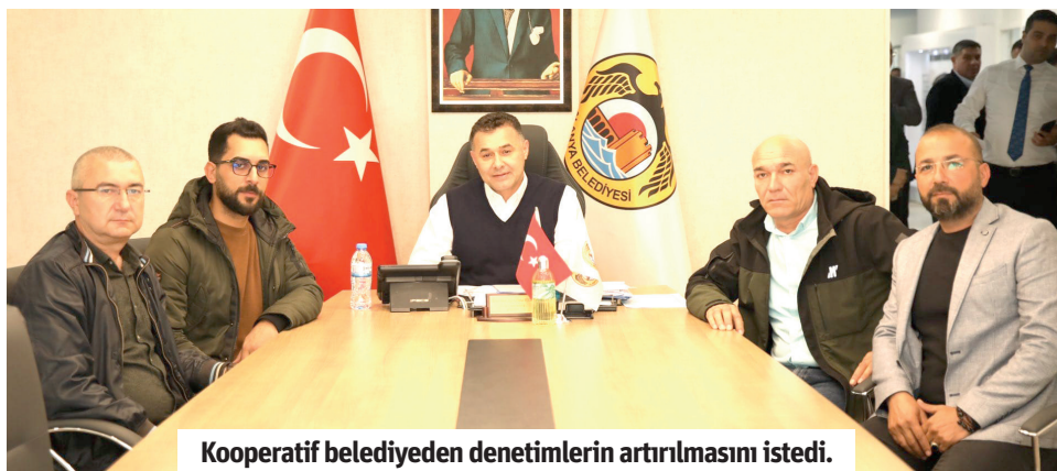
Kooperatif belediyeden denetimlerin artırılmasını istedi.

lari de onaylamadığımız, Türkiye ve dünya gündemini meşgul eden kavga olayını tekrardan şiddetle kınıyoruz. Türkiye bir hukuk devletidir. Olay yargıya taşındığı için olayla ilgili tartışmaların son bulmasını istiyoruz. Yargının vereceği karara saygılıyız. Bu bir hafta içinde ilgili, ilgisiz herkes olayla ilgili basına açıklama yaptı. Her açıklamadan sonra tepkiler daha da büyüdü. Kooperatif olarak ilk gün olayı