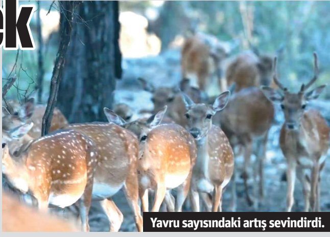
Yavru sayısındaki artış sevindirdi.

Doğa Koruma ve Milli Parklar 6. Bölge Müdürlüğüne bağlı Antalya Düzlerçamı Yaban Hayatı Geliştirme Sahası'nda bulunan Alageyik Üretim Merkezi'nde bu yılki yavru sayısı geçtiğimiz yılı geride bırakarak 41'e ulaştı.