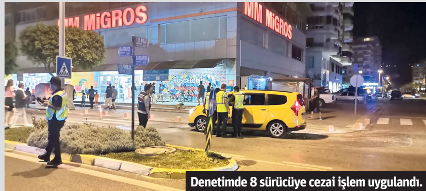
Denetimde 8 sürücüye cezai işlem uygulandı.

Alanya'da ticari taksi sürücülerine yönelik gerçekleştirilen denetimde 8 ticari taksi sürücüsüne toplamda 8 bin 56 TL cezai işlem uygulandı. Alanya'da trafik güvenliğinin sağlanması amacıyla İlçe Jandarma Komutanlığı Trafik ekipleri tarafından ticari taksilere yönelik denetim gerçekleştirildi. Mahmutlar Mahallesi'ndeki ticari taksilere yönelik yapılan uygulamalarda 75 ticari taksi kontrol edildi. Denetimde 8 ticari taksi sürücüsüne toplamda 8.056 TL cezai işlem uygulandı. Denetimde 7 ticari taksi sürücüsüne emniyet kemeri takmamaktan, 1 ticari taksi sürücüsüne ise yetki belgesinden cezai işlem uygulandı. - Haber Merkezi