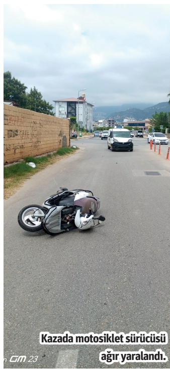
Kazada motosiklet sürücüsü ağır yaralandı.

Alanya'da hafif ticari araç ile motosikletin çarpıştığı kazada 1 kişi ağır yaralandı. Edinilen bilgiye göre, R.K. yönetimindeki 07 HHH 62 plakalı motosiklet, Oba Mahallesi, Fabrika Caddesi'nde bulunan kavşakta, M.Ü. idaresindeki 34 DIY 067 plakalı hafif ticari araç ile çarpıştı. Kazanın ardından bölgeye jandarma ve ambulans sevk edildi. Kazada motosiklet sürücüsü R.K. ağır yaralandı. Yapılan ilk müdahalelerinin ardından ambulansla hastaneye kaldırılan sürücünün hayatı tehlikesinin devam ettiği öğrenildi. Jandarma kazayla ilgili inceleme başlattı. - Mehmet AL