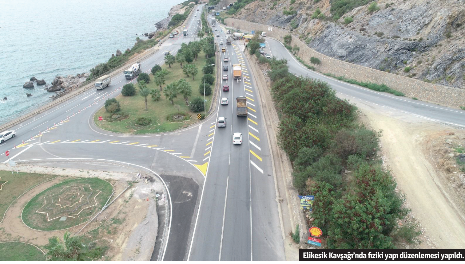
Elikesik Kavşağı'nda fiziki yapı düzenlemesi yapıldı.

D-400 Karayolu üzerinde Alanya-Manavgat karayolu üzerinde bulunan Elikesik kavşağında fiziki yapı düzenlemesi yapılarak yatay ve düşey trafik işaretlemeleri ve sinyalizasyon çalışması tamamlandı.