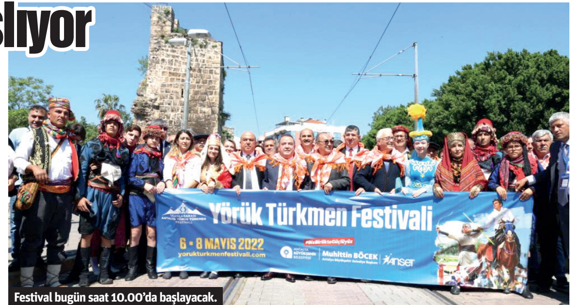
Festival bugün saat 10.00'da başlayacak.

aktivite olacak. Atlı akrobasi gösterileri, yurtdışından katılan misafir grupların halk dansları ile konuk yöresel sanatçıların konserleri gerçekleştirilecek. HALUK LEVENT KONSERİ 3 KASIM'DA Yörük Türkmen Festivali'nin resmi açılış töreni 3 Kasım Cuma saat 18.00'de festival alanında olacak. Saat 19.45'te ünlü sanatçı Haluk Levent festival alanında Antalya'yı ziyaret edecek. 4 Kasım Cumartesi akşam 19.30'da Elif Buse Doğan, 5 Kasım Pazar akşamı saat 20.00'da ise Ayşe Dinçer Yörük Festivalini renklendirecek. Ayrıca, Ebru Özdemir, İsmail Baha Sürelsan Konservatuarı Türk Halk Müziği topluluğu, Egemen Balkanlı, Emran Özdemir de Yörük Festivali'nde konser verecek. Antalya'nın 14 ilçesinde de yöresel sanatçıların farklı günlerde halkla buluşacak. 25 ÜLKE KATILILIYOR Festivale 25 bağımsız Türk Cumhuriyeti katılacak. Uluslararası katılımcılar kültürel etkinlikler yapacak. Türk el sanatlarının tanıtılması için bir platform oluşturulacak. 36'sı Kültür ve Turizm Bakanlığı'ndan 8'i kadın kooperatifinden gelen 44 sanatçı; dokumacılık, dericilik, bıçakçılık, keçecilik gibi el sanatlarını tanıttı. 81