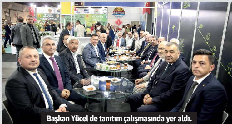
Başkan Yücel de tanıtım çalışmasında yer aldı.

Yücel, "Yöresel, coğrafi işaretli ürünler ile kültürlerin buluşma noktası ve vitrini, Yöresel Ürünler Fuarı'ndaki yerimizi aldık. 2-5 Kasım tarihlerinde ziyaretçilere açık olacak "Sizin oraların nesi meşhur?" sloganıyla Antalya Fuar Merkezi'nde bu yıl 12. düzenlenen YÖREX'te Alanya'mızın yöresel ürünlerini tanıtıyoruz. İlk gün standımızda kıymetli protokol üyelerini ve değerli vatandaşlarımızı ağırladık. Alanya'mızı her alanda tanıtmaya ve geliştirmeye devam edeceğiz" diye konuştu. – Alanya Belediyesi / Bülten