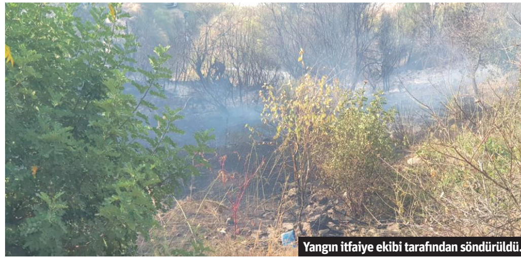
Yangın itfaiye ekibi tarafından söndürüldü.

■ ALANYA'DA bir kuyumcuya 12 bin TL değerinde sahte altın satan şahıs polis tarafından yakalandı. Dolandırıcılık olayı, Alanya'da bulunan bir kuyumcuya yaşandı. İsmi henüz öğrenilemeyen şahıs bir kuyumcuya giderek iş yeri sahibine 12 bin TL değerinde sahte altın sattı. Şahsın iş yerinden ayrılmasının ardından satın aldığı altının sahte olduğunu fark eden kuyumcu hemen polise ihbarda bulundu. İş yerinin kamera kayıtlarını inceleyen polis sahte altın satan şahsı çok geçmeden yakalayarak gözaltına aldı. Şahıs karakola götürülürken, polis sahte altınları el koydu. Sahte altın sattığı kuyumcunun zararını ödeyeceğini söyleyen şahıs çıkarıldığı mahkeme tarafından serbest bırakıldı. - Mehmet AL