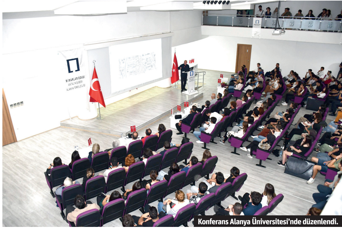
Konferans Alanya Üniversitesi'nde düzenlendi.

Konferansın açılış konuşmalarını Antalya Mimarlar Odası Başkanı Sayın Hasan Çerçiler ve Mimarlar Odası Alanya Şubesi Başkanı Sayın Gülderen Toprak yaparak, Murat Tabanlıoğlu'nun Alanya'da anlatılmasından duydukları memnuniyeti dile getirdiler. Mimar Murat Tabanlıoğlu, Atatürk Kültür Merkezi (AKM) dahil olmak üzere dünya genelinde birçok ülkede farklı ve yenilikçi projelere imza atmış bir isim olarak tanınıyor. Tabanlıoğlu konuş-