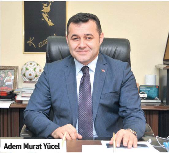
Adem Murat Yücel

■ HAYATA geçirdiği projelerle Alanya'nın çehresini değiştiren, Alanya Belediyesi'ni üreten, ürettikçe güçlenen ve kendi kendine yeten bir belediye haline getiren Alanya Belediye Başkanı Adem Murat