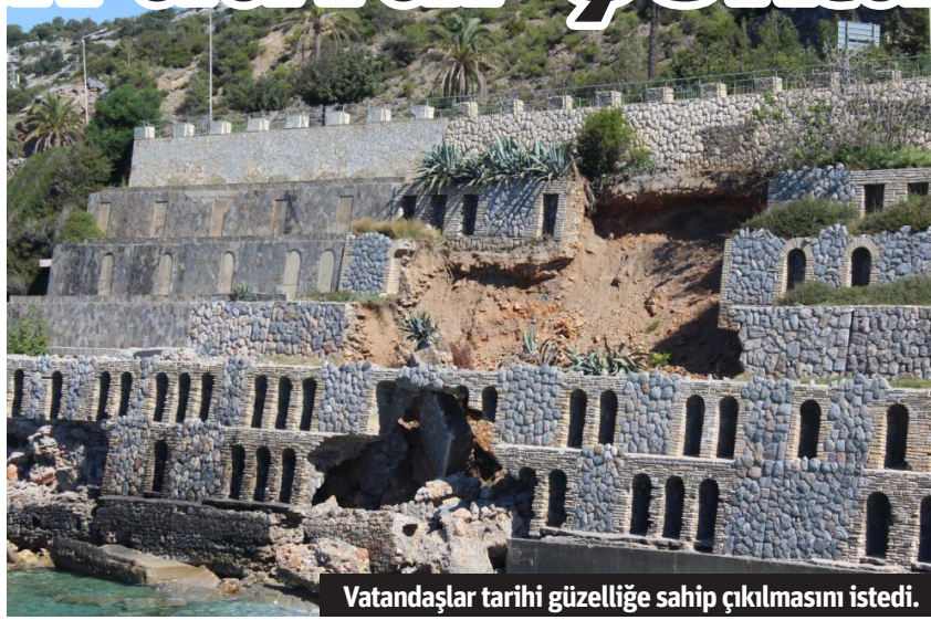
Vatandaşlar tarihi güzelliğe sahip çıkılmasını istedi.

Alanya’da turistik bir bölgede bulunan yaklaşık 80 yıllık duvarda çökme meydana geldi. Vatandaşlar duvardaki çökmenin onarılmasını isterken, yaz sezonunun yaklaşmasıyla bölgedeki yapıların bakımının yapılması çağrısında bulundu.