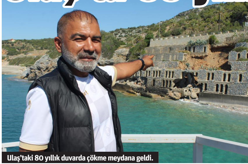
Ulaş’taki 80 yıllık duvarda çökme meydana geldi.