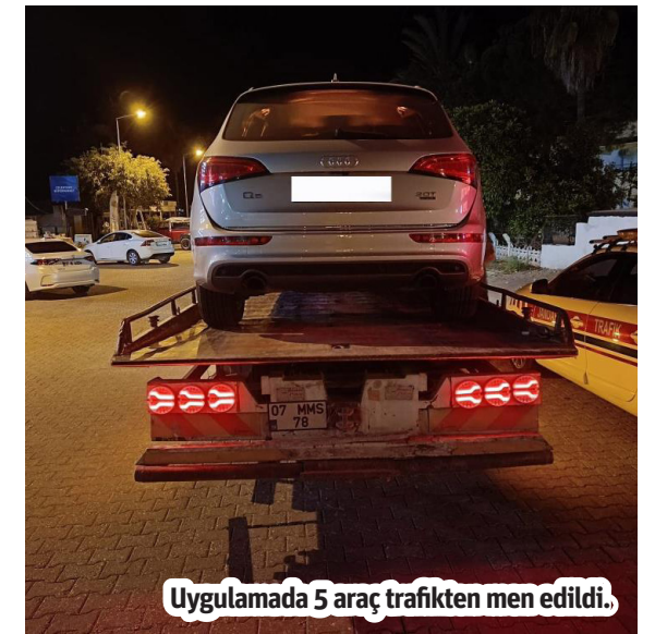
Uygulamada 5 araç trafikten men edildi.