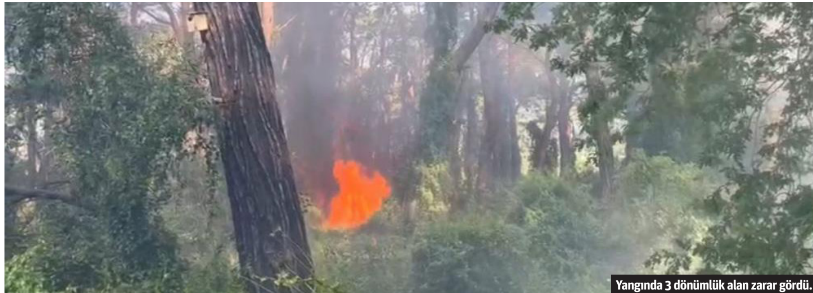
Yangında 3 dönümlük alan zarar gördü.

■ MANAVGAT'TA bulunan Sorgun Çamlığı'nda çıkan yangın ekiplerin hızlı müdahalesi sonucu kontrol altına alınırken yangında 3 dönüm arazi zarar gördü. Yangın, Manavgat'ın Acısu Mevkii'nde bulunan Sorgun Çamlığı'nda saat 09.20 sıralarında meydana geldi. 112 Acil Çağrı Merkezi'ne yapılan ihbar üzerine