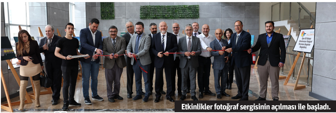
Etkinlikler fotoğraf sergisinin açılması ile başladı.

25 TIR LASTİK TOPLANDI Hem doğaya zarar veren hem görüntü kirliliğinin yanı sıra yağışlı havalarda içine biriken su nedeniyle sinek ve haşerelerin üreme yeri haline gelen atık lastikler ekipler tarafından toplanıyor. Araçlarla taşınarak belirlenen noktalarda istiflenen atık lastikler daha sonra geri dönüşüm tesislerine gönderiliyor. Bugüne kadar yapılan çalışmayla 25 TIR atık lastik toplanırken büyükşehir, bu faaliyetle hem çevrenin korunmasına hem de ülke ekonomisine katkıda bulunuyor. - Antalya Büyükşehir Belediyesi / Bülten