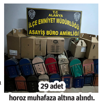
horoz muhafaza altını alındı.

■ ALANYA'DA horoz dövüşü-rerek kumar oynatan ve oynayan şahıslara işlem yapıldı. Alanya Cumhuriyet Başsavcılığı'nın talimatları doğrultusunda,