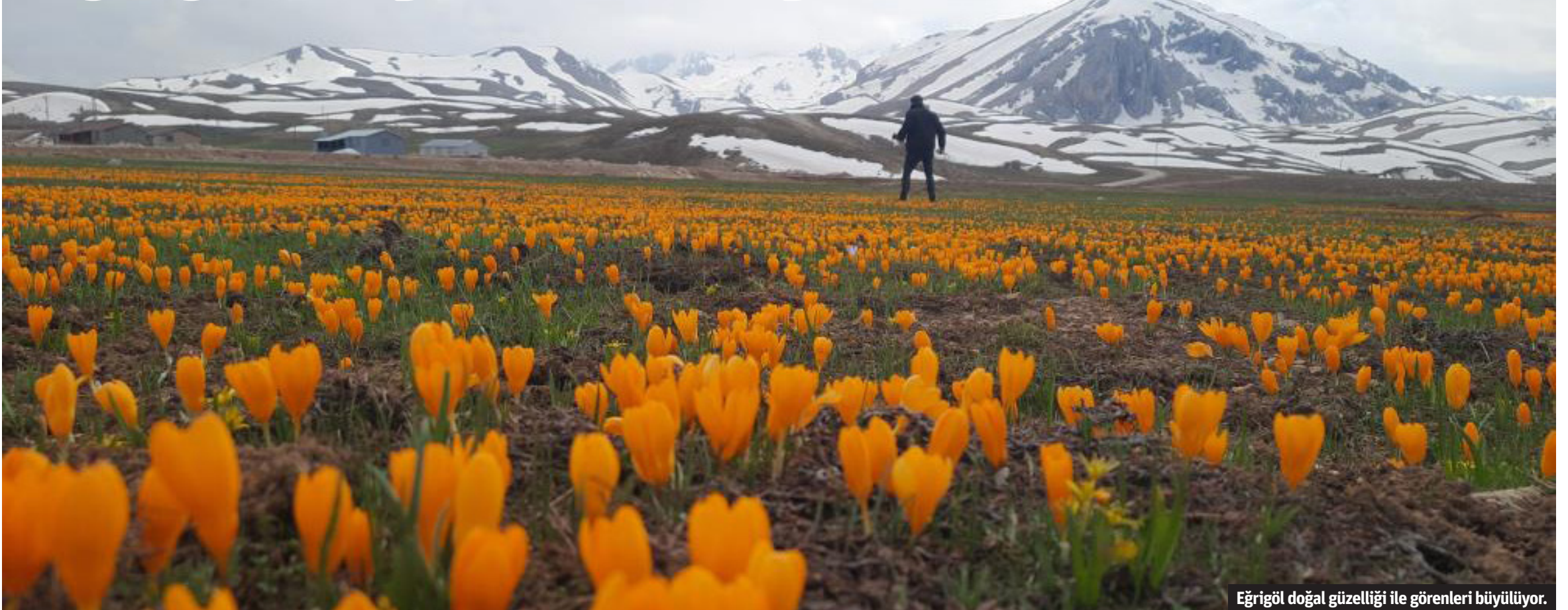
Eğrigöl doğal güzelliği ile görenleri büyülüyor.

■ TOROSLAR'IN zirvelerinde yer alan tabii güzellikleriyle cazibe merkezi olan Gündoğmuş'a bağlı Güzelbağ Yaylası'nda bulunan Eğrigöl, görenleri hayran bırakıyor. Antalya ve Konya sınırında, Geyik Dağları'nın eteklerindeki Taşeli Platosu'nda yer alan Eğrigöl, tabii güzellikleriyle dikkat çekiyor. Toroslar'ın en yüksek zirvelerinden Geyik Dağları'nın eteğinde 2 bin 100 metre rakımda bulunan Eğrigöl, bitki çeşitliliği, farklı renklerdeki çiğdemler ve endemik bitkileriyle dikkati çekerken, yaylacılar,