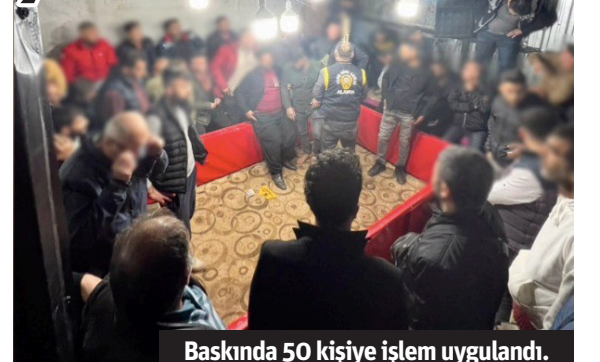
Baskında 50 kişiye işlem uygulandı.

■ ALANYA'DA horoz dövüşü-rerek kumar oynatan ve oynayan şahıslara işlem yapıldı. Alanya Cumhuriyet Başsavcılığı'nın talimatları doğrultusunda,