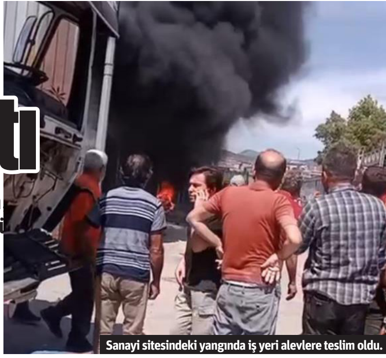
Sanayi sitesindeki yangında iş yeri alevlere teslim oldu.

■ YANGIN, öğle saatlerinde Payallar Mahallesi'nde bulunan Sanayi Sitesi'ndeki bir iş yerinde meydana geldi. İş yerinde henüz bilinmeyen bir nedenle yangın çıktı. Dumanların yükselmesiyle vatandaşların ihbarı üzerine olay yerine itfaiye ekipleri sevk edildi. Ekipler yangını kısa sürede söndürdü. Yangın nedeniyle iş yerinde maddi hasar oluştu. – İHA