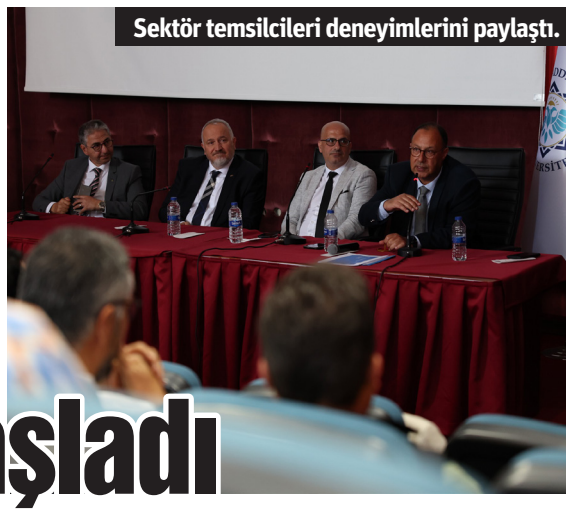
Sektör temsilcileri deneyimlerini paylaştı.