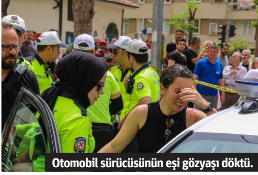
Otomobil sürücüsünün eşi gözyaşı döktü.

yaşayan kadını eşi sakinleştirmeye çalıştı. İlk müdahalesi olay yerinde yapılan sürücü ve eşi polis ekipleri