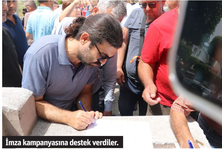
İmza kampanyasına destek verdiler.

uygun olmayacağını söyledi. Daha sonra bu şirketin burayı aldığını ve bugünkü sorunların bu şekilde karşımıza geldiğini görüyoruz. Sayıyorum zamanında ÇED raporunun alınmaması endişesi ile ÇED raporuna gerek yoktur yazısı nedeniyle bu işler yapılmış. Burada bütün Alanyalılar, otelciler suçluyuz. Bu kadar kıymetli bir şeyi sahip olamadık. Yazıklar olsun bize. Vatandaş denize sokmuyorlar. Denizin içine duvar yapıyorlar. Ben de bunlarla yasal olarak uğraştığım için manyak bu adam diyorlar. Elimden gelen bütün çalışmalarını yaptım. Minareyi çalan kılıfını