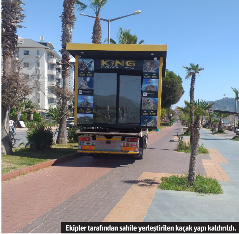
Ekipler tarafından sahile yerleştirilen kaçak yapı kaldırıldı.

Alanya Belediyesi Zabıta Müdürlüğü ekipleri, Kızılparı Mahallesi, Atatürk Caddesi'nde ihbar üzerine gittikleri alanda sahile yerleştirilen kaçak yapıyı kaldırdı.