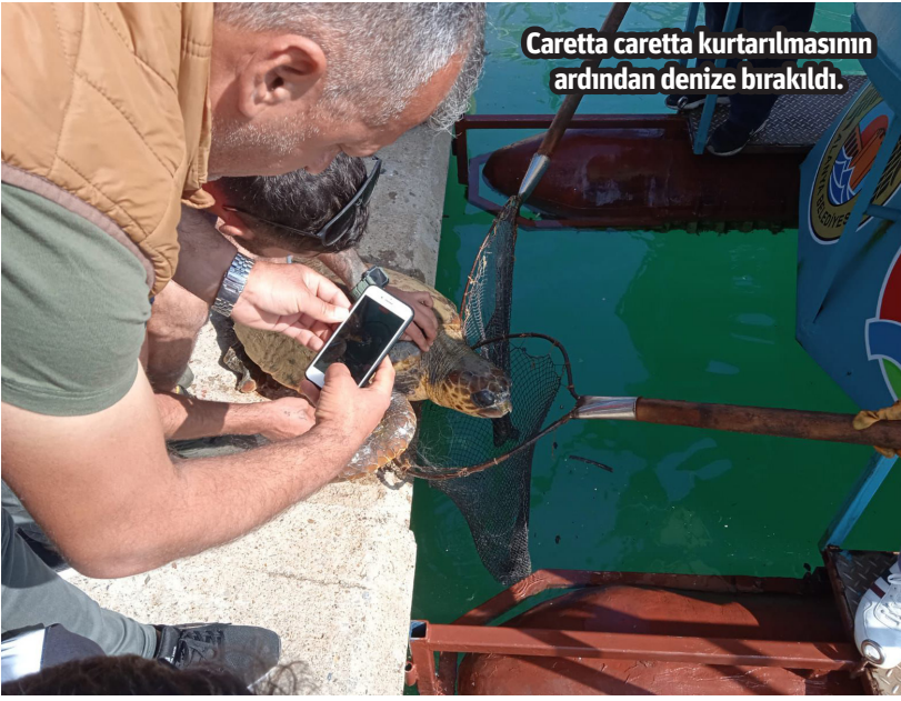
Caretta caretta kurtarılmasının ardından denize bırakıldı.

Filmi izlerken triplere girip karakterlerden hem nefret edip hem sevecek, zekalarını takdir ederken ahmak mısın yaa diyeceksiniz. Akıcı ve merak uyandırıcı bir yapım ben öneririm.