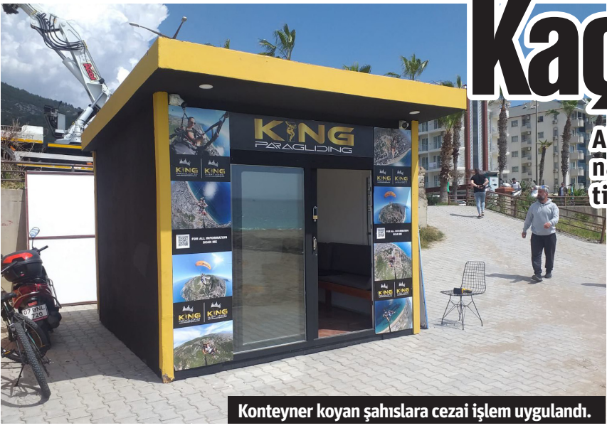
Konteyner koyan şahıslara cezai işlem uygulandı.

ALANYA Belediyesi Zabıta Müdürlüğü ekipleri, kent disiplinini sağlamak, halkın huzur ve güvenliğinin temini için çalışmalarına ara vermeden devam ediyor. Bu doğrultuda vatandaşlardan gelen Kızılparı Mahallesi, Atatürk Caddesi'nde kaçak yapı ihbarı üzerine olay yerine intikal eden zabıta ekipleri, sahile yerleştirilen kaçak yapıyı aynı gün içinde kaldırdı. Konteyneri koyduğu belirlenen şahıslara ise 775 Sayılı Gece Kondu Kanunu'na muhalefetten