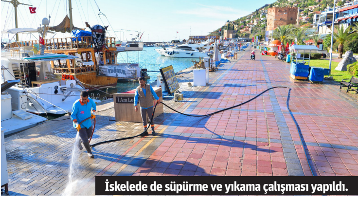
İskelede de süpürme ve yıkama çalışması yapıldı.

Alanya Belediyesi Temizlik İşleri Müdürlüğü ekipleri, Antalya Büyükşehir Belediyesi ekipleriyle birlikte koordineli şekilde Ramazan Bayramı öncesi kent genelinde temizlik çalışmalarını sürdürüyor.