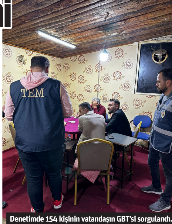
Denetimde 154 kişinin vatandaşın GBT'si sorgulandı.

ALANYA İlçe Emniyet Müdürlüğü'ne bağlı Asayiş, TEM, Narkotik, KOM, Önleyici ve Çevik Kuvvet ekiplerince Ramazan Bayramı öncesinde umuma açık mekanlar didik didik arandı. Denetlenen 16 mekanda 154 şahsın GBT'si sorgulanırken herhangi bir olumsuzluğa rastlanmadığı belirtildi. - Mehmet AL