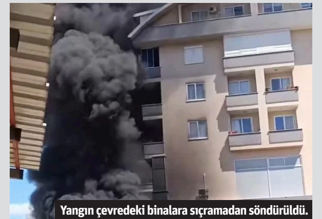
Yangın çevredeki binalara sıçramadan söndürüldü.

ALANYA'DA bir apartmanın bahçesinde çıkan yangın çevredeki binalara sıçramadan söndürüldü. Yangın, sabah saatlerinde Konaklı Mahallesi'nde meydana geldi. Edinilen bilgiye göre, altı katlı bir apartmanın bahçesinde henüz bilinmeyen nedenle yangın çıktı. Çevredeki vatandaşların ihbarı üzerine olay yerine Antalya Büyükşehir Belediyesi Alanya itfaiye ekibi sevk edildi. İtfaiye ekipleri alevleri çevre binalara sıçramadan kısa sürede söndürdü. Yangında ölen ve yaralanmanın olmadığı belirtildi. - Mehmet AL