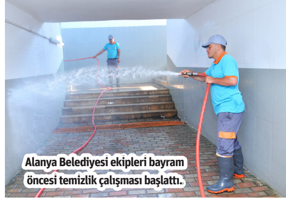
Alanya Belediyesi ekipleri bayram öncesi temizlik çalışması başlattı.

YAKLAŞAN Ramazan Bayramı öncesi Alanya Belediyesi Temizlik İşleri Müdürlüğü, şehrin dört bir yanında çalışmalarını hızlandırarak Alanya'yı bayrama hazır hale getiriyor. Ramazan Bayramı öncesi ekipler İskele, Çevre Yolu, Cuma Pazarı gibi şehrin genel olarak yoğun kullanılan pek çok noktada yıkama ve süpürme çalışmaları gerçekleştirdi. Antalya Büyükşehir Belediyesi ekipleriyle de birlikte mezarlıklarda temizlik