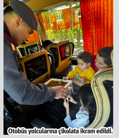
Otobüs yolcularına çikolata ikram edildi.

ALANYA İlçe Jandarma Komutanlığı yerli ve milli arabamız TOGG ile yaptıkları yol uygulamasında sürücülere broşür dağıtarak ardından vatandaşlara çikolata ikramında bulundu. Alanya İlçe Jandarma Komutanlığı ekipleri tarafından Ramazan Bayramı öncesi yerli ve milli arabamız TOGG ile Avsallar Mahallesi'nde yapılan yol uygulamasında sürücülere broşür dağıttı. Jandarma ekipleri tarafından sürücülere emniyet kemeri kullanımının önemi, araç kullanırken cep telefonu kullanılmaması konularında bilgilendirmeler yapılmasının ardından otobüs yolculuğu yapan çocuklara ve vatandaşlara çikolata ikramında bulunuldu. - Mehmet AL