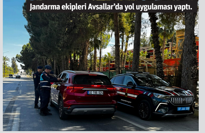
Jandarma ekipleri Avsallar'da yol uygulaması yaptı.