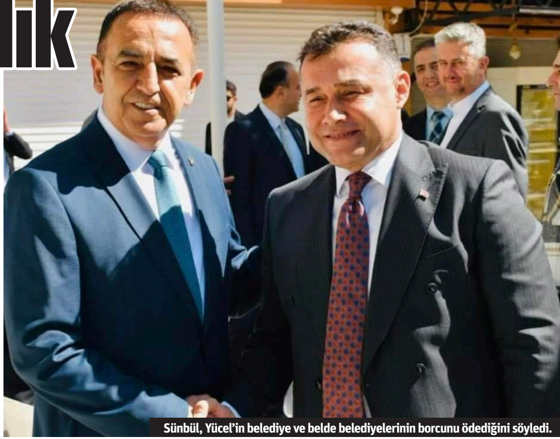
Sünbül, Yücel'in belediye ve belde belediyelerinin borcunu ödediğini söyledi.

Bahsi geçen kişi ile alakalı gereğini Sayın Özçelik'in yapacağını umut ediyoruz" dedi. "YÜCEL 10 YIL BOYUNCA DEVRALDIĞI BORCU ÖDEDİ"