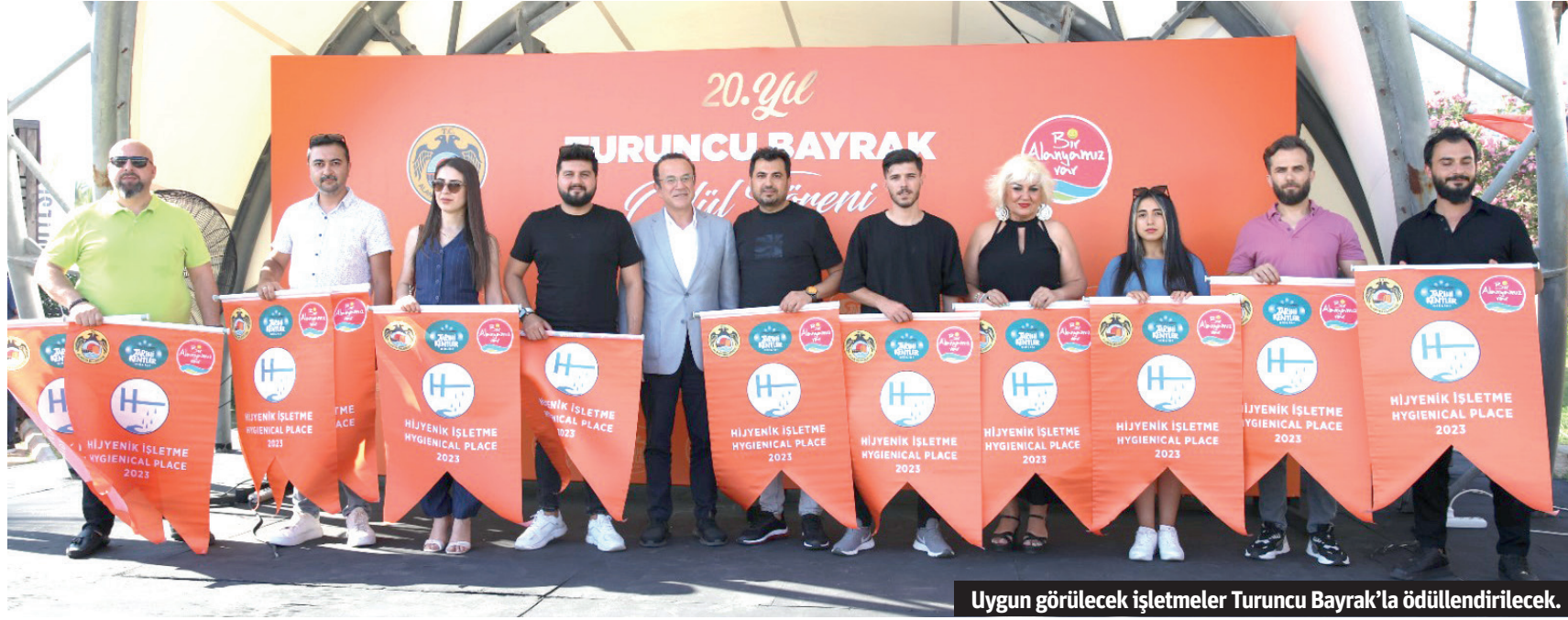
Uygun görülecek işletmeler Turuncu Bayrak'la ödüllendirilecek.

'Alanya Belediyesi Turuncu Bayrak Yarışması' için başvurular başladı. Bu yıl 21'nci kez düzenlenen yarışma sonrası uygun görülecek işletmeler Turuncu Bayrak'la ödüllendirilecek.