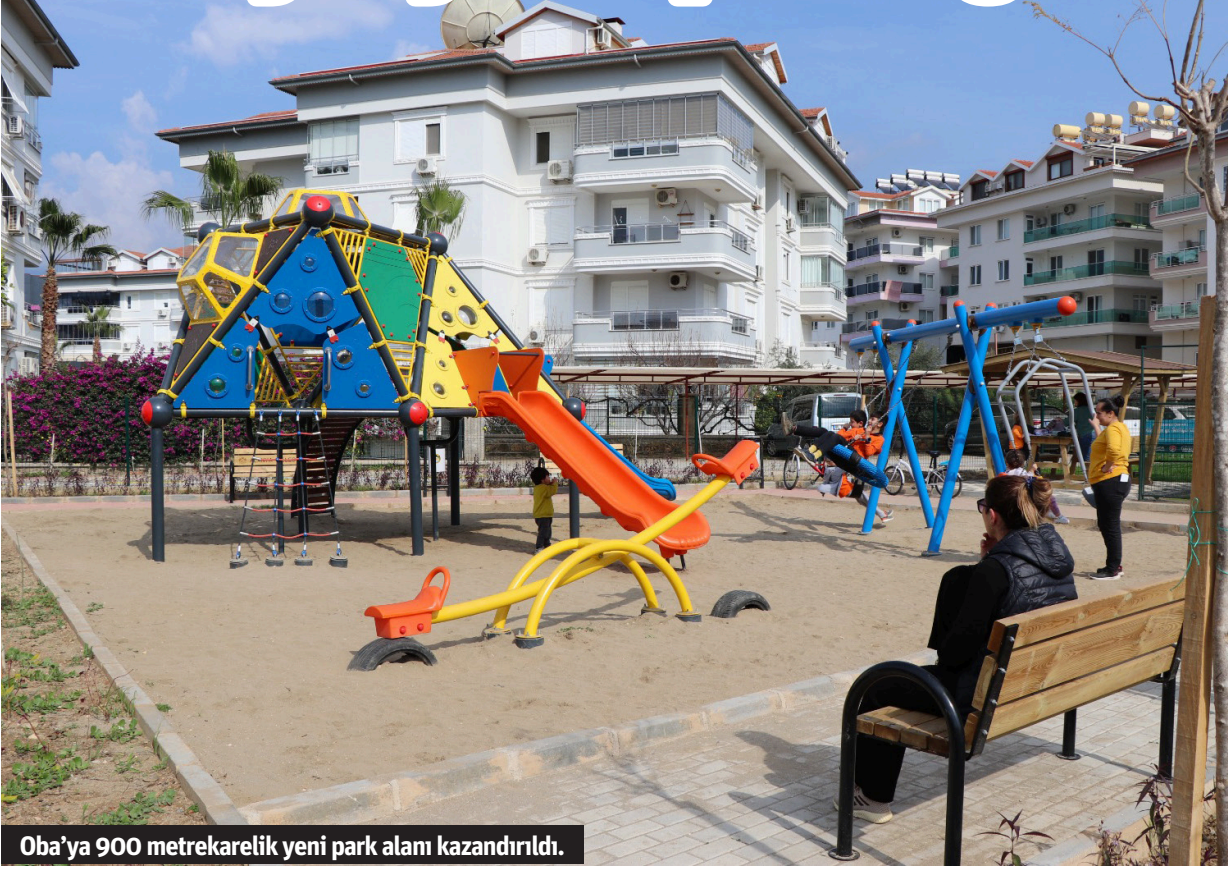
Oba'ya 900 metrekarelik yeni park alanı kazandırıldı.

Alanya Belediyesi nüfus yoğunluğunun fazla olduğu Oba Mahallesi'ne 900 metrekare büyüklüğünde yeni bir çocuk parkı daha kazandırdı.