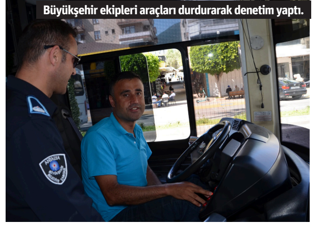
Büyükşehir ekipleri araçları durdurarak denetim yaptı.

ALANYA'DA turizm sezonu öncesi gelen misafirlerin herhangi bir sorun yaşamaması için Antalya Büyükşehir Belediyesi Alanya Ulaşım Birimi çalışmalarını yoğunlaştırdı. İlçeye gelen yerleşik ve yabancı turistlerin yanı sıra ilçede yaşayan vatandaşların sorun yaşamaması için toplu ulaşım araçları ve taksiler mercek altına alındı. Alanya'nın farklı noktalarında denetim çalışmalarını sürdüren Büyükşehir ekipleri, araçların genel durumu, tanıtıcı yazılar, temizlik, sürücünün kılık kıyafet ve davranışı, taksimetrenin açılıp açılmadığı ve bulundurulması gereken resmi evraklar konusunda araçları durdurarak denetim yaptı. Eksikler konusunda