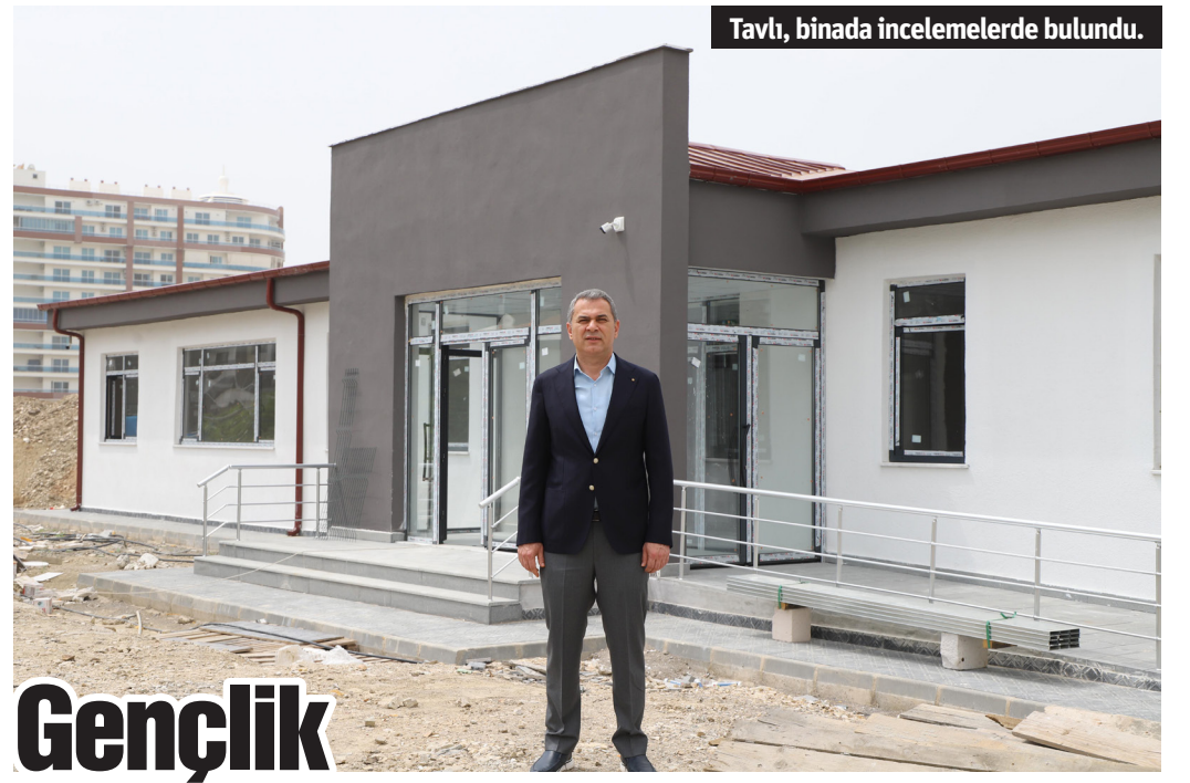
Tavlı, binada incelemelerde bulundu.

zaman, her dakika konfor alanının dışına çıkmaya hazırızdır" diye konuştu. "EN İYİLERLE ÇALIŞIN" İyi bir liderin en iyilerle çalışıp, cömert olması gerektiğine de vurgu yapan Kaynar, "Buranın büyük bir kısmı muhakkak iş insanı, yani patron. Ben buradan size şunu söylemek istiyorum. Kıymetli patronlarımız en iyilerle çalışın ve her zaman cömert olun. İyi bir lider olmak istiyorsanız bu söylediklerim çok önemli. Ayrıca iyi bir lider dinlemeyi bilir. Dünyadaki herkes çok iyi konuşabilir ama çok azı iyi bir dinleyicidir. Bu yüzden dinlemek çok önemli" dedi. - ALTSO / Bülten