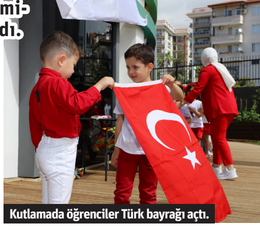
Kutlamada öğrenciler Türk bayrağı açtı.

eglençli saatler geçirdiler. Renkli görüntülere sahne olan kutlamada minik öğrencilerin yaptığı çalışmalar, kreş bahçesinde sergilendi. Müzikler, marşlar ve danslarla yapılan etkinlik, izleyenlerden büyük alkış topladı. İlgi odağı olan çocuklar, palyaçolarla dans ederken, balon şovuyla bayram coşkusunu doyasıya yaşadılar. Pamuk şeker ikram edilen öğrenciler, gün boyunca eğlendi. – Alanya Belediyesi / Bülten