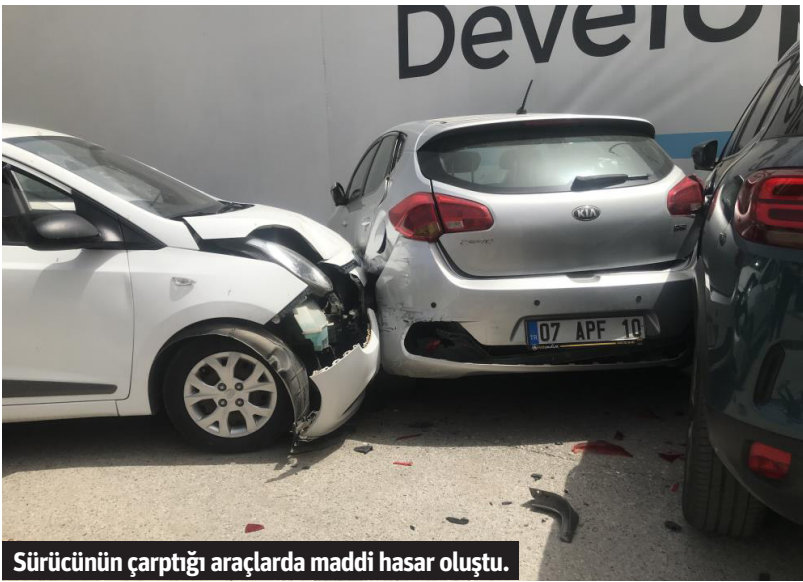
Sürücünün çarptığı araçlarda maddi hasar oluştu.

■ ANTALYA'DA sürücüsünün park etmek isterken kontrolünden çıkan otomobil, 3 otomobile çarptıktan sonra durabildi. Kazada otomobillerde maddi hasar meydana geldi. Sürücü olay meydana gelen 112 sağlık ekiplerinin ilk müdahalesinin ardından ambulans ile hastaneye kaldırıldı. Trafik polisleri ise inceleme başlattı. Park halindeki araçlarda, otoparkta ve caddede kimse olmaması muhtemel bir faciyanın önüne geçti.