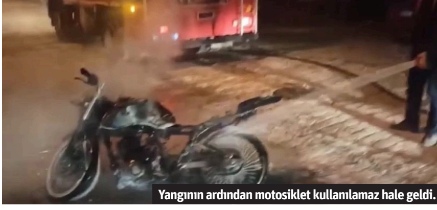
Yangının ardından motosiklet kullanılamaz hale geldi.

Alanya'da park halinde iken yanmaya başlayan motosiklet itfaiye ekiplerince söndürüldü. Motosiklet kullanılamaz hale geldi.