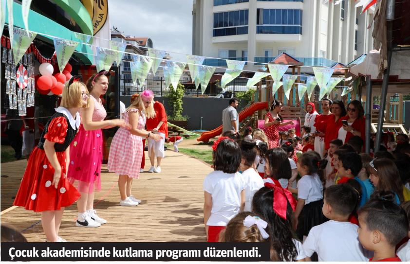
Çocuk akademisinde kutlama programı düzenlendi.