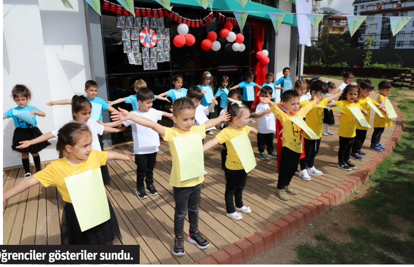
Öğrenciler gösteriler sundu.