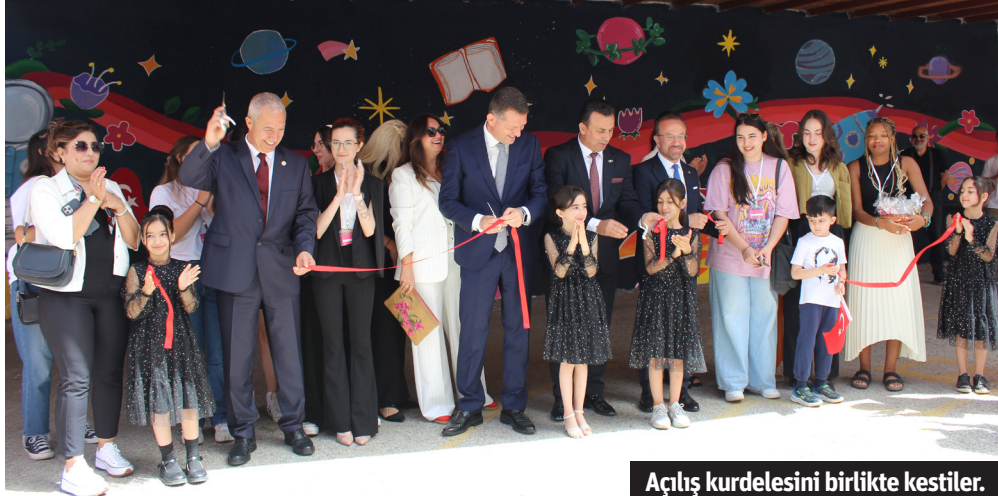
Açılış kurdelesini birlikte kestiler.