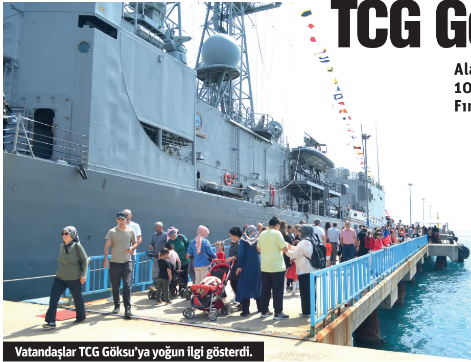
Vatandaşlar TCG Göksu'ya yoğun ilgi gösterdi.

Alanya Belediyesi'nin farklı ülkelerdeki kardeş şehirlerinden gelen 50 çocuğun ve kentte öğrenim gören yaban öğrencilerin de yer aldığı program, resim, şiir yarışmalarının ödül töreni, şiirlerin okunması, müzik dinletisi, 100 Çocuk 100 Atatürk Gösterisi ve halk oyunları ile Türk bayrağı sunumunun ardından sona erdi. Renkli görüntülere sahne olan ve yoğun ilgi gören çocukların gösterileri, izleyenlerden büyük alkış aldı. - Alanya Belediyesi / Bülten