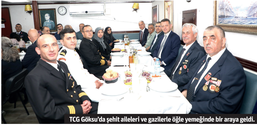
TCG Göksu'da şehit aileleri ve gazilerle öğle yemeğinde bir araya geldi.