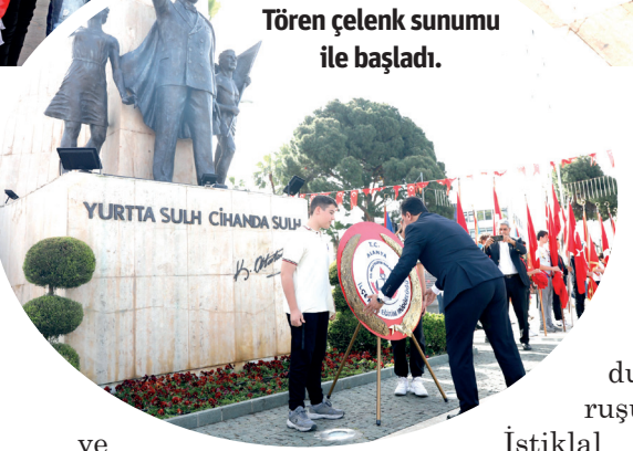
Tören çelenk sunumu ile başladı.

ALANYA BELEDİYESİ TÜRK BAYRAĞI DAĞITTI Öğrencilerin gösterilerini sergilediği etkinlik alanının girişine stant kuran Alanya Belediyesi, geniş katılımlı programda vatandaşlara Türk bayrağı dağıttı. Saygı