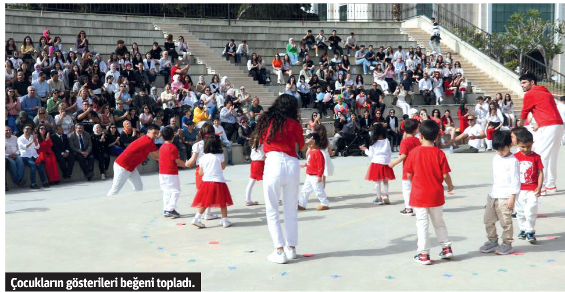
Çocukların gösterileri beğeni topladı.