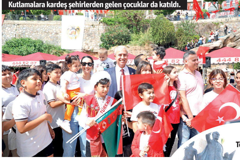
Kutlamalara kardeş şehirlerden gelen çocuklar da katıldı.

Alanya'da '23 Nisan Ulusal Egemenlik ve Çocuk Bayramı' ile TBMM'nin açılışının 104. yıl dönümünü coşkuyla kutlandı. Programda Alanya Belediyesi'nin yurt dışındaki kardeş şehirlerinden gelen çocuklar da yer aldı.