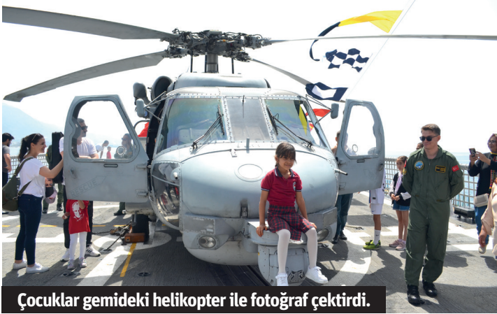
Çocuklar gemideki helikopter ile fotoğraf çekti.

Alanya'da '23 Nisan Ulusal Egemenlik ve Çocuk Bayramı'nın 104'üncü yıl dönümünde halka açılan TCG Göksu (F-497) Fırkateyni ilçede yaşayan vatandaşlardan yoğun ilgi gördü.