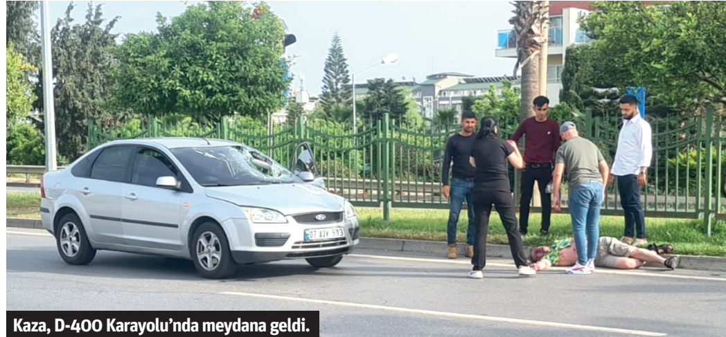
Kaza, D-400 Karayolu'nda meydana geldi.

Alanya'da yolun karşısına geçmeye çalışırken otomobilin çarptığı erkek Rus turist ağır yaralandı.