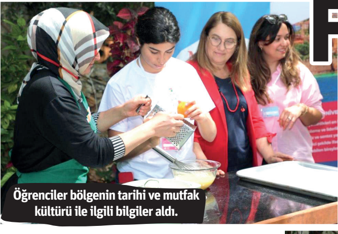
Öğrenciler bölgenin tarihi ve mutfak kültürü ile ilgili bilgiler aldı.

Alanya Üniversitesi Sanat ve Tasarım Fakültesi tarafından bu yıl ilk kez düzenlenen İletişim ve Tasarım Festivali'nde öğrenciler Alanya mutfağında özel bir yeri olan S pasta yapımı ile ilgili bir çalışmaya katıldı.