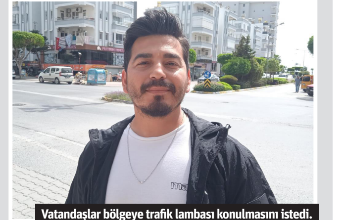
Vatandaşlar bölgeye trafik lambası konulmasını istedi.

■ ALANYA'NIN Barbaros Caddesi Kavşağı'nda meydana gelen trafik kazaları sebebiyle bölgede yaşayan vatandaşlar adeta isyan etti. Vatandaşlar kavşağa önlem alınmasını isterken, kavşakta art arda yaşanan trafik kazaları güvenlik kameraları tarafından kaydedildi. Mahmutlar Mahallesi, Barbaros Caddesi'nde bulunan kavşakta sıkça maddi hasarlı kazalar meydana geliyor. Bölgede yaşayan esnaf ve vatandaşlar trafiğin yoğun olarak yaşandığı kavşakta trafik kazalarının azaltılması için yetkililere çağrıda bulundu. Vatandaşlar, kavşakta sıkça trafik kazalarına şahit olduklarını belirterek, bölgeye önlem alınmasını istedi. Söz konusu kavşakta yayaların karşıdan karşıya geçmekte zorlandığını dile getiren vatandaşlar, kavşakta günde 3-4 kazaya şahit olduklarını söyledi. Ayrıca kavşağın yoğun çevrede aydınlatma sisteminin de yetersiz olduğunu belirten bölge halkı, yeterli ışıklandırma sisteminin olması gerektiğini ifade etti.