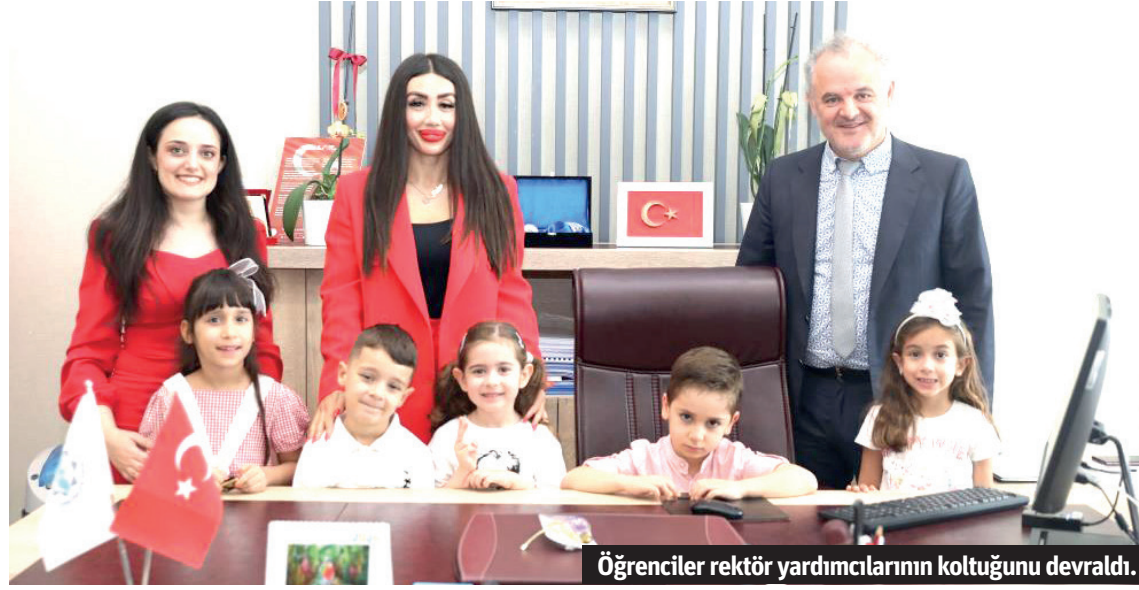
Öğrenciler rektör yardımcılarının koltuğunu devraldı.

Alanya Alaaddin Keykubat Üniversitesi (ALKÜ) Uygulama Anaokulu öğrencileri, '23 Nisan Ulusal Egemenlik ve Çocuk Bayramı' dolayısıyla Rektör Yardımcılarının koltuklarını devraldı. ALKÜ'ü minik yürekler, 23 Nisan için hazırladıkları gösteri ve danslarıyla da büyüklerinin gönüllerini fethettiler.