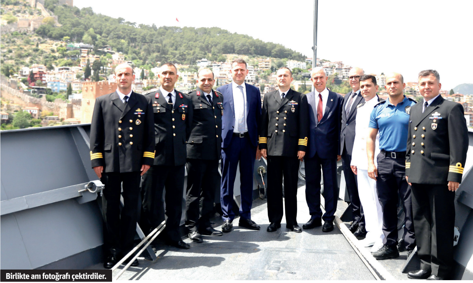
Birlikte an fotoğrafı çektiler.

Alanya'da '23 Nisan Ulusal Egemenlik ve Çocuk Bayramı' kutlamalarına katılan ilçe protokolü, TCG Göksu Fırkateyni'ni ziyaret ederek, şehit aileleri ve gazilerle öğle yemeğinde bir araya geldi.