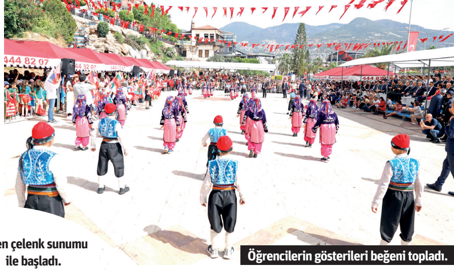
Öğrencilerin gösterileri beğeni topladı.