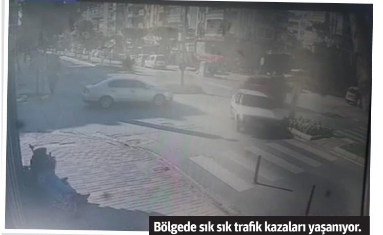
Bölgede sık sık trafik kazaları yaşanıyor.