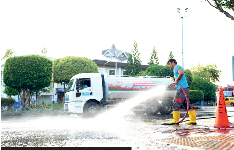
Belediye ekipleri caddeleri temizliyor.

Temizlik çalışmalarını özenle sürdüren Alanya Belediyesi ekipleri, caddeler, sokaklar ve kaldırımları, temizlik aracıyla yıkayıp tertemiz bir görünüme kavuşturuyor.