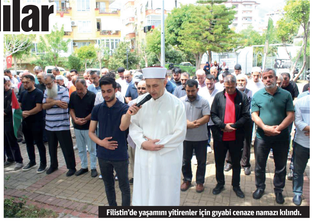
Filistin'de yaşamını yitirenler için gıyabi cenaze namazı kılındı.

dan tarafta mı? Bizler zaferden sorumlu değiliz kardeşlerim. Bizler üzerimize düşen vazifeyi yerine getirerek Allah'ın yardımının geleceği gün için beklemekten sorumluyuz. Gelin ısrarla boykota devam edelim. Gelin zulmü haykırmaktan geri durmayalım. Filistin'i, Doğu Türkistan'ı gündemimizden hiç düşürmeyelim. Kardeşlerimize maddi manevi desteğimizi esirgemeyelim ve bunları yaparken günlük yaşantımızın her alanında Rabbimizin rızasını gözeterek hareket edelim" dedi. – İHA