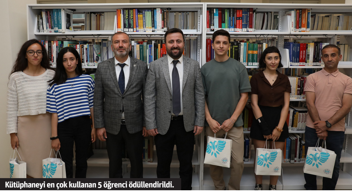
Kütüphaneyi en çok kullanan 5 öğrenci ödüllendirildi.