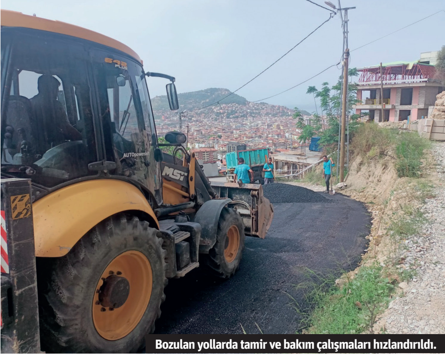
Bozulan yollarda tamir ve bakım çalışmaları hızlandırıldı.

Alanya Belediyesi kent genelindeki yolların tamir ve bakım çalışmalarına hız verdi. Onarım çalışmalarıyla şehir içi ulaşım kalitesinin yükseltilmesi hedefleniyor.