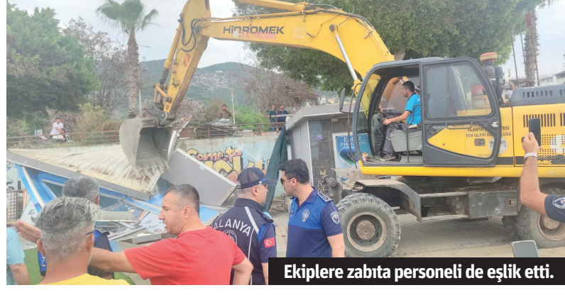
Ekiplere zabıta personeli de eşlik etti.