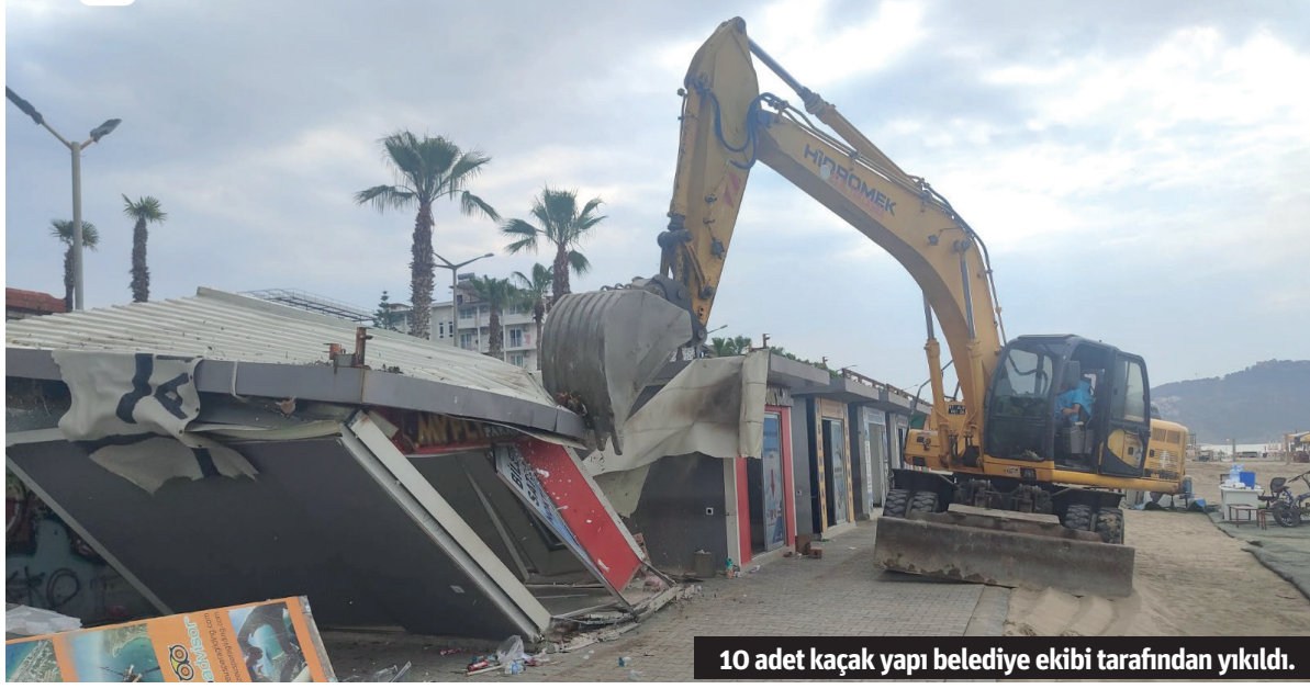
10 adet kaçak yapı belediye ekibi tarafından yıkıldı.

günden bu yana kaçak yapılarla mücadele ederek, asla taviz vermeyeceklerinin altını önemle çizen Belediye Başkanı Osman Tarık Özçelik, kent genelinde bulunan tüm kaçak yapıların tespitiyle ilgili çalışmaların büyük bir titizlik içerisinde devam ettiğini kaydetti. Başkan Özçelik, bu kapsamda tespiti yapılan kaçak yapıların ivedilikle yıkımlarının yapılacağını söyledi. – Alanya Belediyesi / Bülten