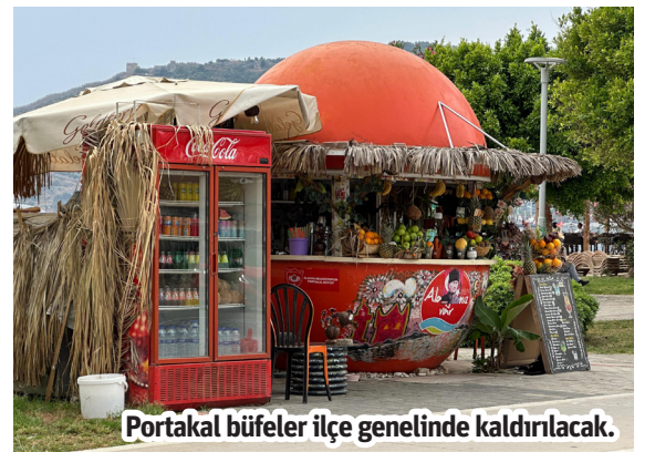
Portakal büfeler ilçe genelinde kaldırılacak.

ALANYA'DA genellikle sahil şeridinde yer alan ve Okurcalar'dan Demirtaş'a belli aralıklarla konuşlanan portakal büfeler tarih oluyor. Alanya'da genelde sahil şeridinde yer alan portakal büfeler CHP'li Alanya Belediye Başkanı Osman Özçelik'in kararıyla Alanya genelinde kaldırılacak. Alanya'da küçük esnafın tepki gösterdiği Okurcalar'dan Demirtaş'a kadar belirli aralıklarda yer alan portakal büfeleri kiralyan kişilere, Alanya Zabıtası tarafından yazılı ve sözlü tebliğ gelmeye başladı. – Haber Merkezi