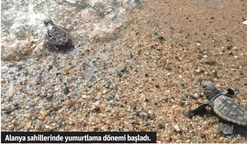
Alanya sahillerinde yumurtlama dönemi başladı.