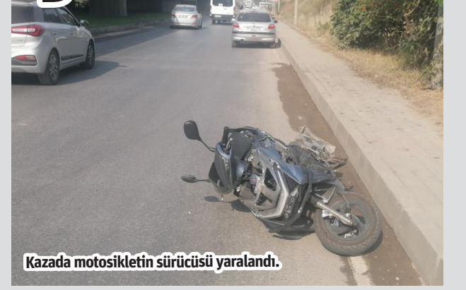
Kazada motosikletin sürücüsü yaralandı.

Manavgat'ta motosiklet ile otomobilin çarpışması sonucu meydana gelen kazada motosiklet sürücüsü yaralandı.