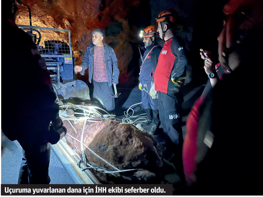
Uçuruma yuvarlanan dana için İHH ekibi seferber oldu.

Alanya'da kamyondan düşüp uçuruma yuvarlanan dana, İHH ekiplerinin 10 saatlik çalışmasıyla kurtarıldı.