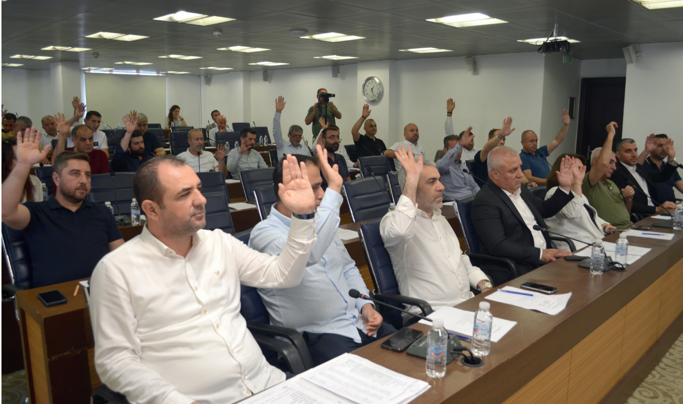
ALTSO'nun aylık olağan meclis toplantısı düzenlendi.

için ihalenin olması fırsat senesi. Bizim için de iyi bir fırsat. Bunu iyi değerlendirebilirsek kökten daha sonra çözebiliriz. Şu da yanlış. İskelede her sene kavga oluyor. 10 kavga oluyorsa 8'i orada gezenle, müşteriler kendi aralarında oluyor. 2'si esnaf arasında oluyordur ama esnaf böyle, esnaf böyle deniyor. Sosyal medyada gördüm. Bu bizim de canımızı yaktı. Topluma böyle lanse edilmek istemeyiz" dedi. "HERKEŞİN MENFAATİNİ KORUYACAK YAPILANMAYA İHTİYAÇ VAR" Erdem, "Şehre bütün bakmak lazım. Yatların olduğu bölge sadece yatçıların değil. Şehrin tamamının. Hatta buraya gelen turistlerin de alanı. Dolayısıyla herkesin menfaatini ortak şekilde koruyup kollayacak bir yapılanmaya ihtiyaç var. Orada sizlere çok görev düşer. Ürkmezer ile konuştum. Önümüzdeki 1-2 gün içinde kooperatifle bir araya geleceğini söyledi. Bu tür olumsuzlukların yaşanmaması için sizlerin bir tık daha çaba sarf etmesi lazım" diye konuştu. - Erkan Uysal