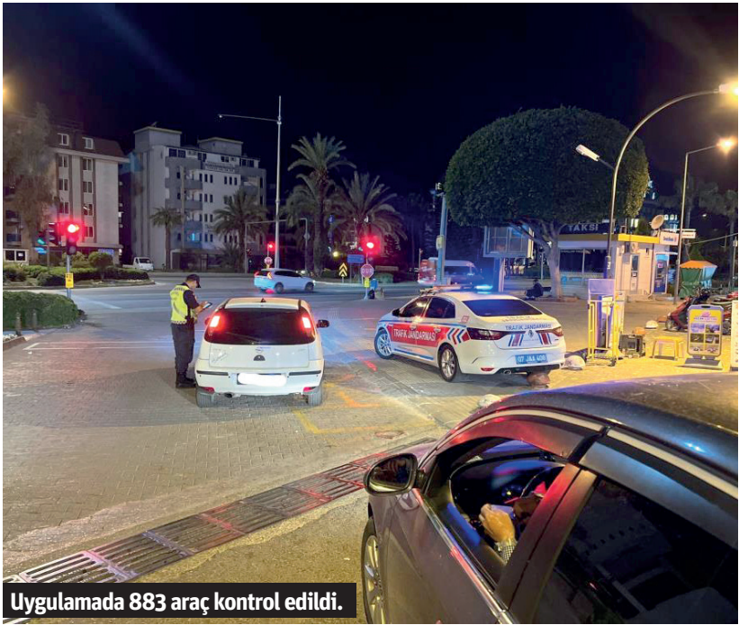
Uygulamada 883 araç kontrol edildi.

ALANYA'DA jandarma komutanlığı ekipleri tarafından yapılan genel trafik uygulamasında 8 araç trafikten men edildi. Alanya İlçe Jandarma Komutanlığı tarafın-