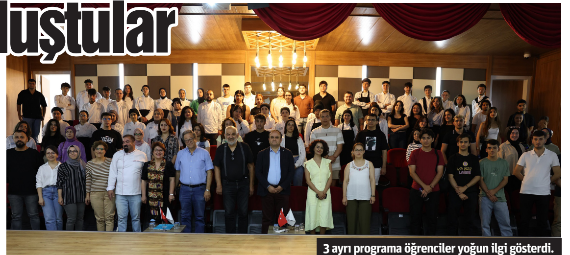
3 ayrı programa öğrenciler yoğun ilgi gösterdi.