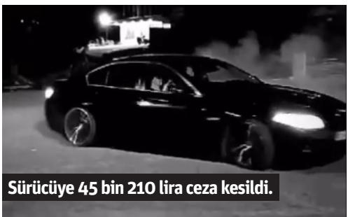
Sürücüye 45 bin 210 lira ceza kesildi.

Alanya'da otomobiliyle drift yaptığı tespit edilen sürücüye 45 bin 210 lira ceza uygulandı.