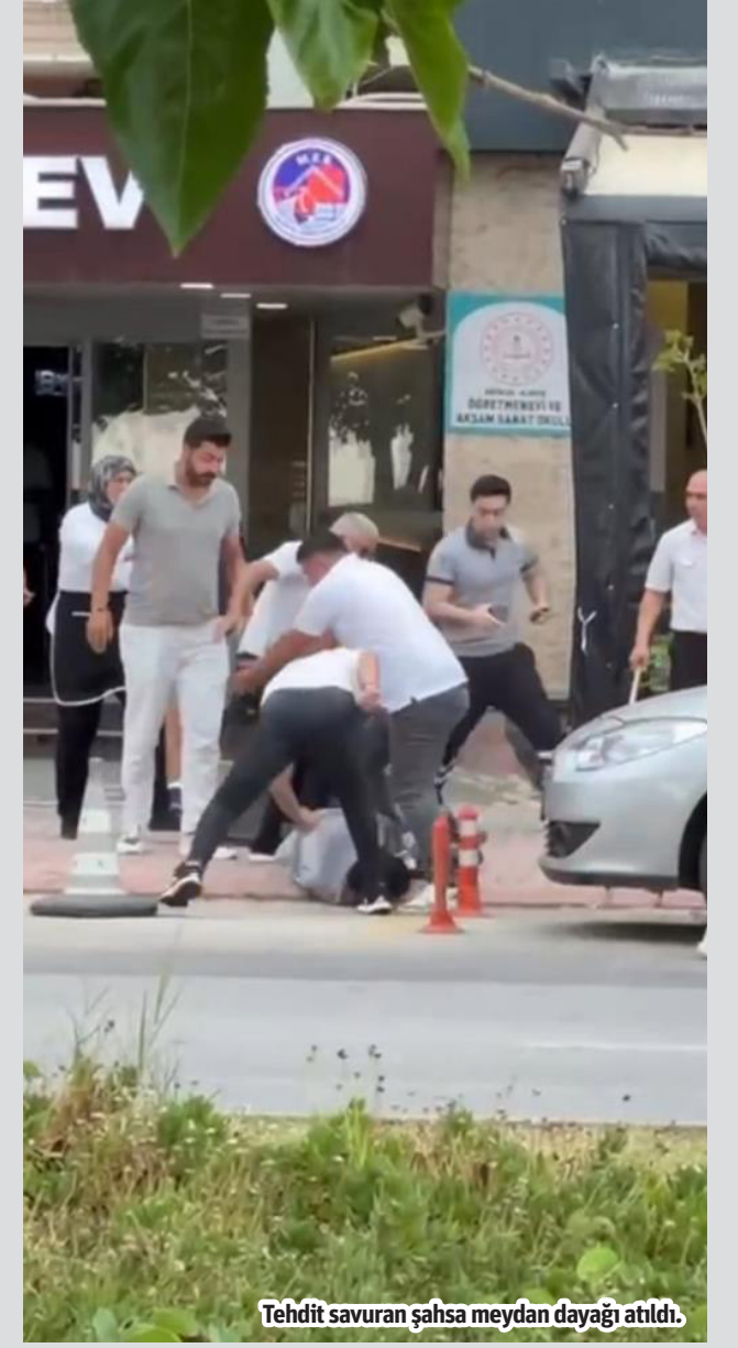
Thedid savuran şahsa meydan dayacağı atıldı.

ALANYA'DA bir kişi bıçakla saldırdığı kişilerden sandalye ve sopalarla meydana dayacağı yedi. Şahsın dayak yediği anlar cep telefonu kamerasıyla kaydedildi. Olay, Atatürk Bulvarı üzerinde yer alan Alanya Öğretmenevi önünde meydana geldi. Edinilen bilgiye göre, kimliği belirsiz bir şahıs elindeki bıçakla öğretmenevi personeliyle sözlü tartışma yaşadı. Ardından personele bıçağı zaman zaman sallayan şahıs, öğretmenevinin kapısından uzaklaşırken içerden çıkan bir kişi ise elinde sandalye ile arkasından vurdu. Görevli personel sandalyeyle şahsa arka arkaya vurmaya devam etti. Olaya çevredeki esnaf da dahil olurken saldırgan şahsa bazı vatandaşlar da sopa ve tekmeler vurdu. Yere düşen şahsa, yaklaşık 7 kişilik grup tarafından adeta meydan dayacağı atıldı.