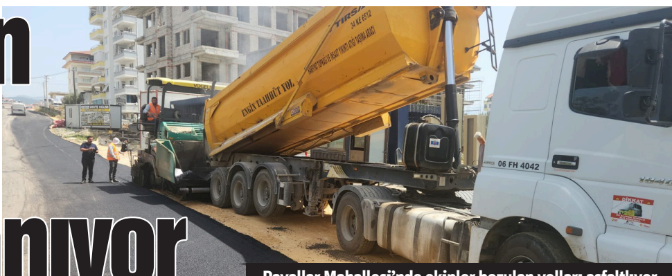
Payallar Mahallesi'nde ekipler bozulan yolları asfaltlıyor.

Antalya Büyükşehir Belediyesi ASAT Genel Müdürlüğü, Payallar Mahallesi'nde su şebekesini tamamladığı bölgede bozulan yolları asfaltlıyor.