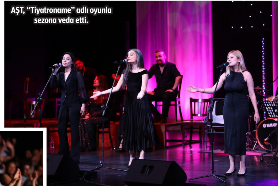
AŞT, "Tiyatroname" adlı oyunla sezona veda etti.

kin oyunlarından kesitler sunan müzikal tarzındaki "Tiyatroname", izleyenlere benzersiz anlar yaşattı.