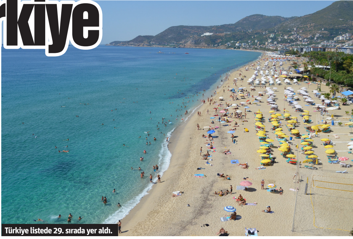
Türkiye listede 29. sırada yer aldı.

TURİZMİ EN FAZLA ÖNCELİKLENDİREN İKİNCİ ÜLKE TÜRKİYE Seyahat ve Turizm "Gelişmişlik" Endeksi'ne göre Türkiye, 'seyahat' ile 'seyahat ve turizm önceliklendirilmesi' göstergesinde yüzde 14 ilerleme kaydederek 18 sıra birden yükseldi ve dünyanın ikinci ülkesi oldu. Türkiye hava yolu taşımacılığı altyapısında da önemli bir gelişme gösterirken endeksin bu göstergesinde 10 sıra birden yükseldi ve dünyada ilk 10 ülke arasına girmeyi başararak sekizinci sırada yer aldı. Raporun kültürel varlıklar göstergesinde 13'üncü sıradaki konumunu korumayı başaran Türkiye, eğlence dışı alanlarda 7 basamak yükselerek 16'ncı sıraya ulaştı. Doğal kaynaklar kriterinde ise 24 sıra birden yükseliş yaşanırken endeksin bu kategorisinde Türkiye 32'nci oldu. Endekste fiyat rekabetçiliği, turist hizmetleri ve altyapısı, emniyet ve güvenlik, insan kaynakları ve iş gücü piyasası, talep sürdürülebilirliği ile iş ortamı Türkiye'nin gelişime açık göstergeler olarak raporlandı.