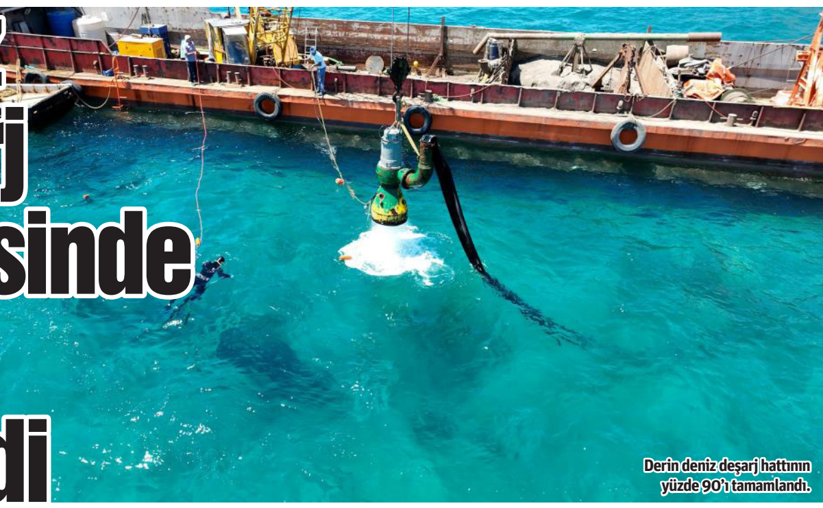
Derin deniz deşarj hattının yüze 90'ı tamamlandı.

Antalya Büyükşehir Belediyesi ASAT Genel Müdürlüğü'nün Gazipaşa'da yapımına başladığı ve mevcut arıtma tesisinin 4 katı büyüklüğünde bir sistemi kaldırabilecek kapasiteye sahip derin deniz deşarj hattının yüzde 90'ı tamamlandı.