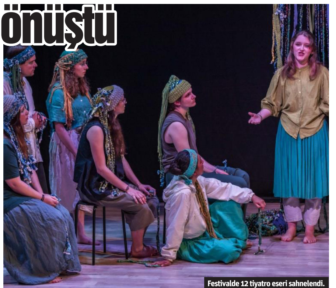
Festivalde 12 tiyatro eseri sahnelendi.

Tiyatro Akademi "Japon Kuklası" 17 Mayıs'ta TOBB ETÜ Tiyatro Topluluğu "Üç Kurşuk Opera" ve Akdeniz Üniversitesi Tiyatro Topluluğu "Sessizlik" eserlerini izleyicilerle buluşturdu. 18 Mayıs'ta ise Tabib-ül Curcuna topluluğu "Salaklar Sofrası" ve Almanya'dan Shantihton Construction topluluğu "Ossia" eserleri ile izleyicilerinin karşısına çıktı. Festivalin son gününde ise topluluk tarafından "Hayvan Çiftliği" ve Oyunevi Tiyatro Topluluğu tarafından "Dış Ses" oyunları sahnelendi. Sponsor firmalar tarafından desteklenen festivalin tüm oyunları, Akdeniz Üniversitesi Atatürk Konferans Salonu'nda sahnelendi. 30 YILLIK TİYATRO TOPLULUĞU Akdeniz Üniversitesi Tiyatro Topluluğu, 1995 yılında kuruldu. Her yıl en az üç oyun sahneye koyan topluluk, her yıl ayrıca bir festival ve bir turne düzenlemeye devam ediyor. Topluluk, turne ile farklı şehirlerdeki okullarda ve sahnelerde oyunlarını sergilerken, ulusal veya uluslararası yaptığı festivalle de bir hafta boyunca yurt içinden veya yurt dışından farklı okullardaki toplulukları misafir ediyor. - İHA