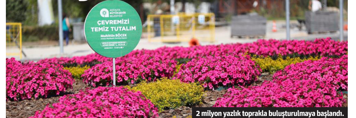
2 milyon yazlık toprakla buluşturulmaya başlandı.

■ ANTALYA Büyükşehir Belediyesi Hurma Bitki Üretim Tesisi'nde üretilen 2 milyon yazlık çiçek, kent güzelleştirme çalışmaları kapsamında toprakla buluşturuluyor. Antalya Büyükşehir Belediye Park ve Bahçeler Dairesi Başkanlığı ekipleri, kent merkezi ve ilçelerin rengarenk ve güzel görünmesi için çalışmalarını sürdürüyor. Antalya'nın cadde, sokak,