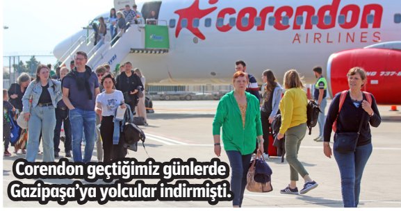
Corendon geçtiğimiz günlerde Gazipaşa'ya yolcular indirmişti.

bu ivmenin de aynı şekilde yükselerek sürmesi için çalışmalarımızı sürdürüyoruz. Özellikle Alanya'nın popülerliğindeki artış, destinasyonumuzun sunduğu benzersiz deneyim ve cazip fiyatlarla doğrudan ilişkili. Ayrıca geçtiğimiz günlerde, Corendon'un Alanya-Gazipaşa Havalimanı'na Hollanda ve Brüksel'den uçuşları oldu. Havalimanımıza yönelik artan bu uçuşlarla birlikte, bölgenin erişilebilirliği de daha kolay bir hal alıyor. Tüm bunlar göz önüne alındığında Alanya'nın gözde bir turizm destinasyonu olması ve turizmde öne çıkması kaçınılmaz bir gerçek"