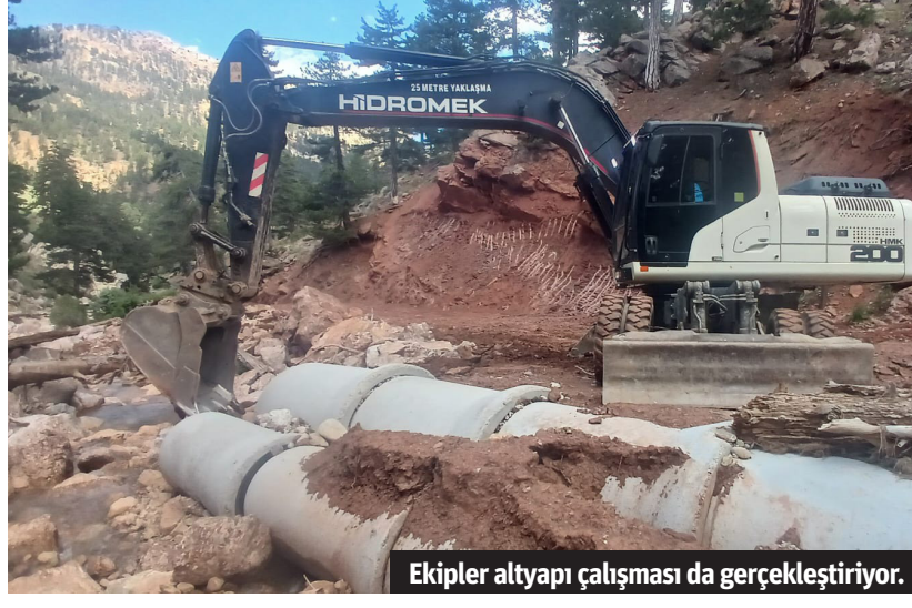
Ekipler altyapı çalışması da gerçekleştiriyor.

ren yolların yenilenmesi yapılıyor. Yağış, heyelan ve göçük gibi doğal sebeplerle bozulan yollar, kepçe ile iş makineleri yardımıyla temizlenerek, yeniden düzenleniyor. Ekiplerin ayrıca, dar olan yollarda genişletme ve altyapı çalışması da gerçekleştirildiği belirtilirken, çalışmaların aralıksız sürdüreceği ifade edildi. – Alanya Belediyesi / Bülten