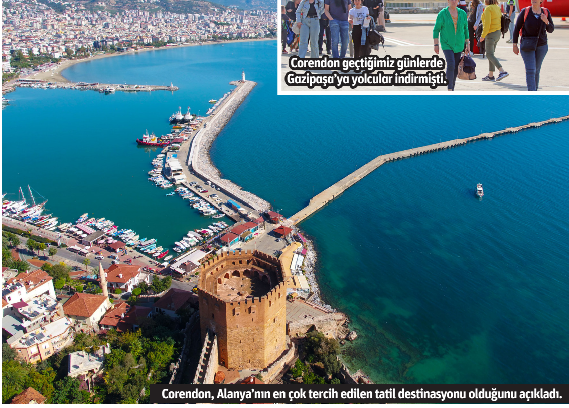
Corendon, Alanya'nın en çok tercih edilen tatil destinasyonu olduğunu açıkladı.

diye konuştu. İŞTE CORENDON TARAFINDAN YAPILAN AÇIKLAMA VE REISBIZZ'DE YER ALAN HABER Corendon: Mayıs ayı tatil rezervasyonlarının sayısı geçen yıla göre yüzde 20 arttı Corendon, Mayıs tatilleri için tatil rezervasyonlarında güçlü bir artış görüyor. Tur operatörüne göre rezervasyon sayısı geçen yıla göre yüzde 20 arttı. Corendon'a göre Alanya, yaklaşan okul tatilleri için en popüler destinasyon. Tur operatörüne göre Türk sahil beldesi, "Turizmde katlanarak büyüyen bir büyüme yaşıyor ve rezervasyon sayısı geçen yıla göre iki kattan fazla artıyor." Corendon'un Türkiye'den sonra ilk beşi ise Yunanistan, İspanya, Curaçao ve Mısır'dan oluşuyor. Corendon'a göre Alanya'nın popüleritesi çeşitli faktörlerden kaynaklanıyor. "Öncelikle destinasyon şehir ve plajın benzersiz bir kombinasyonunu sunuyor. Ayrıca Alanya'daki otellerin fiyat düzeyi de diğer Türkiye destinasyonlarına göre özellikle caziptir. Ortalama olarak benzer konaklama fiyatları Antalya'ya göre yaklaşık yüzde 15-20 daha düşük."