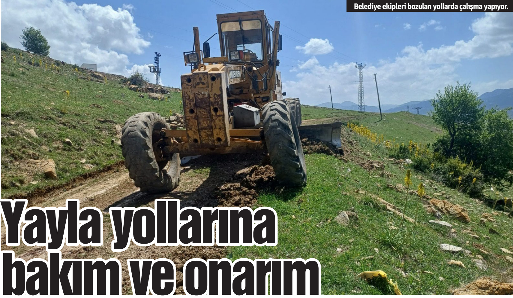
Belediye ekipleri bozulan yollarda çalışma yapıyor.