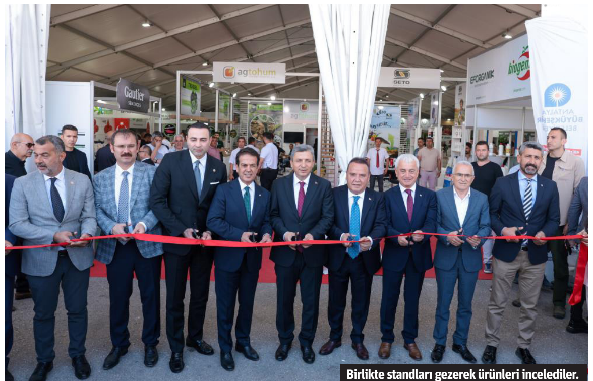
Birlikte standları gezerek ürünleri incelediler.

destek olmaya çalışsak da sektörümüzün merkezi hükümetten gelecek desteklere ihtiyacı var. Üreticilerimizin gece gündüz demeden, büyük özveri ve emekle yetiştirdiği ürünler karşılığını bulamıyor. Tarlada, dalında ya da fabrikada kasaların içinde kalıyor" diye konuştu. - İHA