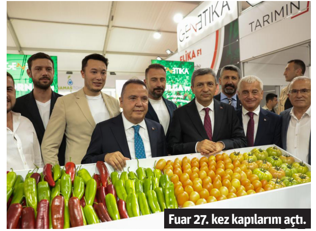
Fuar 27. kez kapılarını açtı.