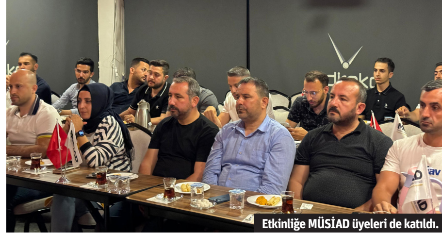
Etkinliğe MÜSİAD üyeleri de katıldı.

■ MÜSTAKİL Sanayici ve İşadamları Derneği (MÜSİAD) Alanya Şubesi'nin 'Alaiye Sohbetleri' adı altında düzenleyip geleneksel hale getirdiği tecrübe paylaşımı ve yeni fikirlerin oluşumuna yönelik etkinlik sürüyor. Büyük ilgi gören 'Alaiye Sohbetleri'nin bu haftaki konugu Gürses