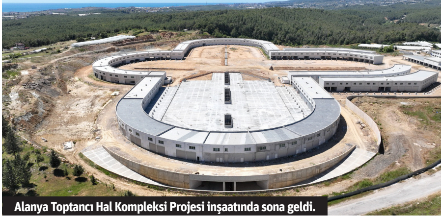
Alanya Toptancı Hali Kompleksi Projesi inşaatında sona geldi.

ANTALYA Büyükşehir Belediyesi Alanya Toptancı Hali Kompleksi inşaatı adım adım sona yaklaşıyor. Revize edilen projeye ek ihale ile yeni sundurma ve bodrumda bulunan ardiyelerin önüne yanaşma rampaları yapılıyor. Ek ihaleler ile modern tesise yapılan yatırım 750 Milyon TL'yi aşacak. Antalya Büyükşehir Belediyesi'nin Alanya'nın Türker Mahallesi'nde yapımı devam eden Alanya Toptancı Hali Kompleksi Projesi inşaatında sona geldi. Modern imkânlar ile donatılan toptancı halinin daha kullanışlı ve rahat olması için projede revizeler yapıldı. Projeye esnaflardan gelen görüş ve öneriler doğrultusunda ek