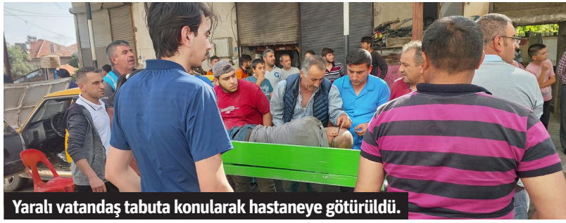
Yaralı vatandaş tabuta konularak hastaneye götürüldü.

yaralı ambulansın bir süre gelmemesinden sonra vatandaşlar tarafından tabuta konularak kamyonete yüklenip ilçedeki hastaneye kaldırıldı. Öte yandan, yaralının tabuta konulup kamyonete yüklendiği anlar ise çevredeki vatandaşlar tarafından kaydedildi. - Mehmet AL