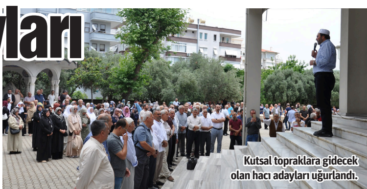
Kutsal topraklara gidecek olan hacı adayları uğurlandı.