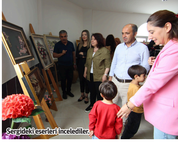
Sergideki eserleri incelediler.

ALANYA Belediyesi'nin kadınların istihdamına yönelik kent 13 farklı noktasında açtığı el sanatları kurslarının geleneksel yıl sonu sergileri devam ediyor. 2023-2024 Eğitim-Öğretim Yılı'nda, Kestel Mahallesi'nde açılan el sanatları kursunun yıl sonu sergisi, düzenlenen törenle Kestel Merkez Çarşı Cami altındaki salonda vatandaşların beğenisine sunuldu. Açılış