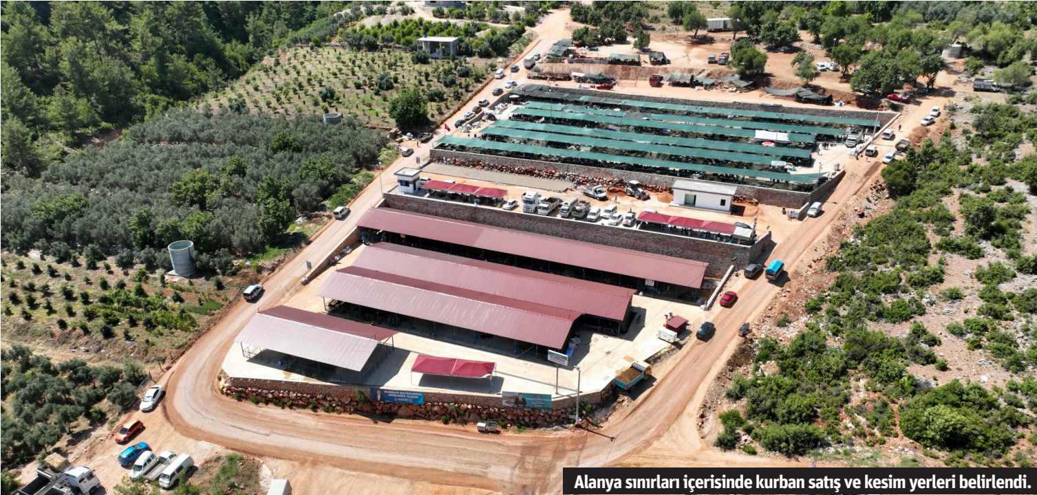
Alanya sınırları içerisinde kurban satış ve kesim yerleri belirlendi.

ALANYA Belediyesi, Kurban Bayramı'nda kurbanlıkların hijyenik koşullarda satış ve kesim işlemlerinin yapılabilmesi için gerekli tedbirleri alarak, kent sınırları içerisinde kurban satış, kesim yerleri ile yer ücretlerini ve satış fiyatlarını belirledi. Kurban Bayramı'nın yaklaşması nedeniyle Alanya'da satılacak büyükbaş ve küçükbaş hayvanların satış yerleri ile yer ücretleri ve canlı ağırlık satış fiyatlarının belirlenmesi için Belediye Encümeni'ne de bildirim yapıldığı kaydedildi. Buna göre, Mahmutlar, Konaklı, Demirtaş ve merkez kurban satış yerleri tespit edilirken, yerlerin hazırlanmasına başlanıldığı ifade edildi. 3