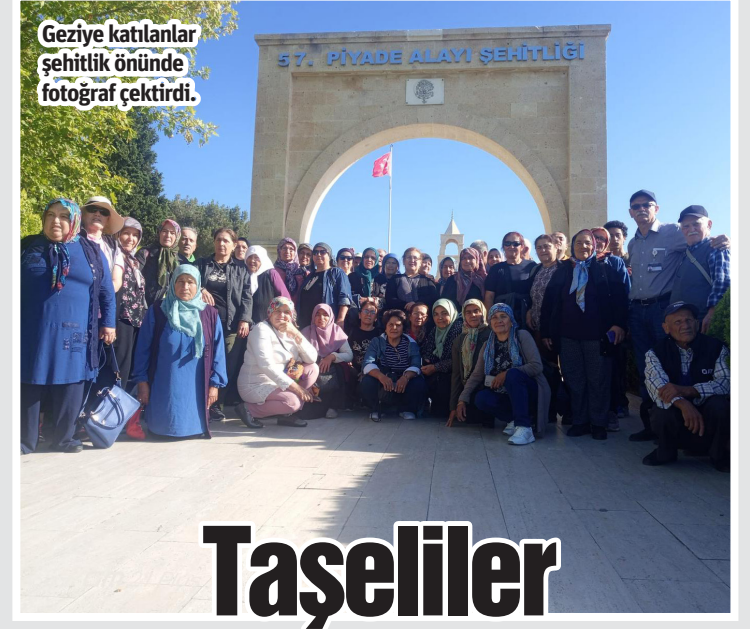
Geziye katılanlar şehitlik önünde fotoğraf çektiler.