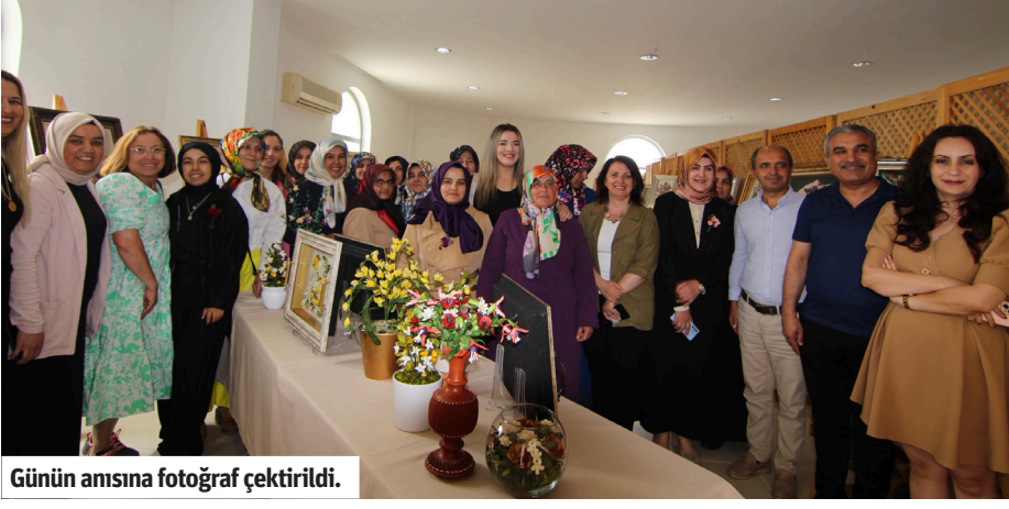
Günün anısına fotoğraf çekildi.

Alanya Belediyesi, İlçe Milli Eğitim Müdürlüğü ve Halk Eğitimi Merkezi iş birliğiyle 4 farklı branşta yapılan el sanatları kursunun yıl sonu sergisi açıldı.