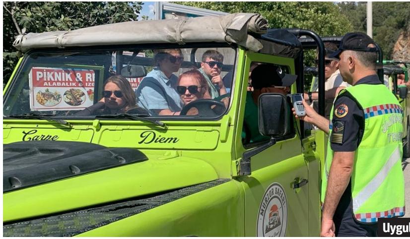
Uygulamalarda bin 13 araç kontrol edildi.