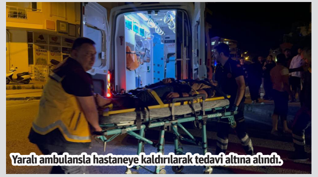
Yaralı ambulansla hastaneye kaldırılarak tedavi altına alındı.