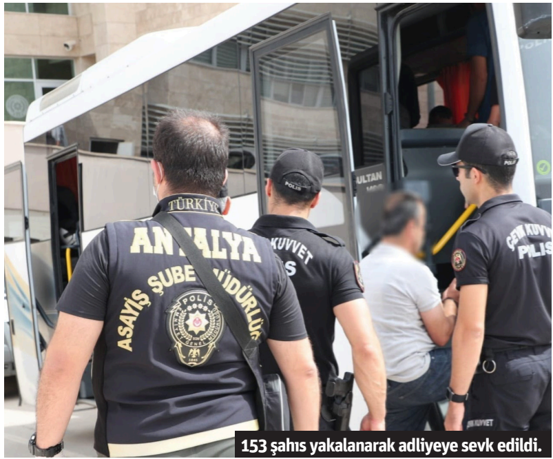
153 şahıs yakalanarak adliyeye sevk edildi.

■ ANTALYA İl Emniyet Müdürlüğü tarafından asayiş ve diğer suçlardan aranan şahısların yakalanmasına yönelik yapılan eş zamanlı operasyonda çeşitli suçlardan aranan 153 şahıs yakalanarak adliyeye sevk edildi. Emniyet Müdürlüğü birimlerince adli makamlarca haklarında yakalama emri bulunan 'Asayiş ve Diğer Suçlardan Aranan Şahısların yakalanmasına yönelik yapılan eş zamanlı operasyonda aralarında 'Adam Öldürme', 'Kasten Yaralama', 'Hırsızlık', 'Dolandırıcılık', 'Çocuğun Cinsel İstismarı', 'Cinsel Saldırı', 'Yağma', 'İş Yeri/Konut Do-