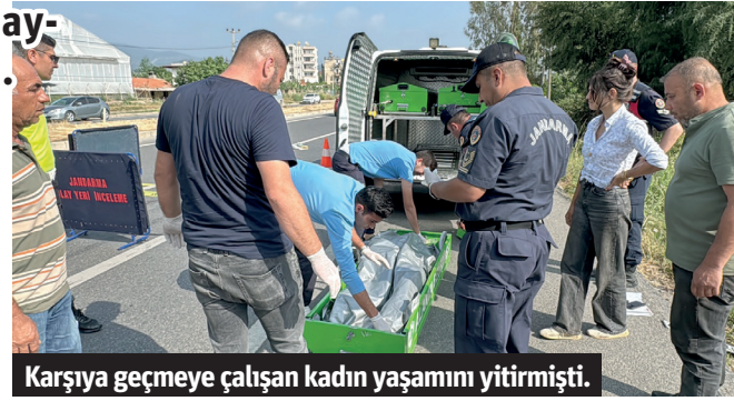
Karşıya geçmeye çalışan kadın yaşamını yitirmişti.

Olayın ardından gözaltına alınan otomobil sürücüsü Sabri B. sabah saatlerinde karakoldaki işlemlerinin ardından adliyeye sevk edildi. Sürücü, nöbetçi sulh ceza hakimliğince tutuklanarak cezaevine gönderildi. - Mehmet AL