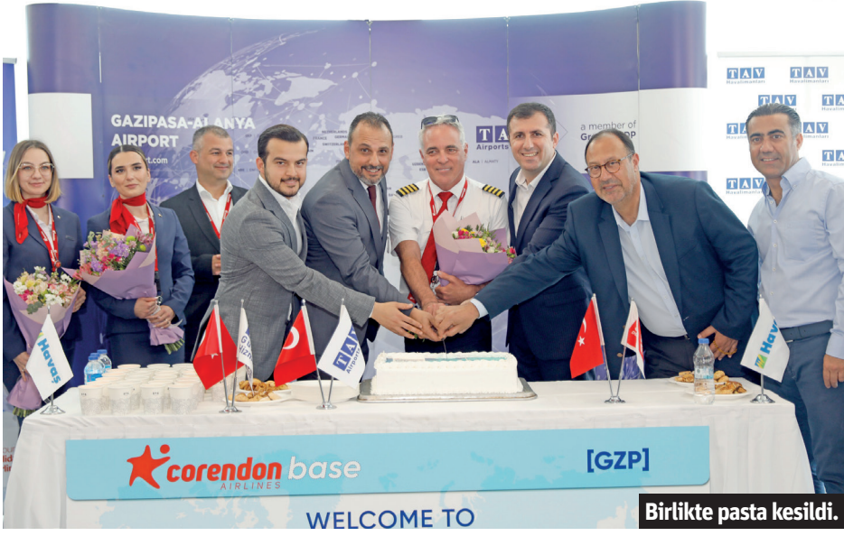
Birlikte pasta kesildi.