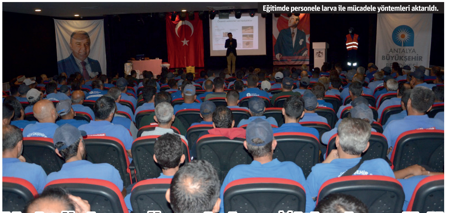
Eğitimde personele larva ile mücadele yöntemleri aktarıldı.

tütün aylık bazda yüzde 9,56 ile fiyatı en fazla artan grup oldu. Alkollü içecekler ve tütünü yüzde 4,69 ile haberleşme, yüzde 4,58 ile giyim ve ayakkabı, yüzde 4,11 ile ev eşyası ve yüzde 3,52 ile çeşitli mal ve hizmetler takip etti. BİR AY ÖNCEYE GÖRE YÜZDE 4 ARTTI Lokanta ve otellerde fiyatlar bir önceki aya göre yüzde 4,69, bir önceki yılın aralık ayına göre yüzde 28,70, bir önceki yılın aynı ayına göre yüzde 95,82 ve on iki aylık ortalamalara göre yüzde 89,22 oranında artış gösterdi. (Kaynak TurizmGüncel.com)