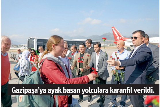
Gazipaşa'ya ayak basan yolculara karanfil verildi.

Corendon Havayolları, Hollanda'nın ardından Gazipaşa Havalimanı'na Brüksel'den de ilk uçuşunu gerçekleştirdi. Yolcular terminalde çiçeklerle karşılandı.