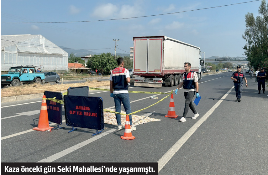
Kaza önceki gün Seki Mahallesi'nde yaşanmıştı.