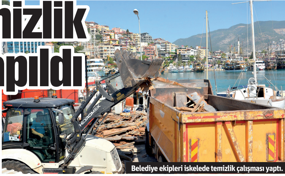
Belediye ekipleri iskelede temizlik çalışması yaptı.

çalışmasıyla İskele, temiz ve düzenli bir görünüme kavuşturuldu. İskelede gezintiye çıkan vatandaşlar ve burada faaliyet gösteren işletmeciler, Alanya Belediye Başkanı Osman Tarık Özçelik'e teşekkür ederek, kötü görüntü ve kokuya neden olan bölgede yapılan temizlik çalışmasından memnun olduklarını dile getirdiler. - Alanya Belediyesi / Bülten