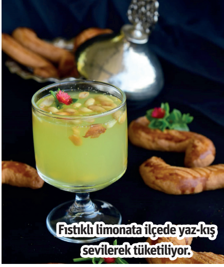
Fıstıklı limonata ilçede yaz-kış severek tüketiliyor.

ALANYA'NIN yaz-kış ayırt edilemsizinin severek tüketilen içeceği 'Fıstıklı Limonata' Alanya Belediyesi tarafından yapılan girişimler sonucunda Türk Patent ve Marka Kurumu tarafından tescillendi. Fıstıklı limonata, 24 Mayıs 2023 tarihinde yapılan başvuruda, 6769 sayılı Sınai Mülkiyet Kanunu'nun 41'inci maddesi kapsamında korunmak üzere 17 Nisan 2024 tarihi itibarıyla Mahreç İşareti ile koruma altına alındı.