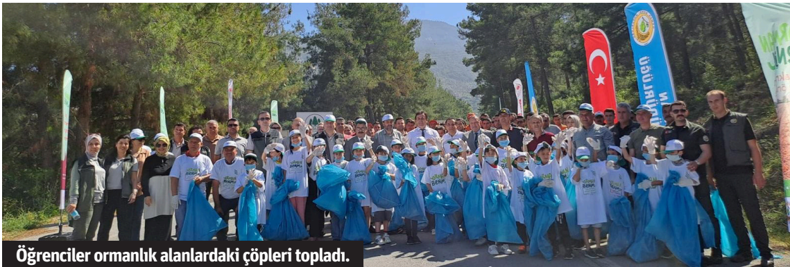
Öğrenciler ormanlık alanlardaki çöpleri topladı.

TARIM ve Orman Bakanlığı tarafından ormanları korumak ve yangınlara karşı alınacak önlemler konusunda farkındalık oluşturmak adına ülke genelinde eş zamanlı olarak 'Orman Benim' kampanyası başlatıldı. Alanya Orman İşletme Müdürlüğü koordinesinde Alanya'da düzenlenen etkinliği Alanya İlçe Jandarma Komutanı Binbaşı Hüseyin Direk,