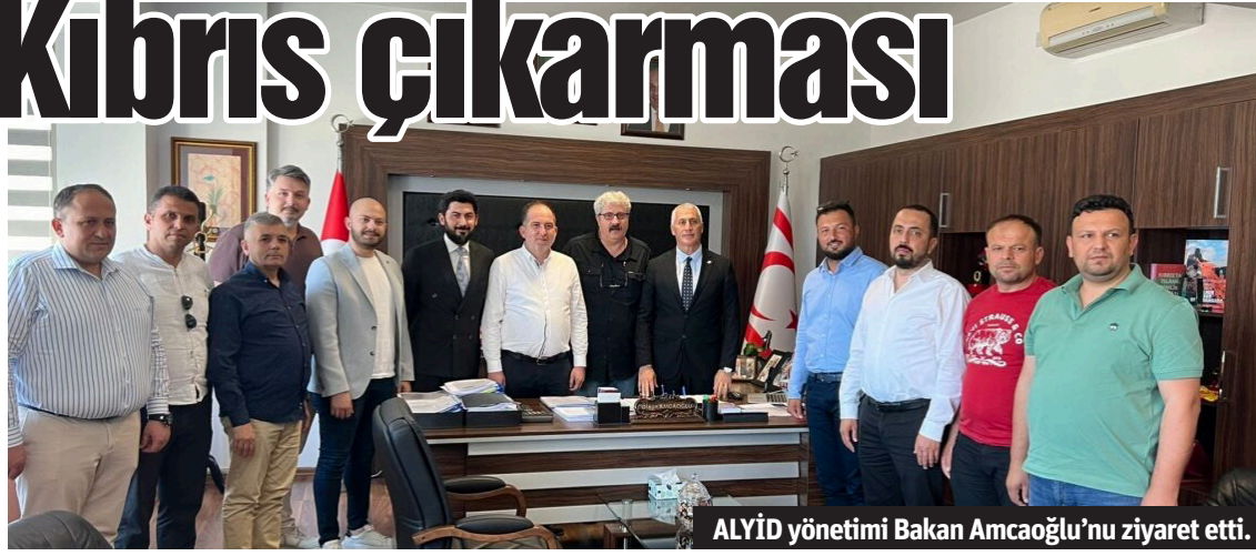
ALYİD yönetimi Bakan Amcaoğlu'nu ziyaret etti.

ALANYA Yenilikçi İş İnsanları Derneği (ALYİD) yönetimi, Kıbrıs Ekonomi ve Enerji Bakanı Olgun Amcaoğlu'nu makamında ziyaret etti. ALYİD Yönetim Kurulu Başkanı Avni Erdoğan ve Yönetim Kurulu üyeleri, Kıbrıs Ekonomi ve Enerji Bakanı Olgun Amcaoğlu'nu ziyaret ederek enerji yatırımları konusunda görüş alışverişinde bulundular. Geçtiğimiz aylarda, ünlü Ekonomist Özgür Demirtaş'ı Alanya halkı buluşturarak büyük bir projeye imza atan ALYİD üyeleri, sektörel gelişmeleri yakından takip etmek ve bir dizi ziyaret gerçekleştirmek için Kıbrıs'a gitti. Dernek üyeleri ilk olarak Kıbrıs Ekonomi ve Enerji Bakanı Olgun Amcaoğlu'nu ziyaret etti. Ziyaretten duyduğu memnuniyeti dile getiren Bakan Amcaoğlu, "Anavatanımızı ağırlamaktan böyle kıymetli iş insanlarımızı ağırlamaktan mutluluk duyduk. Turizmin başkentlerin birisi olan Alanya'nın bizde yeri çok önemli. Değerli