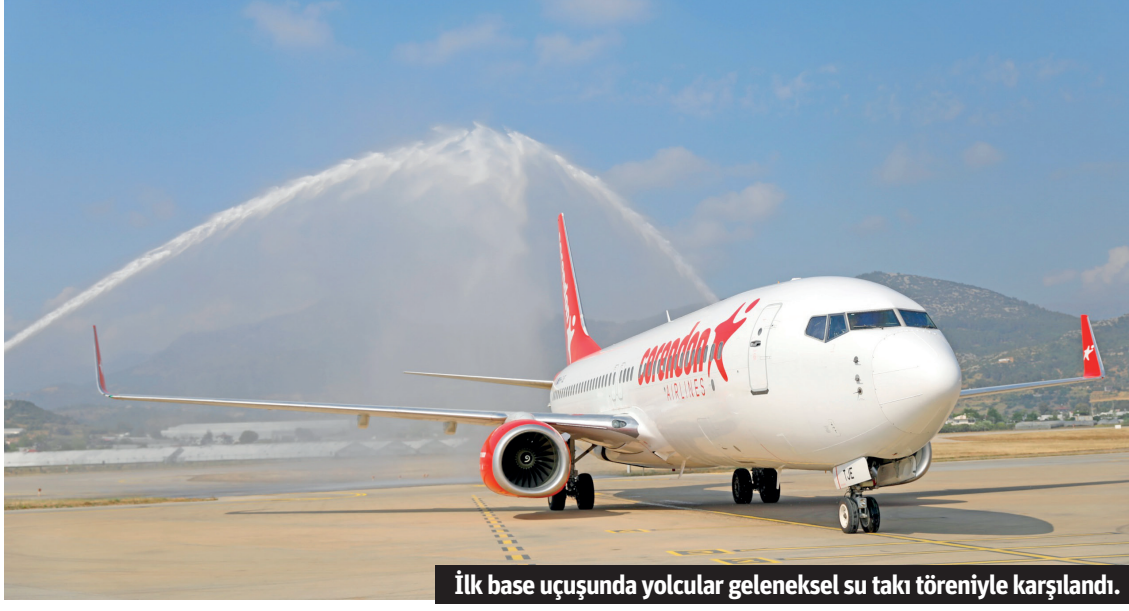
İlk base uçuşunda yolcular geleneksel su takı töreniyle karşılandı.