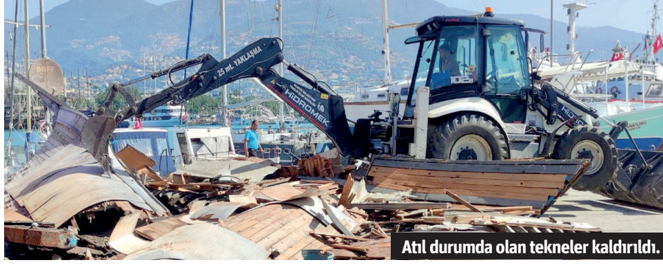
Atıl durumda olan tekneler kaldırıldı.