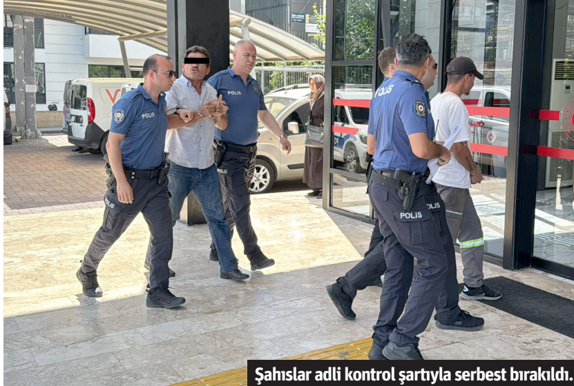
Şahıslar adli kontrol şartıyla serbest bırakıldı.