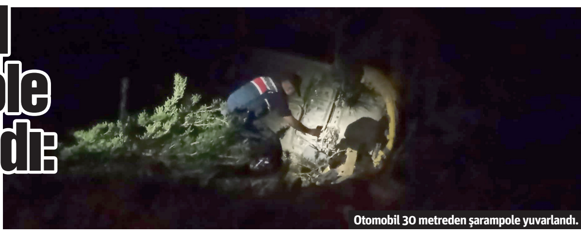
Otomobil 30 metreden şarampole yuvarlandı.