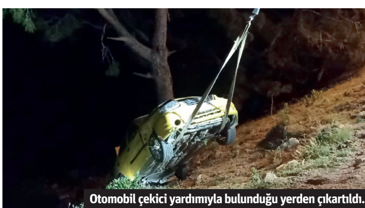
Otomobil çekici yardımıyla bulunduğu yerden çıkartıldı.

devrildi. Çevredeki vatandaşların ihbarı üzerine bölgeye itfaiye ve sağlık ekipleri sevk edildi. İtfaiye ekipleri tarafından çıkarılan otomobildeki yaralı sürüsü Y.D. ambulansla Alanya Eğitim ve Araştırma Hastanesi'ne kaldırıldı. Şarampole uçan otomobil çekici yardımıyla bulunduğu yerden çıkartılarak götürüldü. - Erkan Uysal