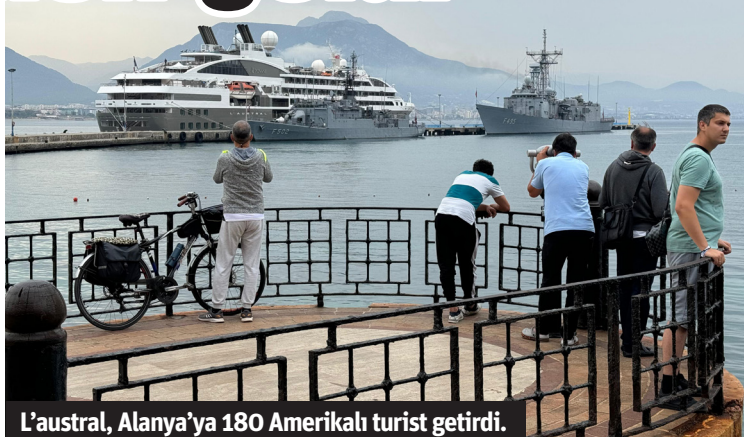
L'austral, Alanya'ya 180 Amerikalı turist getirdi.

ALANYA'DA kruvaziyer turizmi sürüyor. Kuşadası'ndan yola çıkarak sabah saatlerinde Alanya Limanı'na demirleyen Fransa bayraklı L'austral isimli sezonun üçüncü kruvaziyer gemisi ilçeye çoğunluğu Amerikalı 180 turist getirdi. 142 metre uzunluğunda olan ve 142 mürettebatı bulunan gemiden inen turistlerin bazıları tur otobüslerini tercih ederken bazıları Alanya'nın tarihi ve turistik yerlerini gezdi. L'austral saat 20.00'de Antalya'ya gitmek üzere Alanya Limanı'ndan ayrıldı. - Erkan Uysal