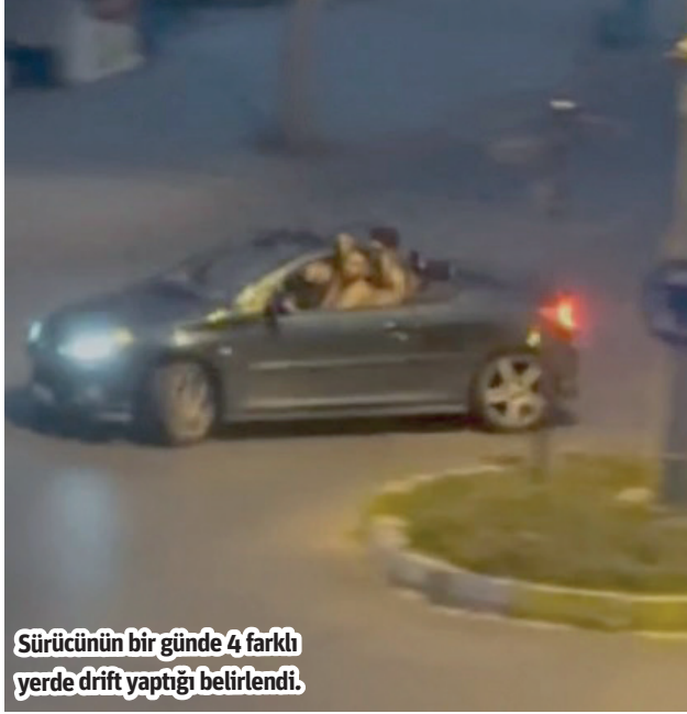
Sürücünün bir günde 4 farklı yerde drift yaptığı belirlendi.