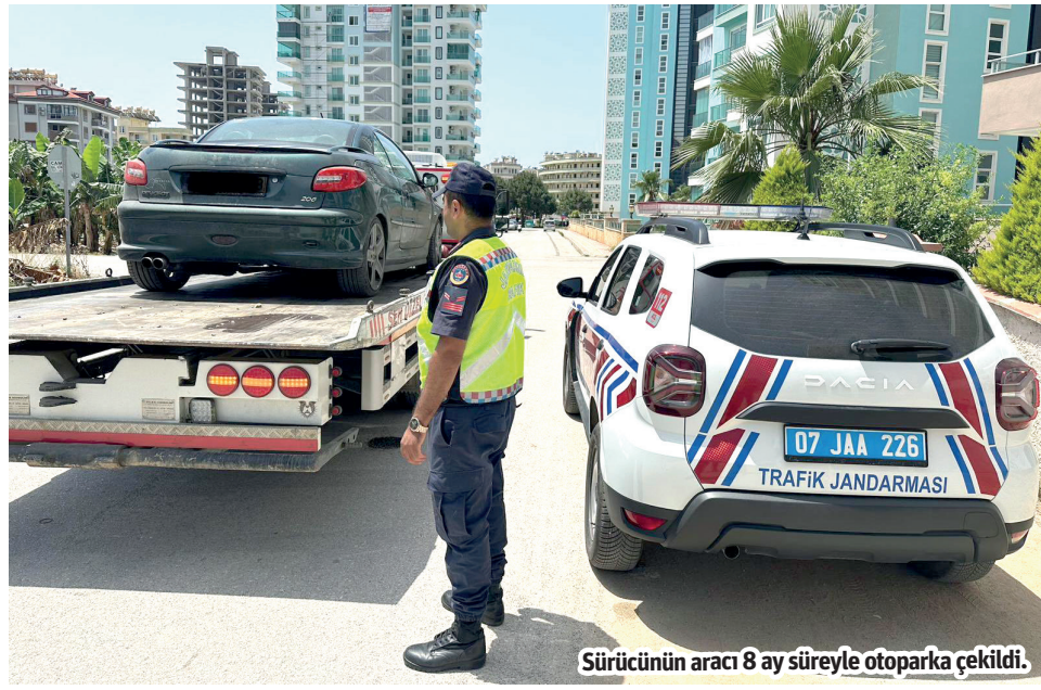
Sürücünün aracı 8 ay süreyle otoparka çekildi.

Alanya'da otomobiliyle aynı gün içerisinde 4 farklı yerde drift yaptığı tespit edilen sürücüye jandarma tarafından 128 bin 932 TL ceza uygulandı.