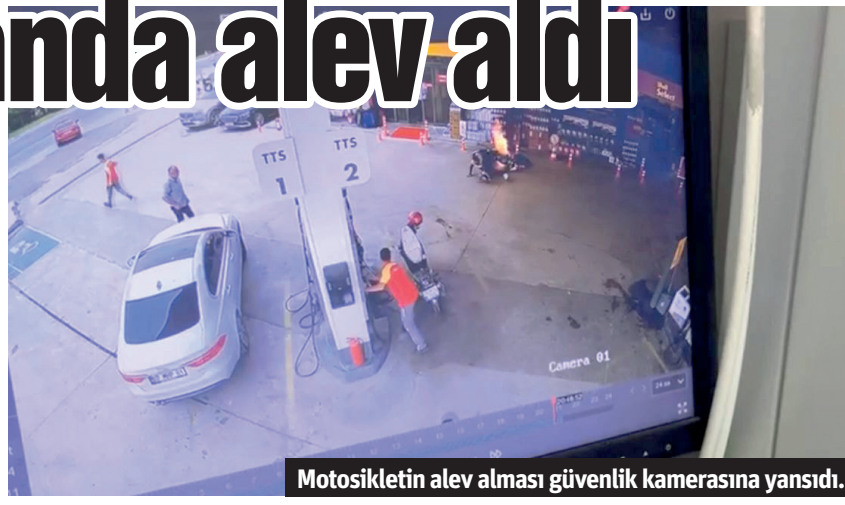
Motosikletin alev alması güvenlik kamerasına yansdı.

sikleti bir anda yanmaya başladı. Motosikletin alev almasıyla birlikte sürücü kendini motosikletten attı. Akaryakıt istasyonu görevlileri motosikletteki alevleri yangın tüpü ile söndürdü. – Mehmet AL