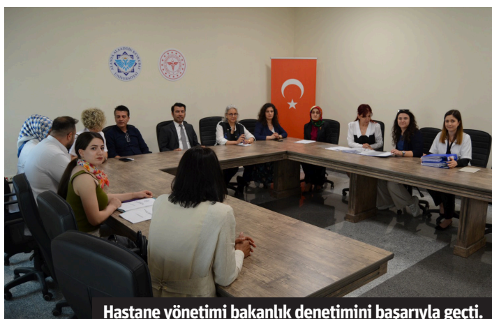
Hastane yönetimi bakanlık denetimini başarıyla geçti.

paylaştık. Alanya'dan 50, Türkiye'den 377 hastamızı aldığımız bu çalışma kapsamında projemiz devam edecektir. MS hastalarımızın kliniğimize başvurması halinde yeni yoga çalışmalarımız hastanemizde devam edecektir" ifadelerine yer verdi. - Alanya Eğitim ve Araştırma Hastanesi