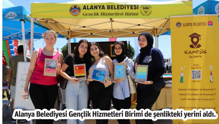
Alanya Belediyesi Gençlik Hizmetleri Birimi de şenlikteki yerini aldı.

resim tasarımı ve quiling (kağıt kıvrıma) yaparak, hünerlerini gösterdiler. Akrilik boyayla da yeteneklerini sergileyen öğrenciler, birbirinden güzel resimlerle bu güzel şenliği ölümsüzleştirirken, oldukça eğlenceli vakit geçirdiler. Alanya Belediyesi Gençlik Hizmetleri Birimi, Filografi, Ebru ve Çömlek Yapımı gibi sanatsal aktivitelerle şenlik boyunca öğrencilerle buluşmaya devam edecek. – Alanya Belediyesi / Bülten