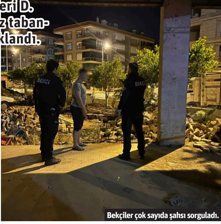
Bekçiler çok sayıda şahsı sorguladı.