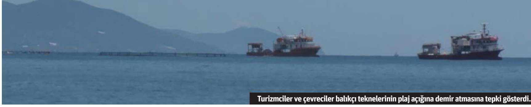
Turizmciler ve çevreciler balıkçı teknelerinin plaj açığına demir atmasına tepki gösterdi.

Alanya sahillerinin 50 ila 100 metre açığına Karadeniz ve Marmara Bölgesi'nden gelen balıkçıların orkinos çiftliği kurması, bölgedeki turizmciler ve hayvanseverleri ayağı kaldırdı.