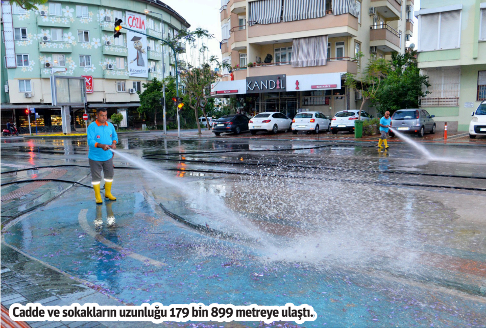
Cadde ve sokakların uzunluğu 179 bin 899 metreye ulaştı.