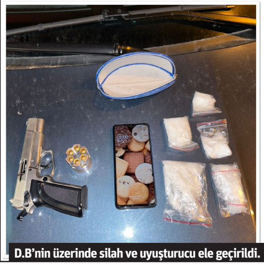
D.B'nin üzerinde silah ve uyuşturucu ele geçirildi.

ALANYA İlçe Emniyet Müdürlüğü'ne bağlı çarşı ve mahalle bekçileri tarafından, araç içinde bulunan ve durumundan şüphelenilen D.B. isimli şahsın yapılan üst aramasında uyuşturucu ve uyarıcı maddeler ile 1 adet ruhsatsız tabanca, şarjör ve fişekleri ele geçirildi. D.B. isimli şüpheli şahıs çıkarıldığı adli makamlarca tutuklandı. - Mehmet AL