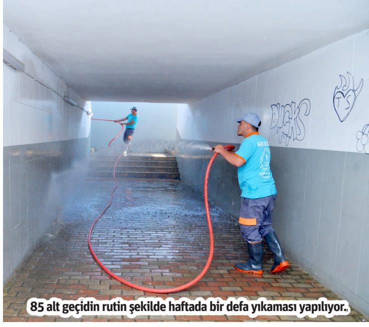
85 alt geçidin rutin şekilde haftada bir defa yıkaması yapılıyor.

Alanya Belediyesi Temizlik İşleri Müdürlüğü ekipleri yol, kaldırım, altgeçit ve pazar yerlerini temizlerken, çöp konteynerlerini de yıkayıp dezenfekte etti. 1 Nisan'dan itibaren yıkanan cadde ve sokakların uzunluğu 179 bin 899 metreye ulaştı.