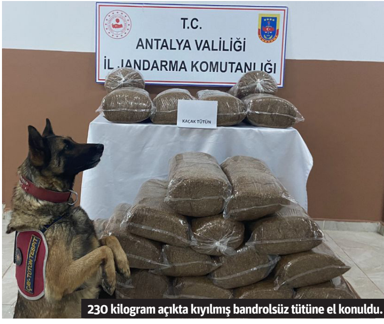
230 kilogram açıkta kıyılmış bandrolsüz tütüne el konuldu.

yapılan çalışmalar neticesinde M.Ü. ve O. Y. isimli şahıslara ait araçlarda yapılan kontrolde 230 kilogram açıkta kıyılmış bandrolsüz tütün ele geçirilmiştir. Olayla ilgili adli işlem başlatıldı. - Mehmet AL