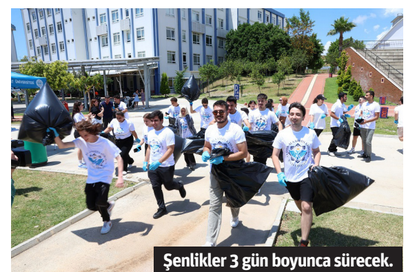
Şenlikler 3 gün boyunca sürecek.

ikramlar sunuldu. Etkinlikler ödüllü yarışmalarla devam etti. Öğrenciler, en uzun süre rodeo üzerinde kalmak için kıyasıya mücadele ettiler. Bunun yanında halat çekme, dart, çöp toplama oyunlarında da birincilere çeşitli ödülleri verildi. İlk gün etkinlikleri, konser ve gösterilerle devam etti. ALKÜ Müzik Topluluğu tarafından birbirinden güzel şarkılar seslendirilirken son olarak Gelenek-