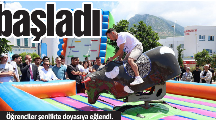
Öğrenciler şenlikte doyusya eğlendi.