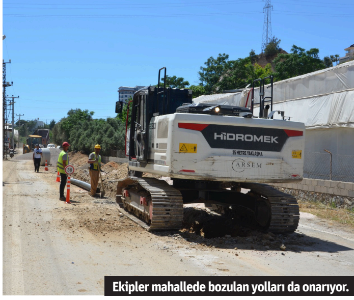
Ekipler mahallemde bozulan yolları da onarıyor.

Antalya Büyükşehir Belediyesi ASAT Genel Müdürlüğü tarafından yürütülen Alanya Demirtaş Mahallesi kanalizasyon şebekesi yapım işi projesi tüm hızıyla sürüyor. Geçtiğimiz yıl başlatılan çalışma kapsamında Demirtaş Mahallesi'nde 39 kilometre kanalizasyon şebekesi ve kolektör hattı yapılacak. Mahallenin merkezi ve diğer bağlantı yollarında bugüne kadar 28 kilometrelik hat döşeme çalışması gerçekleştirildi.