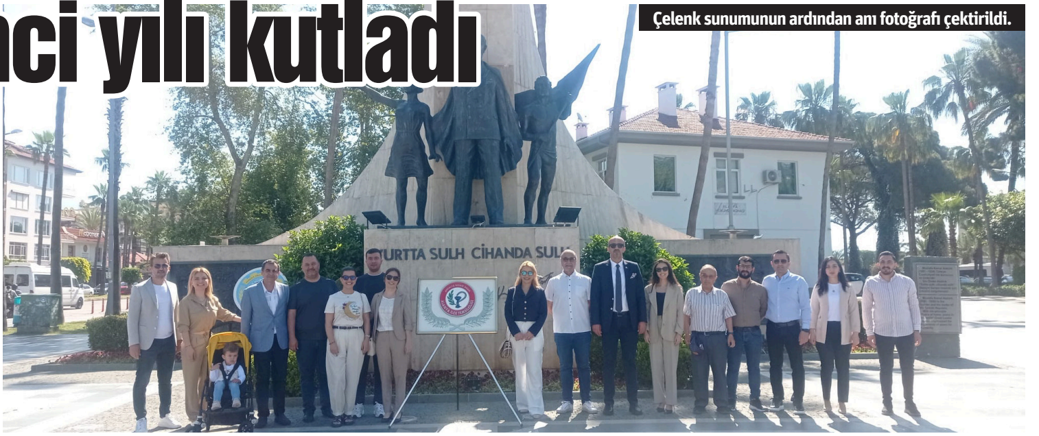
Çelenk sunumunun ardından anı fotoğrafı çekildi.

lık saygı duruşunda bulunuldu. Ardından konuşma yapan Babalık, "Bilimsel eczacılığın 185'inci yılını kutladığımız bu günde başta değerli meslektaşlarımız olmak üzere mesleğini özveri ile yapan, birinci derecede sağlık kuruluşu olan eczane işletmecisi olan bütün arkadaşlarımızın Eczacılık Günü'nü kutluyorum" dedi. Babalık'ın konuşmasının ardından anıt önünde anı fotoğrafı çekildi. – Erkan Uysal