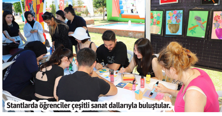
Stantlarda öğrenciler çeşitli sanat dallarıyla buluştular.