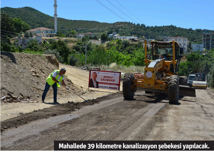
Mahallemde 39 kilometre kanalizasyon şebekesi yapılacak.