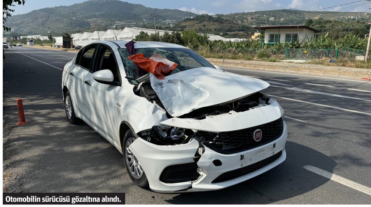
Otomobilin sürücüsü gözaltına alındı.

Alanya'da yolun karşısına geçmeye çalışan 55 yaşındaki kadın, otomobilin çarpması sonucu yaşamını yitirdi.