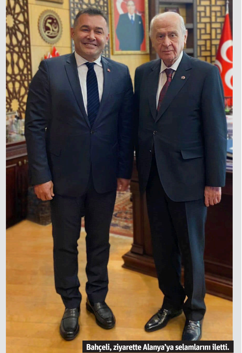
Bahçeli, ziyarette Alanya'ya selamlarını iletmiş.

ALANYA Belediyesi'nde 10 yıl belediye başkanlığı görevinde bulunan Adem Murat Yücel, MHP lideri Bahçeli'yi ziyaret etti. MHP Genel Başkanı Devlet Bahçeli'yi makamında ziyaret eden Alanya eski Belediye