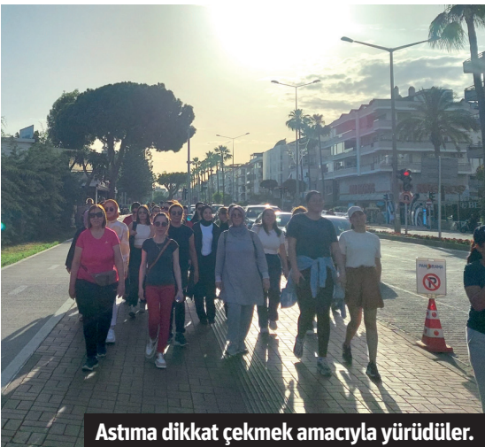
Astıma dikkat çekmek amacıyla yürüdüler.

ALKÜ Sağlık Bilimleri Fakültesi'nde astım hastalığı için doğru nefes alma-ya yönelik bir etkinlik gerçekleştirdi.