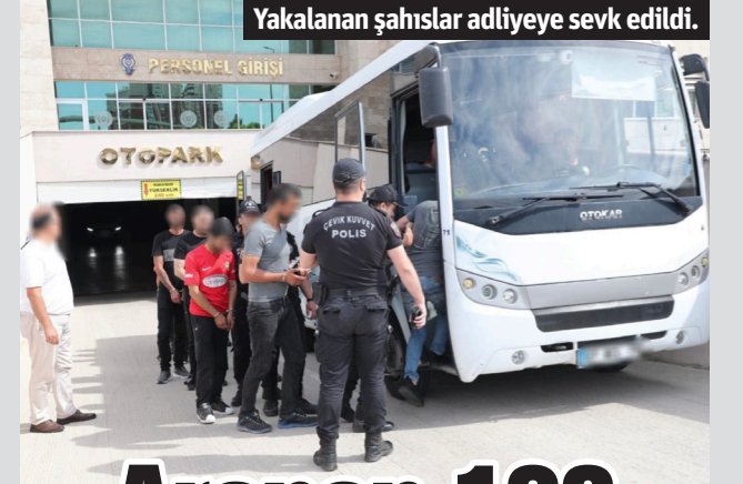
Yakalanan şahıslar adliyeye sevk edildi.