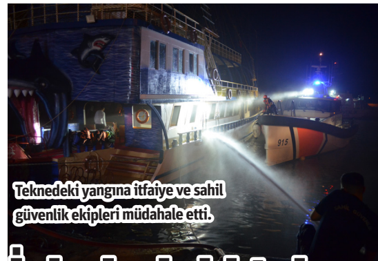
Teknedeki yangına itfaiye ve sahil güvenlik ekipleri müdahale etti.

KAZA, Tosmur Mahallesi'nde meydana geldi. Henüz sürücüsü öğrenilemeyen 07 BRH 698 plakalı otomobil, duvara çarparak takla attı. Kazayı gören çevredeki vatandaşlar durumu 112 Acil Çağrı Merkezi'ne bildirdi. İhbar üzerine kaza yerine ambulans, polis ve itfaiye sevk edildi. İtfaiye ekipleri, araç sürücüsü ile beraberindeki biri çocuk, 2 kişiyi araçtan çıkardı. Yaralıları, 112 Acil Sağlık ekiplerince hastaneye kaldırdı. Polis kazayla ilgili inceleme başlattı. - Mehmet AL