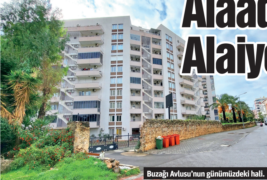
Buzağı Avlusu'nun günümüzdeki hali.