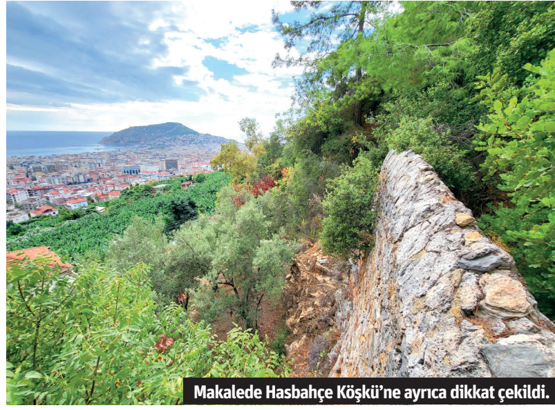
Makalede Hasbahçe Köşkü'ne ayrıca dikkat çekildi.