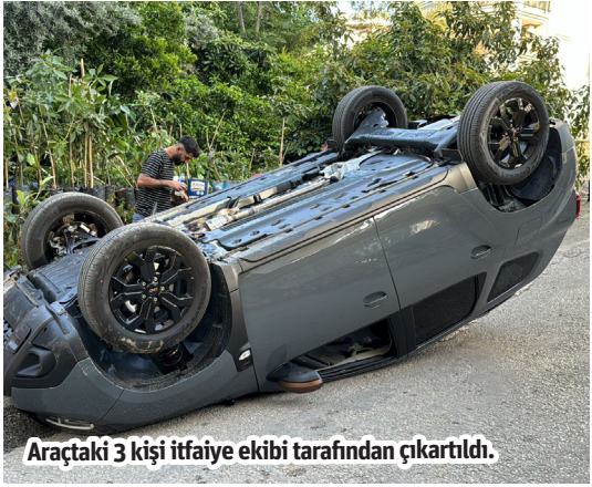
Araçtaki 3 kişi itfaiye ekibi tarafından çıkartıldı.

Alanya'da duvara çarparak takla atan otomobildeki 3 kişi yaralandı.