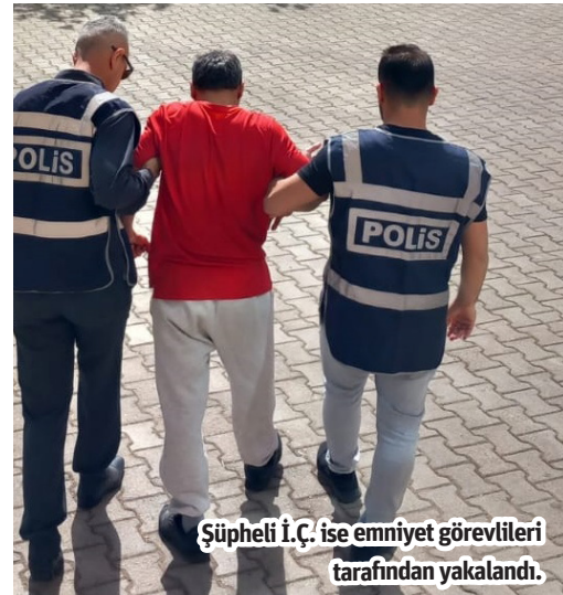
Şüpheli İ.Ç. ise emniyet görevlileri tarafından yakalandı.

6 adet su dinamosu çalarak hurdacıya satan hırsızlık şüphelisi, polis tarafından yakalandı. Şüpheli adliyeye sevk edilirken, çalıntı dinamolara satın alan hurdacıya da işlem yapıldı.