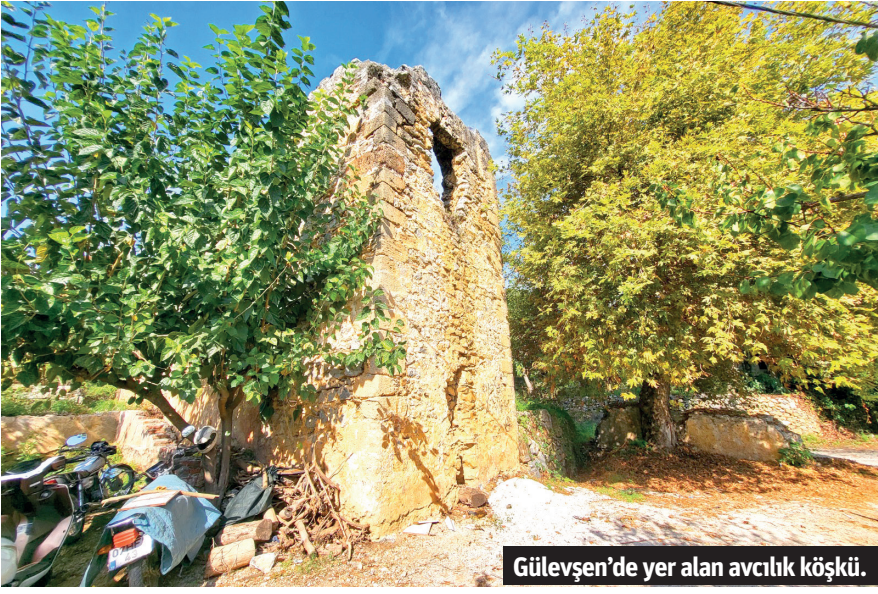
Gülevşen'de yer alan avcılık köşkü.