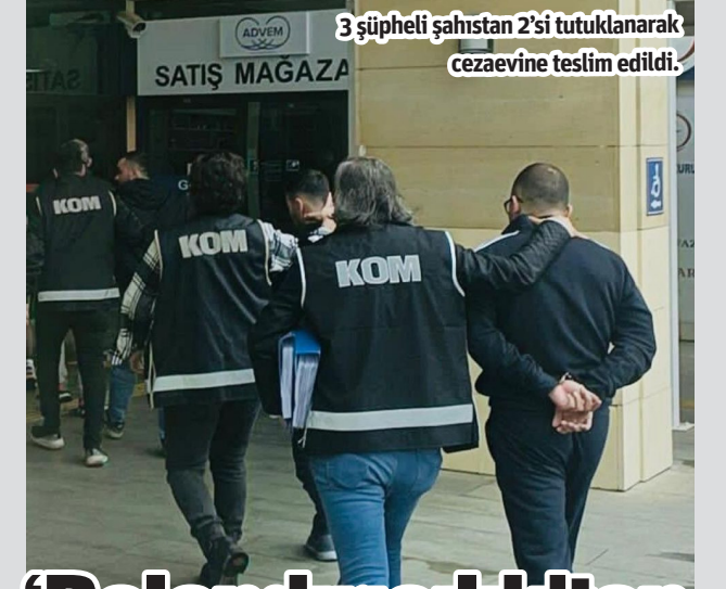
3 şüpheli şahıstan 2'si tutuklanarak cezaevine teslim edildi.