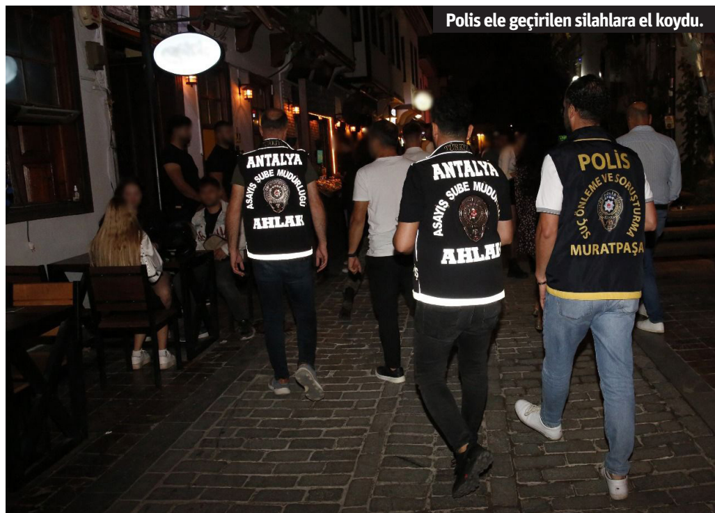
Polis ele geçirilen silahlara el koydu.

A4 Maddesi, 3 adet kesici/delici alet, 1 adet hassas terazi, suçtan elde edildiği değerlendirilen Türk Lirası ve döviz, 6 adet çalıntı motosiklet, 9 adet çalıntı elektrikli bisiklet ele geçirildi. - Mehmet AL