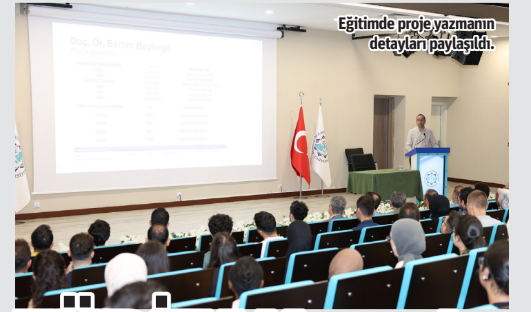
Eğitimde proje yazmanın detayları paylaşıldı.

Alanya Belediyesi olarak İlçe Milli Eğitim Müdürlüğü ve Halk Eğitim Merkezi iş birliğiyle 2023-2024 Eğitim Öğretim Yılı'nda 13 kurs merkezi açarak, el sanatları eğitimine devam ettiklerini belirten Hacıkura, ilk sergiyi Çıplaklı Düğün Salonu'nda açtıklarını söyledi. Hacıkura, Belediye Kültür ve Sosyal İşler Müdürlüğü'ne bağlı sanat atölyelerindeki kurslara bu yıl yine yoğun katılım olduğunu kaydetti. Çıplaklı El Sanatları Merkezi'nde, ipek kotası el ürünleri, dekoratif ev aksesuarları, fantezi yaka çiçeği ile ceket, etek, bluz, pantolon ve elbise başta olmak üzere kadın giysileri dikimi konularında toplam 221 kursiyere eğitim verildiği ifade edildi. – Alanya Belediyesi / Bülten