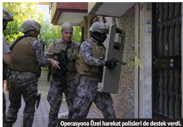
Operasyona Özel hareket polisleri de destek verdi.

Telegram ve sosyal medya uygulamaları üzerinden uyuşturucu madde ticareti yaptığı belirlenen şahıslara yönelik Alanya ve Manavgat merkezli 25 adrese 450 personelle operasyon düzenlendi.