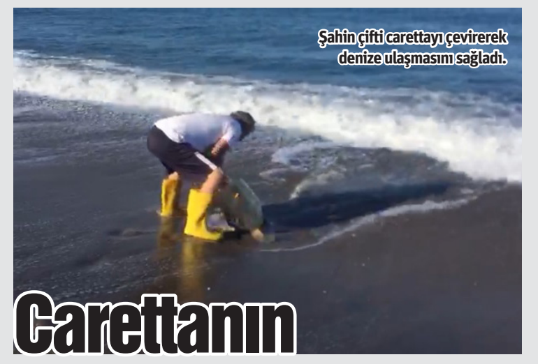
Şahin çifti caretta'yı çevirerek denize ulaşmasını sağladı.