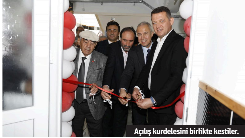
Açılış kurdelesini birlikte kestiler.