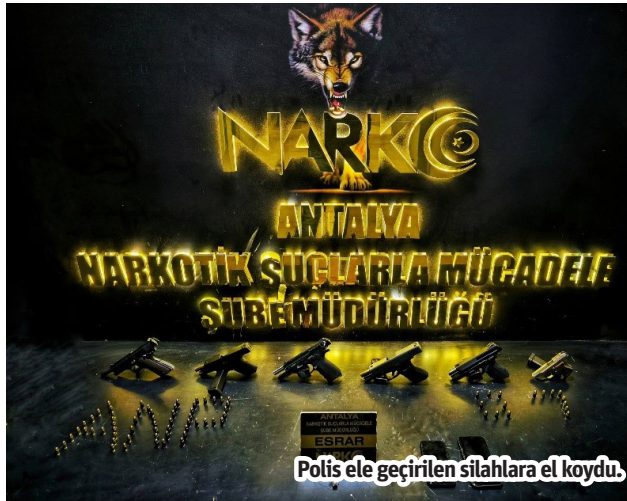
Polis ele geçirilen silahlara el koydu.

ANTALYA Cumhuriyet Başsavcılığı koordinesinde, Emniyet Müdürlüğü birimlerince il genelinde uyuşturucu maddelerin kaynağının kurutulması, ticaretinin ve kullanımının engellenmesi amacıyla il merkezi ile Manavgat ve Alanya'da belirlenen 32 adrese eş zamanlı olarak 80 ekip, bin personel, 10 Özel Harekât unsuru ve 5 narkotik madde arama köpeği ile hava destekli operasyon düzenlendi. Operasyon ve