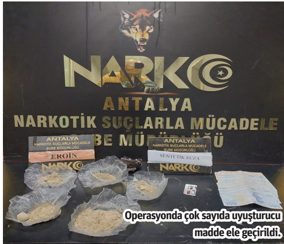
Operasyonda çok sayıda uyuşturucu madde ele geçirildi.

Alanya ve Manavgat'ta belirlenen 32 adrese bin polisin katılımı ile düzenlenen eş zamanlı operasyonda çok sayıda uyuşturucu, 550 bin kullanımlık Sentetik Kannabinoid A4 maddesi ile silahlar ele geçirildi. Operasyonda 75 kişi yakalandı.