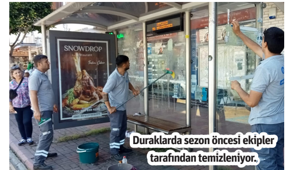
Duraklarda sezon öncesi ekipler tarafından temizleniyor.

ALANYA'DAKİ otobüs durakları turizm sezonu öncesi temizleniyor. Antalya Büyükşehir Belediyesi, şehirdeki ulaşım ağlarının en önemli parçası olan otobüs durakları için Alanya'da 4 kişiden oluşan bir ekip kurdu. Alanya Ulaşım Birimine bağlı olarak çalışan ekip, ilçedeki durakların kurulum, sökülme, bakım onarım ve temizlik çalışmalarını gerçekleştiriyor. Belirlenen program dahilinde çalışmalarını sürdüren ekip, özellikle şehir merkezi başta olmak üzere halkın yoğun olarak kullandığı duraklarda yaz sezonu öncesi temizlik çalışması da gerçekleştiriyor. Bir taraftan duraklara izinsiz asılan afişler kaldırılırken, diğer taraftan duraklar yıkanarak daha temiz hale getiriliyor. - Antalya Büyükşehir Belediyesi / Bülten