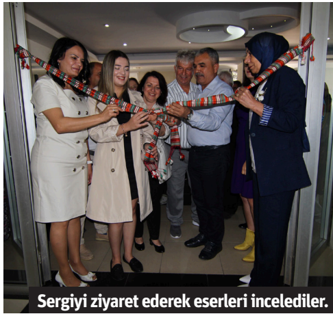
Sergiyi ziyaret ederek eserleri incelediler.