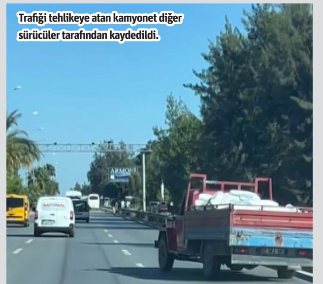
Trafiği tehlikeye atan kamyonet diğer sürücüler tarafından kaydedildi.

ALANYA İlçe Jandarma Komutanlığı tarafından motosiklet sürücülerine yönelik trafik uygulaması yapıldı. Yapılan uygulamada 125 motosiklet kontrol edilirken, 56 motosiklet sürücüsüne cezai işlem uygulandı, 5 motosiklet ise trafikten men edildi. - İHA