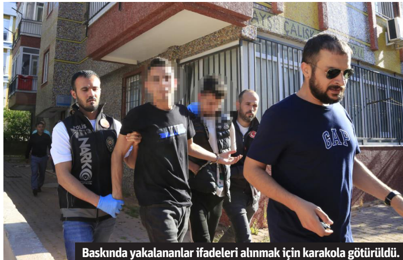
Baskında yakalananlar ifadeleri alınmak için karakola götürüldü.

UYUŞTURUCU ticareti yapan şahıslara yönelik Antalya Emniyet Müdürlüğü ekiplerinin çalışmaları hız kesmeden devam ediyor. Cep telefonu mesajlaşma uygulaması Telegram ve sosyal medya kanalları üzerinden uyuşturucu satışı ve ticareti yapıldığını tespit eden Antalya Emniyet Müdürlüğü Narkotik Suçlarla Mücadele Şube Müdürlüğü ekipleri, sabah saatlerinde belirlenen adreslere şafak baskını düzenledi.