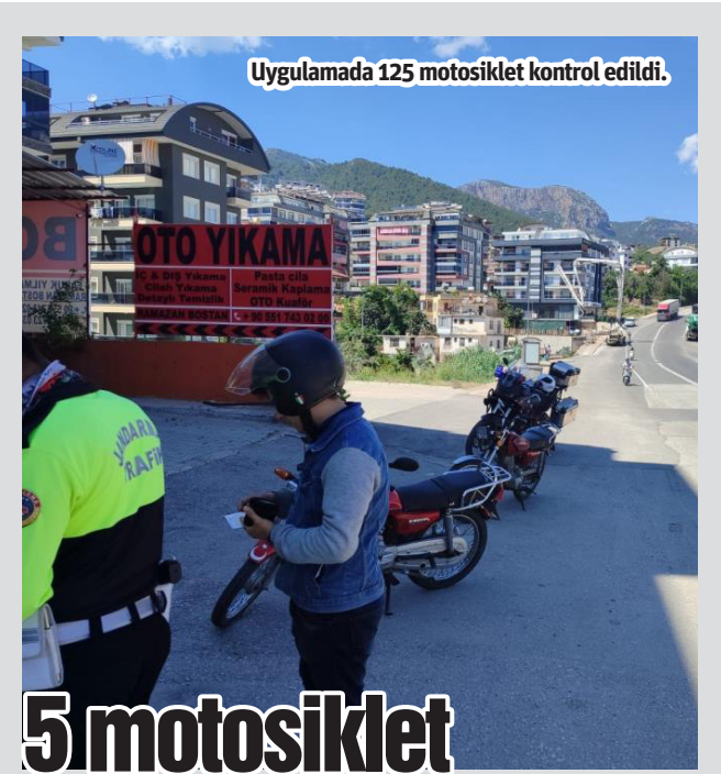
Uygulamada 125 motosiklet kontrol edildi.

ları, fazla yolcu almamaları ve yolcuların emniyet kemerlerini takmaları, orman yangınları açısından arazi içinde kesinlikle sigara içmemeleri ve ateş yakılmaması konusunda gerekli uyarılar yapılarak eğitim ve bilgilendirmelerde bulunuldu. - Mehmet AL