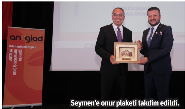
Seymen'e onur plaketi takdim edildi.

sanın canlandırılmasını ve istihdam artışı için uygun ortamın oluşmasını bekliyoruz. Bununla birlikte, kemer sıkma politikaları devam ederse kamu otoritesinin de kendi kemerlerini sıkmasını ve kara deliklerini kapatmasını talep ediyoruz" dedi. "ÜLKEMİZİN GELECEĞİ GENÇLERİN OMUZLARINDA" 19 Mayıs haftasına da geniş yer ayıran Ercan Yavaş, "Atatürk'ümüz gençliği ülkenin en büyük zenginliği olarak görmüş ve biz genç kuşağa büyük güven duymuştur. Biz gençlere bilgiyle donanmış, vatansever, ilerici ve modern bir nesil olma çağrısı yapmıştır. 19 Mayıs, bu çağrının ve Atatürk'ün gençliğe olan inancının tam bir ifadesidir. Gençler olarak bizler, bu günü bir bayram olarak değil, aynı zamanda bir sorumluluk ve görev bilinciyle kabul etmeliyiz. Ülkemizin geleceği biz gençlerin omuzlarımızdadır. Omuzlarımızdaki yüksek