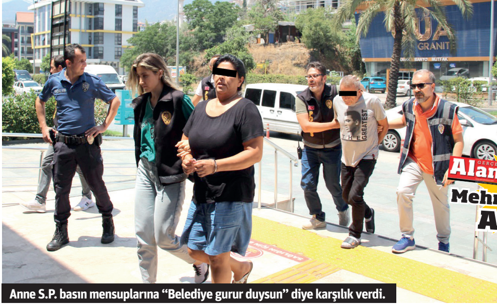
Anne S.P. basın mensuplarına "Belediye gurur duysun" diye karşılık verdi.

Alanya'da 1 kişinin öldüğü, 2 kişinin yaralandığı bıçaklı kavgayla ilgili gözaltına alınan baba ve oğlu tutuklanırken, anne serbest bırakıldı.