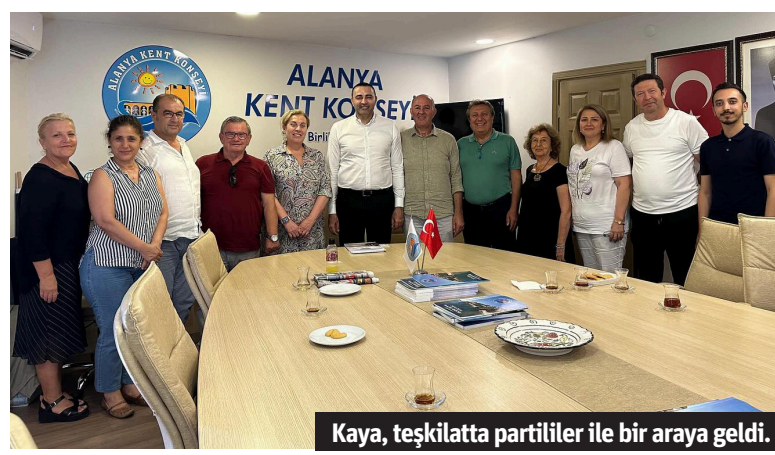
Kaya, teşkilatta partililer ile bir araya geldi.