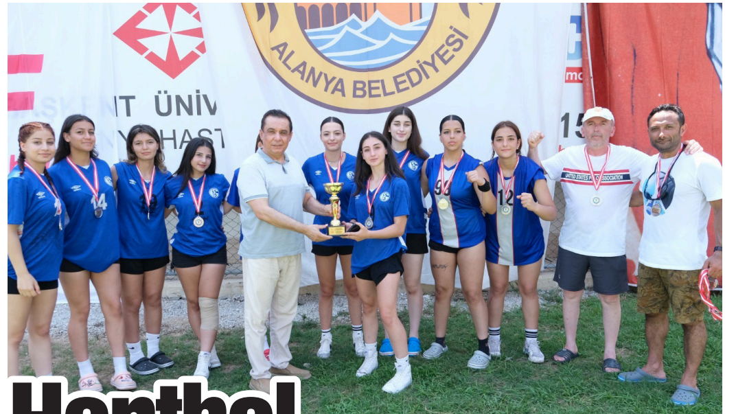
Turnuvada dereceye giren takımlara kupa takdim edildi.