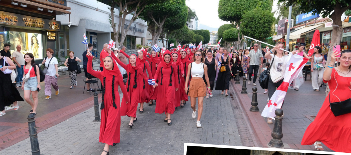
Şelale Meydanı'na kadar 'Dostluk Yürüyüşü' gerçekleştirildi.

Alanya Belediyesi ve Kafkas Company iş birliğiyle bu yıl ilk kez organize edilen 'Uluslararası Dostluk Festivali' renkli görüntülere sahne olurken; dostluk rüzgarı esti.