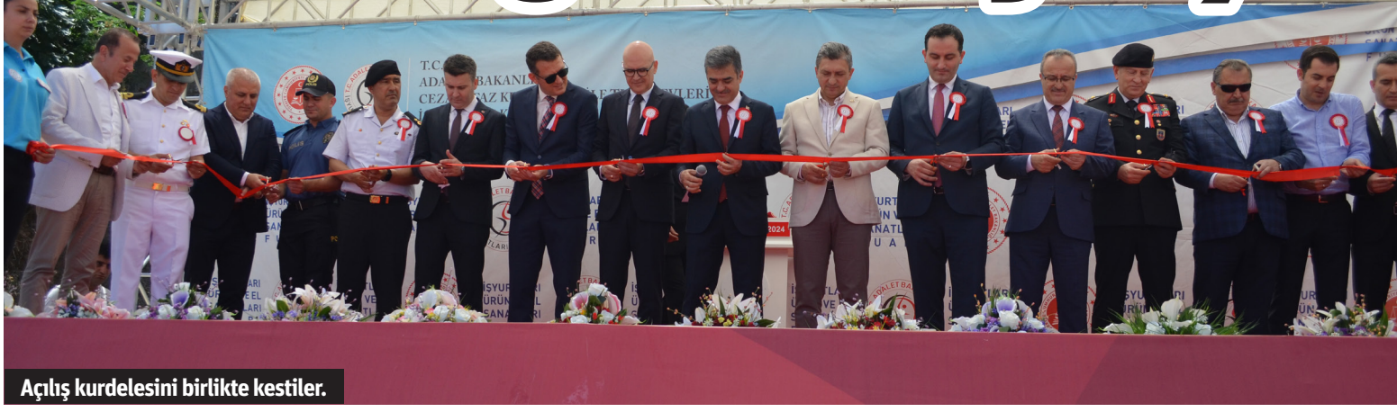
Açılış kurdelesini birlikte kestiler.

Alanya'da açılışı gerçekleştirilen 'İşyurtları Ürün ve El Sanatları Fuarı' ilk gündün ilgi gördü. Cezaevlerinde kalan hükümlü ve tutukluların ürettikleri eserlerin satışa sunulduğu fuar 5 Haziran Çarşamba günü saat 22.00'ye kadar ziyaret edilebilecek.