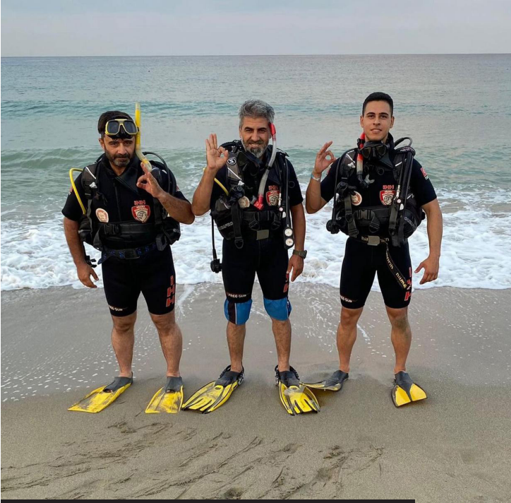
Dalgıçlar Kızılkule çevresinde deniz temizliği yapacak.

İHH, 'Dünya Çevre Günü' kapsamında 5 Haziran'da Kızılkule çevresinde deniz temizliği yapacak. Etkinlik ile denizlerdeki kirliliğe dikkat çekilerek farkındalık oluşturulması amaçlanıyor.