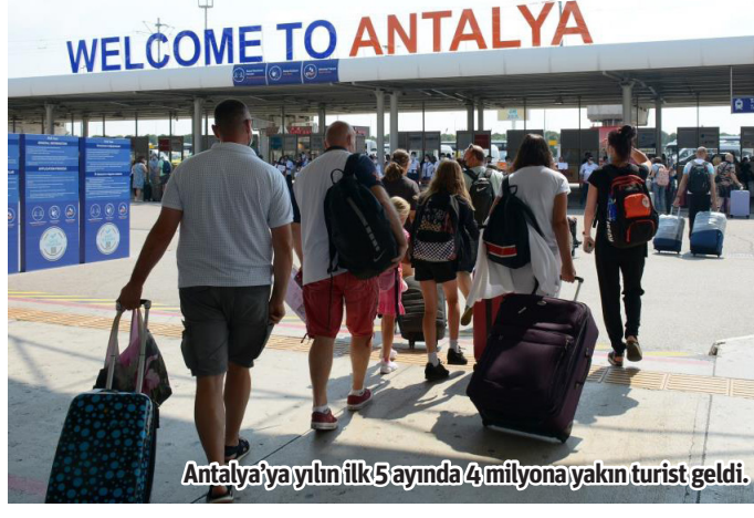
Antalya'ya yılın ilk 5 ayında 4 milyona yakın turist geldi.

aldı. Bu yılın mayıs ayında Almanya'nın önüne geçen Rusya Federasyonu'ndan Antalya'ya 491 bin 78 ziyaretçi geldi. Almanya 434 bin 609 ziyaretçi ile ikinci sırada yer alırken İngiltere ise 185 bin 221 ziyaretçi ile üçüncü oldu. Polonya, Hollanda, Kazakistan, Ukrayna, Litvanya, Romanya ve Belarus (Beyaz Rusya) ise İngiltere'nin ardından sırasıyla mayıs ayında Antalya'ya en çok ziyaretçi gönderen ülkeler arasında yer aldı. Geçtiğimiz yılın aynı dönemine göre, mayıs ayında ana pazar ülkelerden Rusya Federasyonu yüzde 26, Almanya yüzde 14, İngiltere yüzde 23, Polonya ve Hollanda yüzde 38, Kazakistan yüzde 11, Ukrayna yüzde 66, Romanya yüzde 45 ve Belarus da yüzde 36 oranlarında artış kaydetti. - İHA