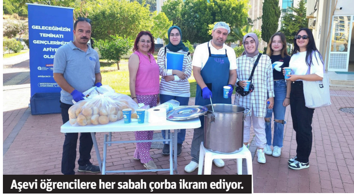
Aşevi öğrencilere her sabah çorba ikram ediyor.

Antalya Büyükşehir Belediyesi Aşevi, Alanya'daki üniversite öğrencilerine final haftasında her sabah çorba ikram ediyor.