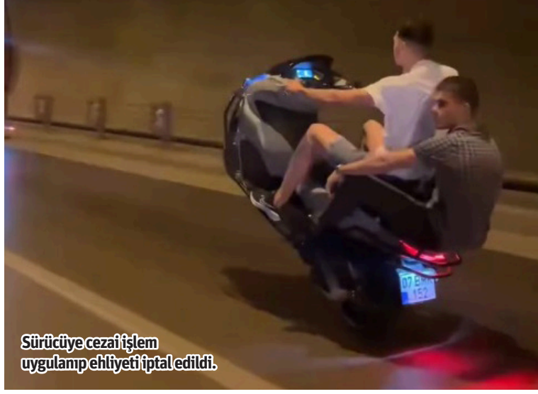
Sürücüye cezai işlem uygulanıp ehliyeti iptal edildi.

Alanya İlçe Emniyet Müdürlüğü ekiplerince tespit edildi. Alanya Şehit Abdullah Ümit Sercan Bölge Trafik Amirliği'ne davet edilen şahıs görüntülerdeki kişinin kendisi olduğunu kabul etti. Yapılan kontroller sonucunda motosiklet sürücüsüne 2918 sayılı Karayolları Trafik Kanunu'nun ilgili maddelerinden toplam 2 bin 196 TL cezai işlem uygulanarak ehliyeti daimi iptal edildi. - Alanya Kaymakamlığı / Bülten