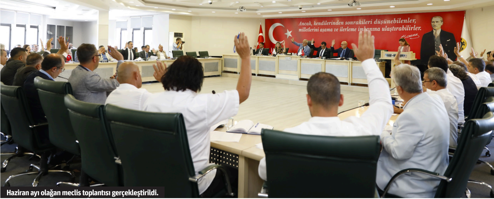
Haziran ayı olağan meclis toplantısı gerçekleştirildi.