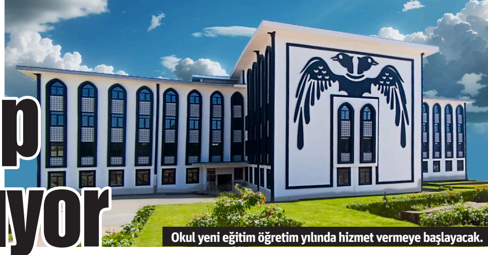
Okul yeni eğitim öğretim yılında hizmet vermeye başlayacak.