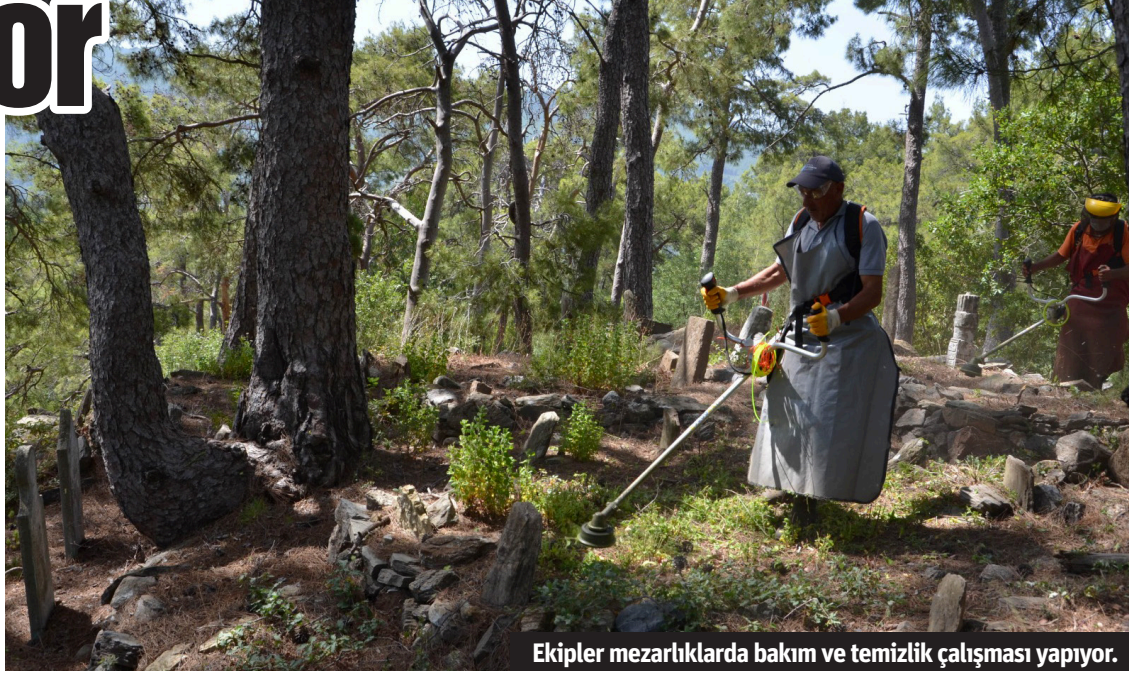
Ekipler mezarlıklarda bakım ve temizlik çalışması yapıyor.

■ ANTALYA Büyükşehir Belediyesi, Antalya merkez ve diğer ilçelerde mezarlıkları Kurban Bayramı'na hazırlıyor. Antalya Büyükşehir Belediyesi Sağlık İşleri Dairesi Başkanlığı'na bağlı olarak hizmet veren mezarlık ekipleri, vatandaşların kabir ziyaretlerini rahat ve güvenli bir şekilde yapabilmeleri için merkez ve ilçe mezarlıklarında genel temizlik ve bakım onarım çalışması yapıyor. Şehit mezarları da temizlenerek bayrama hazır hale getiriliyor. Kurban Bayramı nedeniyle merkez ve 19 ilçenin merkez mezarlıklarında arife günü vatandaşlara ücretsiz çiçek dağıtımı da yapılacak.