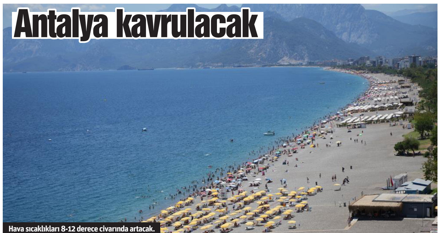
Hava sıcaklıkları 8-12 derece civarında artacak.

■ ANTALYA'DA hava sıcaklıklarının 8 ila 12 derece civarında artması bekleniyor. Meteoroloji 4. Bölge Müdürlüğü Bölge Tahmin ve Uyarı Merkezinden yapılan açıklamaya göre, bölgede mevsim normallerinin üzerinde seyretmesi tahmin edilen hava sıcaklığı hafta