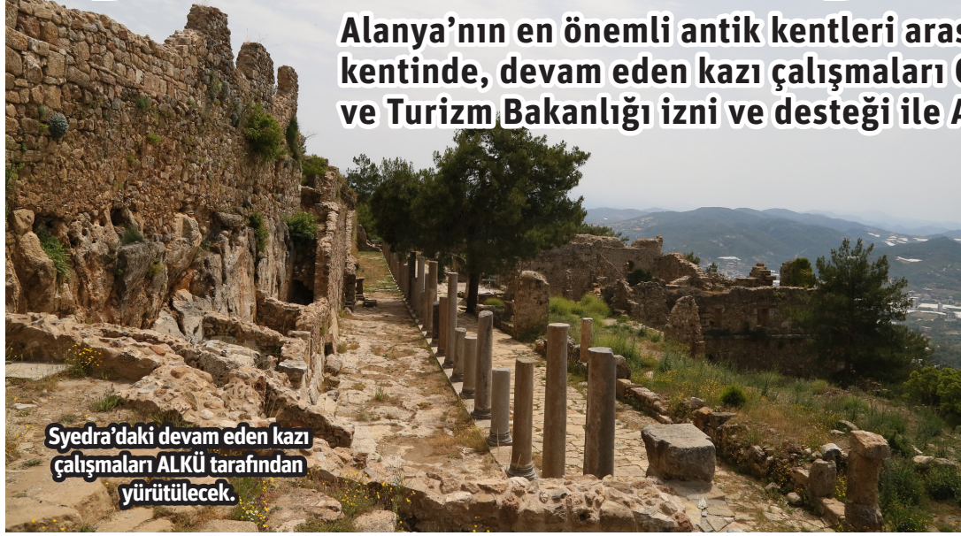
Syedra'daki devam eden kazı çalışmaları ALKÜ tarafından yürütülecek.

Alanya'nın en önemli antik kentleri arasında gösterilen Syedra antik kentinde, devam eden kazı çalışmaları Cumhurbaşkanlığı Kararı, Kültür ve Turizm Bakanlığı izni ve desteği ile ALKÜ tarafından yürütülecek.