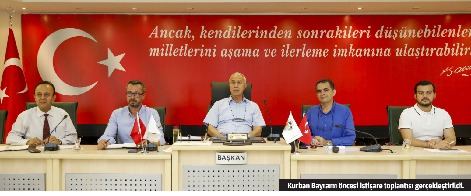
Kurban Bayramı öncesi istişare toplantısı gerçekleştirildi.