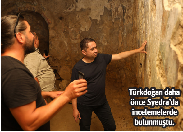
Türkdoğan daha önce Syedra'da incelemelerde bulunmuştu.

Syedra Antik Kenti'ndeki çalışmaları yakından takip ediyor, gerektiği yerde de çalışmalara desteklerimizi vermeye gayret ediyorduk. Cumhurbaşkanımız Sayın Recep Tayyip Erdoğan'ın kararı sonrası, çalışmalar üniversitemiz bünyemizde ilerleyecek. Üniversitemiz