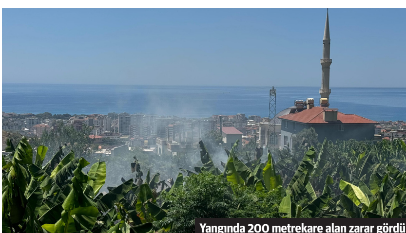
Yangında 200 metrekare alan zarar gördü.

geye itfaiye ekipleri sevk edildi. Alevlere 2 arazöz, 1 ilk müdahale aracı ve belediye temizlik İşleri aracı müdahale etti. Orman İşletme Müdürlüğü ekipleri ile Alanya Belediyesi İtfaiye ekiplerinin müdahalesi sonucu söndürülen yangının ardından bölgede soğutma çalışmaları yapıldı. Yangında yaklaşık 200 metrekarelik alanın zarar gördüğü öğrenildi. – Mehmet AL