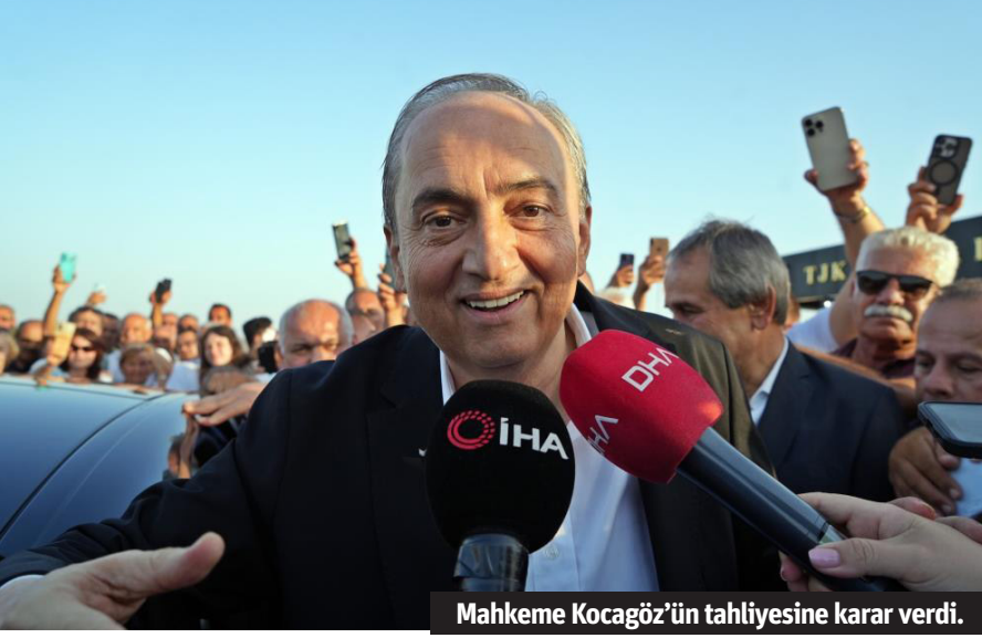
Mahkeme Kocagöz'ün tahliyesine karar verdi.

devamını, tutuksuz sanık Suphi Kaplan'ın da tutuklanmasını talep etti.