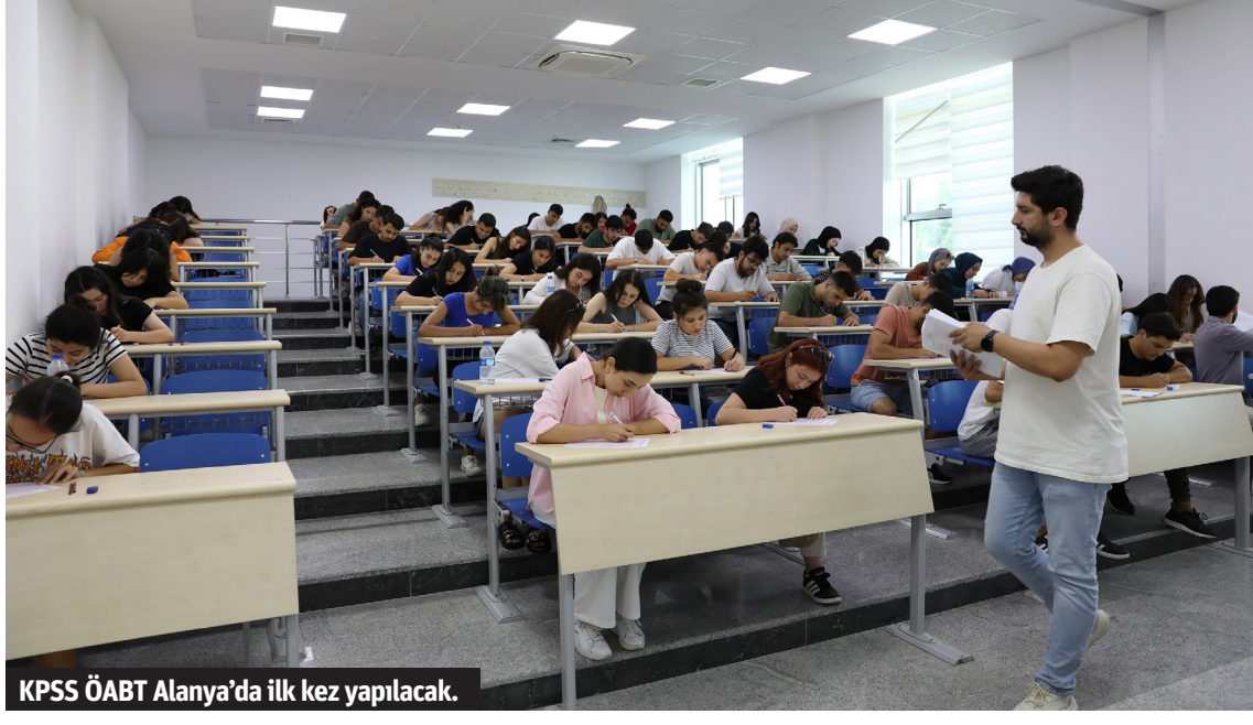
KPSS ÖABT Alanya'da ilk kez yapılacak.