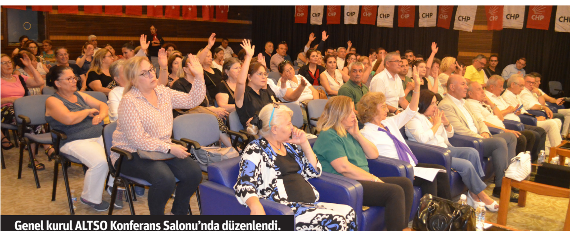
Genel kurul ALTSO Konferans Salonu'nda düzenlendi.