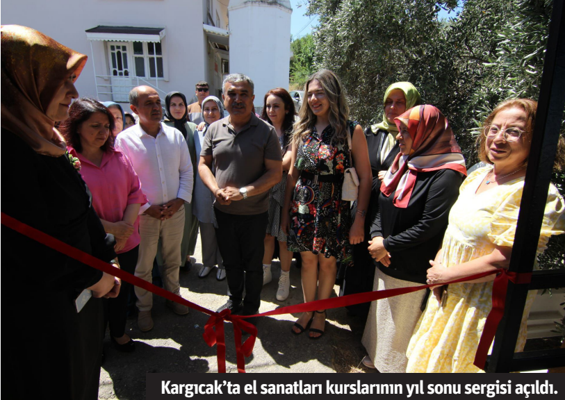
Kargıcak'ta el sanatları kurslarının yıl sonu sergisi açıldı.