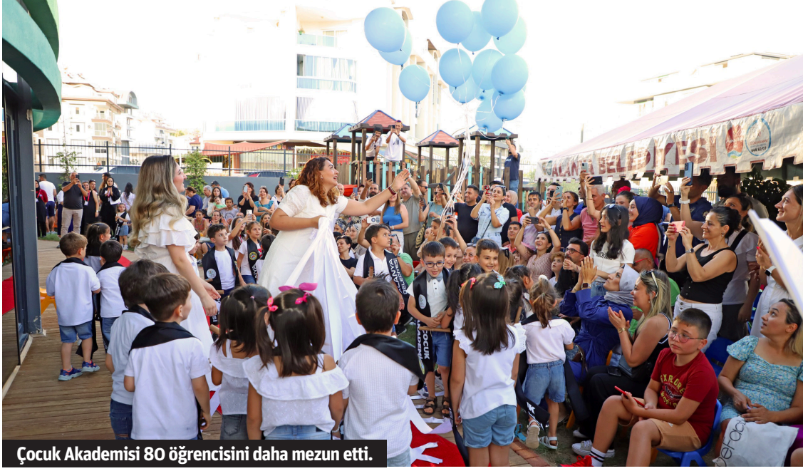
Çocuk Akademisi 80 öğrencisini daha mezun etti.

MINİKLER KENDİ KİTAPLARIYLA VEDA ETTİ Akademinin 5 yaş grubu öğrencileri, kendilerinin hazırladığı farkındalık çalışması ile veda etti. Minikler, "Kağıt çöp değildir" projesi ile artık kağıtları dönüştürerek kendi kitaplarını yaptılar. Dönem sonunda proje adımlarını anlatan sergi