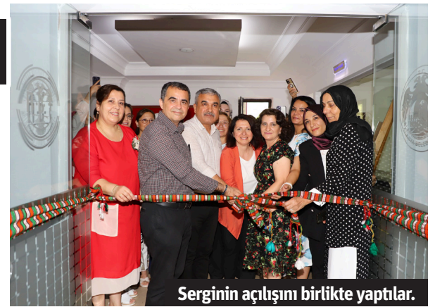
Serginin açılışını birlikte yaptılar.

Merkezimiz ve Milli Eğitim Müdürlüğü ile çok güzel iş birlikleri içerisindeyiz. Belediye olarak kamu yararına olan her şeyde bütün kurumlarımızla iş birliği yapıyoruz. Hem yeni yerler yapmak hem de kadınlarımızın bu eserleri satabilecekleri yeni yerler oluşturmak için projelerimiz var. Bu çalışmalardan çok mutluyuz ve geliştirmek istiyoruz. Alanya'da sanatı yaymak, Alanya'yı bir sanat şehri yapmak istiyoruz. Geleneksel el sanatları da bu anlamda çok önemli ve siz yapmazsanız unutulacak. O yüzden de bu sergi çok önemli" diye konuştu. ÜÇ GÜN BOYUNCA ZİYARETE AÇIK