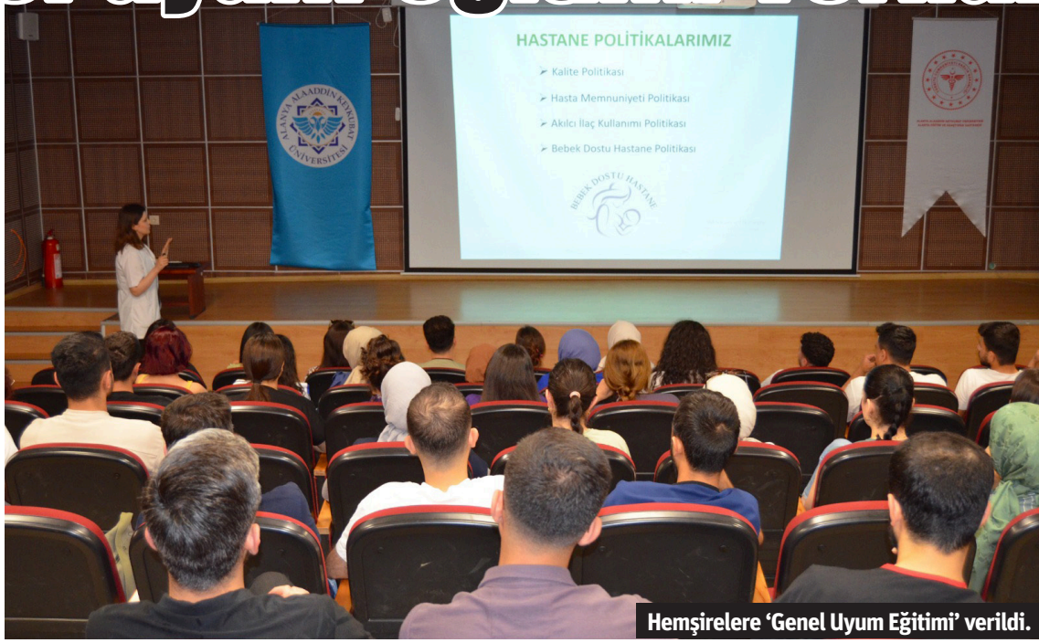
Hemşirelere 'Genel Uyum Eğitimi' verildi.

■ SAĞLIKTA kalite standartları gereği hastanede göreve yeni başlayan hemşirelere kalite yönetim birimi tarafından konferans salonunda kurum hizmet ve süreçlerin tanınmasını sağlamak, yapacakları iş ile ilgili bilgileri ana hatları ile aktararak adaptasyon sürecinin hızlandırılması adına uyum eğitimi düzenlendi. Toplantı boyunca katılımcılara, hastane misyon, vizyon ve değerleri, fiziki yapısı, el hijyeni, standart enfeksiyonun korunma önlemleri, izolasyon önlemleri hakkında bilgilendirme ve korunma yolları, hemşirelik uygulamalarında kayıt ve önemi, hasta hakları, çalışan güvenliği ve çalışan