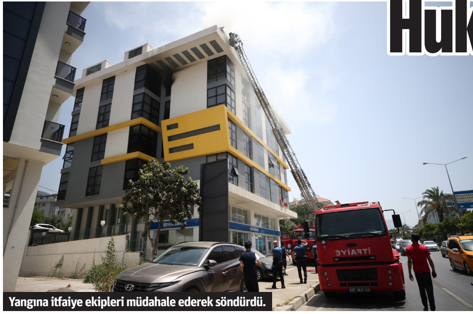
Yangına itfaiye ekipleri müdahale ederek söndürdü.

ANTALYA'DA polislerin yaptığı operasyonda 3 milyon 500 bin şişe kaçak alkollü içki ele geçirildi. Operasyonun Cumhuriyet tarihinin tek seferde en büyük miktarlı kaçak içki operasyonu olduğu bildirildi. Antalya Cumhuriyet Başsavcılığı koordinesinde, Kaçakçılık ve Organize Suçlarla Mücadele (KOM) Şube Müdürlüğü ile ilgili kurum görevlileri tarafından, turizm sezonunun açılışıyla birlikte otellere satılmak üzere yüklü miktarda kaçak alkollü Muratpaşa'da depolandığı bilgisinin edinilmesi üzerine 2 depoda arama yapıldı. Aramalarda 3 milyon 550 bin kaçak alkollü içki ele geçirildi. Bu miktarın Cumhuriyet tarihinde tek seferde yakalanan en büyük miktar olduğu ve önlenecek vergi kaybının yaklaşık 60 milyon lira olduğu bilgisi paylaşıldı. Konuyla ilgili yakalanan 2 şüpheli hakkında "5607 Sayılı Kaçakçılıkla Mücadele Kanununa Muhalefet Etmek" suçundan adli işlem yapıldı. - İHA