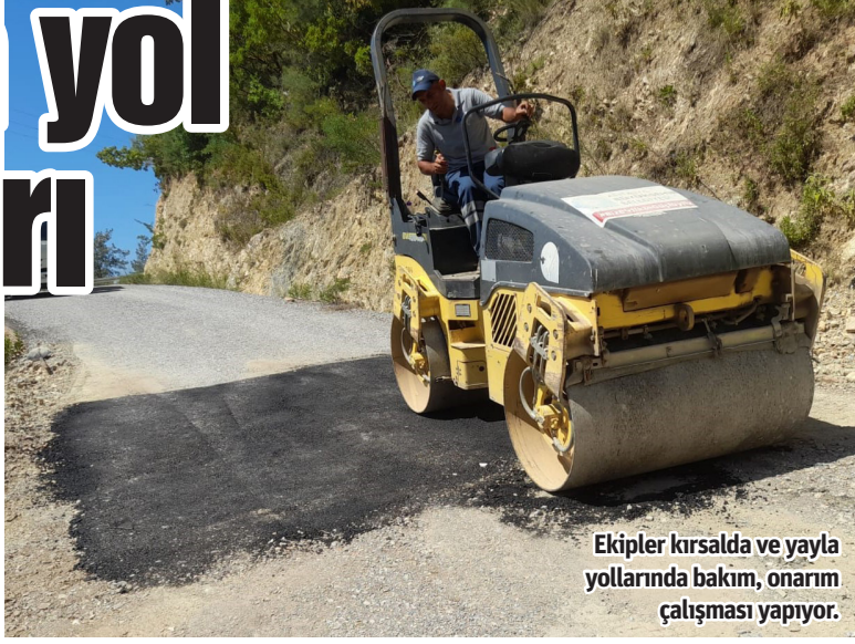
Ekipler kırsalda ve yayla yollarında bakım, onarım çalışması yapıyor.

Antalya Büyükşehir Belediyesi, Alanya'nın kırsal mahalle ve yayla yollarda bakım, onarım çalışması yapıyor.