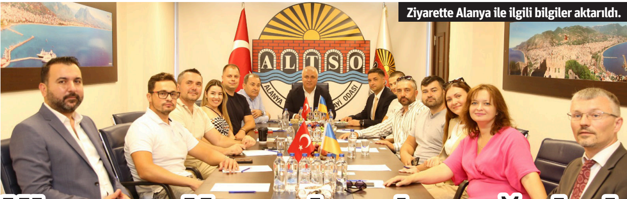
Ziyarette Alanya ile ilgili bilgiler aktarıldı.

lama çalışması yapıyor. Alanya'da Çıplaklı, Konaklı ve Mahmutlar'daki kurban pazarlarında ilaçlamanın yanı sıra kara sinek tuzaqları ve sinek şeritleri satış noktalarına takılıyor. Çalışmalar bayrama kadar devam edecek. Bayram sonrası da satış alanları ilaçlanacak. - Antalya Büyükşehir Belediyesi / Bülten