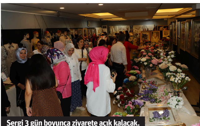
Sergi 3 gün boyunca ziyarete açık kalacak.

Sergide, kursiyerlerin hünerli ellerinden çıkan hüsnühat, rölyef, koza, kumaş çiçek, iğne oyası, giyim, mefruşat, dekoratif sepet, ahşap boyama ve resimden oluşan binlerce ürün yer aldı. 14 usta öğretici tarafından 6 kurs merkezinde bin 773 kursiyere verilen eğitimlerin sonucunda elde edilen el emeklerinden seçilen, üç gün boyunca Belediye Kültür Merkezi'nde ücretsiz olarak sergilenen. - Alanya Belediyesi / Bülten