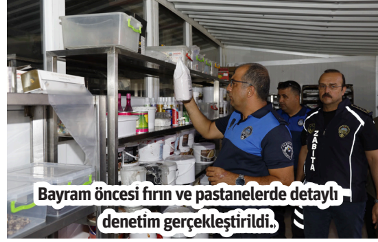
Bayram öncesi fırın ve pastanelerde detaylı denetim gerçekleştirildi.