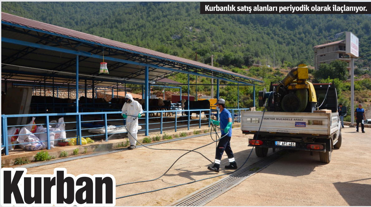
Kurbanlık satış alanları periyodik olarak ilaçlanıyor.

Resmi İlanlar www.ilan.gov.tr adresinde yayınlanmaktadır. Basın No : ILN02046932