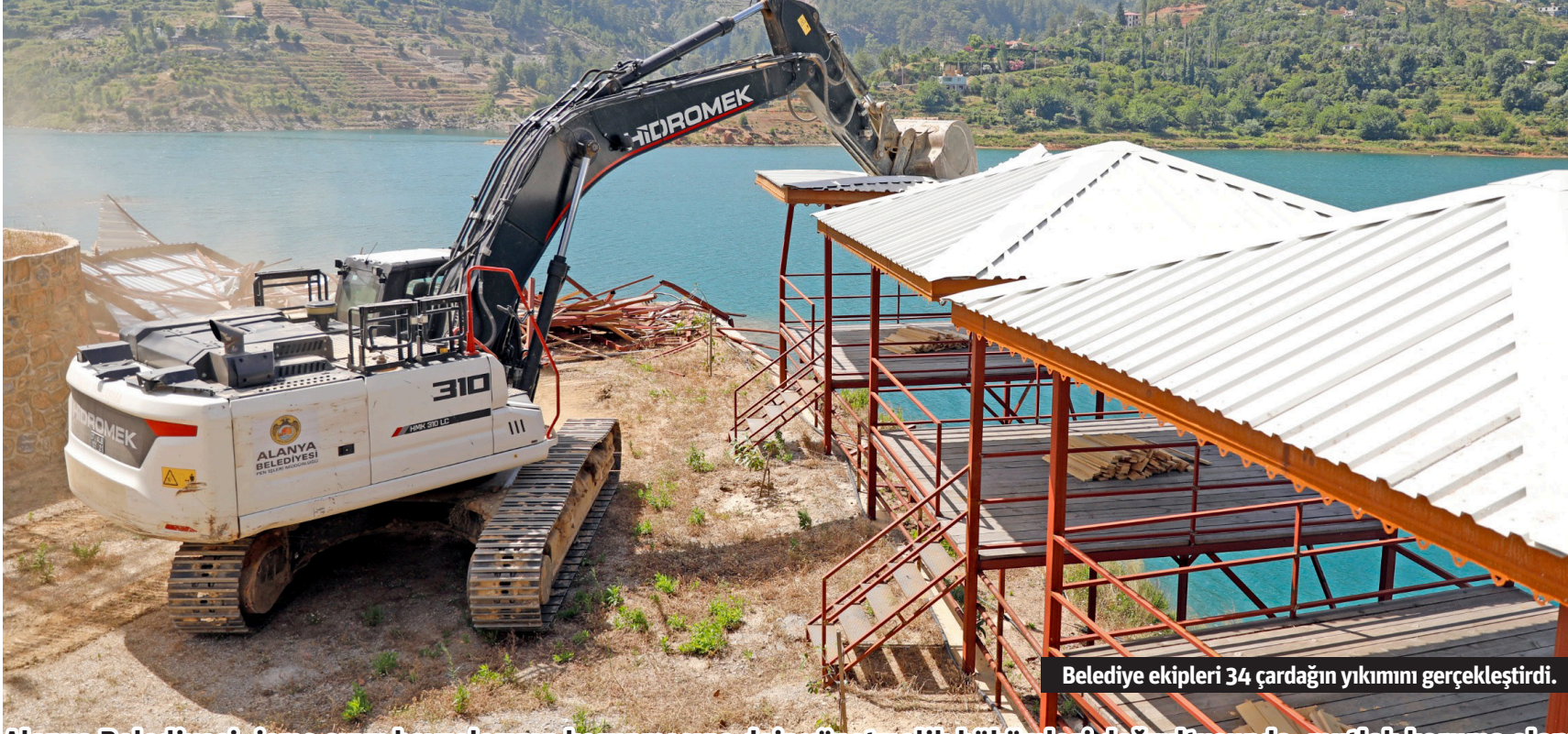
Belediye ekipleri 34 çardağın yıkımını gerçekleştirdi.

Alanya Belediyesi, içme suyu havzalarının korunmasına dair yönetmelik hükümleri doğrultusunda, mutlak koruma alanı içerisinde yer alan Dim Barajı üzerindeki ruhsatsız ve izinsiz betonarme inşaat ile 34 çardağın yıkımını gerçekleştirdi.