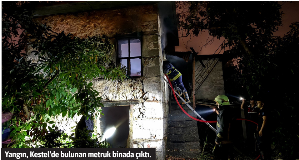
Yangın, Kestel'de bulunan metruk binada çıktı.

■ ALANYA'DA metruk bir binada çıkan yangın çevredeki seralara sıçramadan itfaiye ekipleri tarafından söndürüldü. Yangın, Kestel Mahallesi'nde meydana geldi. Metruk bir binada henüz bilinmeyen nedenle yangın çıktı. Alevleri gören çevredeki vatandaşlar durumu 112 Acil Çağrı Merkezi'ne bil-