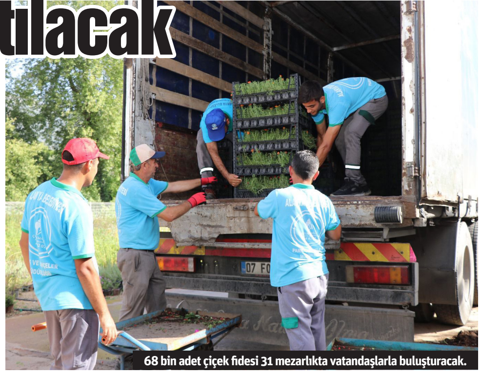
68 bin adet çiçek fidesi 31 mezarlıkta vatandaşlarla buluşturulacak.

Batı bölgesinde Okurcalar Karaburun Mezarlığı, Okurcalar Merkez Mezarlığı, İncekum Karabunuzlar Mezarlığı, İncekum Kakaşlar Mezarlığı, İncekum Merkez Mezarlığı, Avsallar Merkez Mezarlığı, Türklükler Belediye Mezarlığı, Payallar Merkez Mezarlığı, Toslak Mezarlığı, Elikesik Mezarlığı, Güzelbağ Merkez Mezarlığı, Konaklı Mandıra Mezarlığı, Emişbeleni Merkez Mezarlığı'nda çiçek dağıtılacak. Doğuda ise Kestel Hanönü Mezarlığı, Kestel Yangılı Mezarlığı, Mahmutlar Cücenler Mezarlığı, Mahmutlar Gilikli Mezarlığı, Mahmutlar Dörttyol Mezarlığı, Mahmutlar Belediye Mezarlığı, Kargıcak Sahil Mezarlığı, Demirtaş Sahil Mezarlığı, Demirtaş Merkez Mezarlığı'nda çiçek dağıtılacak. - Alanya Belediyesi / Bülten