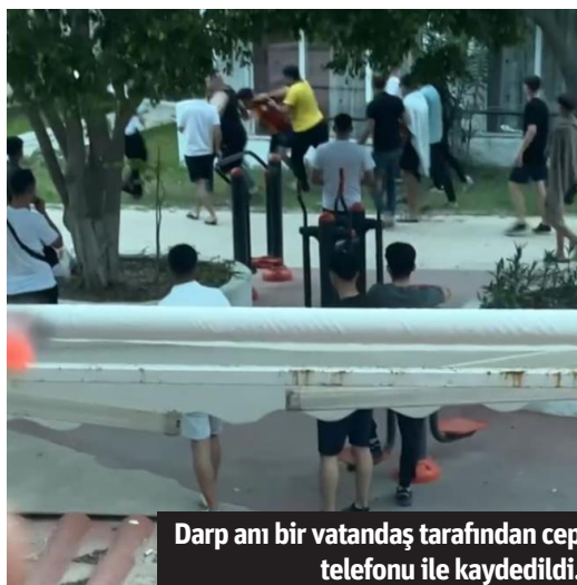
Darp anı bir vatandaş tarafından cep telefonu ile kaydedildi.

gelmesiyle güvenlik görevlilerinden şikayetçi olurken, hastaneden de darp raporu aldılar. İki çocuğun darp edilme anları ise çevredeki bir vatandaşın cep telefonu kamerasıyla kayıt altına alındı. Görüntülerde çocukların, güvenlik görevlileri tarafından darp edildiği anlar yer aldı. "ONLARIN ŞEFİ GELDİ, BOĞAZIMI TUTTU" Mağdur çocuklardan Erkan G., güvenlik görevlilerinin gereken cezayı almalarını istediklerini belirterek, "Siirt'ten buraya staj yapmak için geldik. 3-4 gün önce lojmanın sahasında top oynarken oyun alanında bir tane güvenlik geldi. 'At topu biz de oynayalım' falan dedi. Biz 'hayır' dedik. Ondan sonra yanıma bir güvenlik daha geldi. 'Oynayın ama ağaçlara falan topu vurmayın' dedi. O da oradan gittikten sonra 3-4 tane güvenlik daha geldi. Bizi videoya alarak geldiler. 'Hayırdır oğlum burada