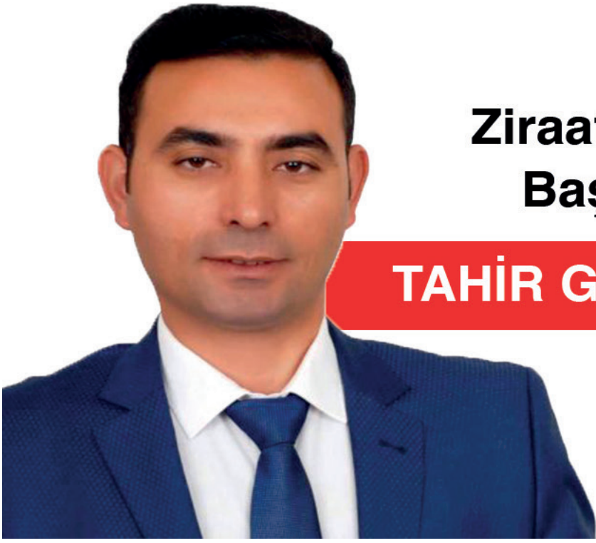
Ziraat Odası Başkanı

Kurban Bayramı'nızı kutlar sağlık, mutluluk ve huzur dilerim.