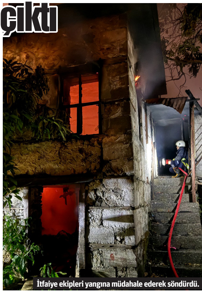
İtfaiye ekipleri yangına müdahale ederek söndürdü.

dirdi. İhbar üzerine bölgeye itfaiye ve jandarma sevk edildi. Olay yerine gelen itfaiye ekiplerinin kısa süreli çalışması sonucunda yangın çevredeki seralara sıçramadan kontrol altına alındı. Metruk bina yangında kullanılamaz hale gelirken yangının çıkış nedeni araştırılıyor. - Mehmet AL