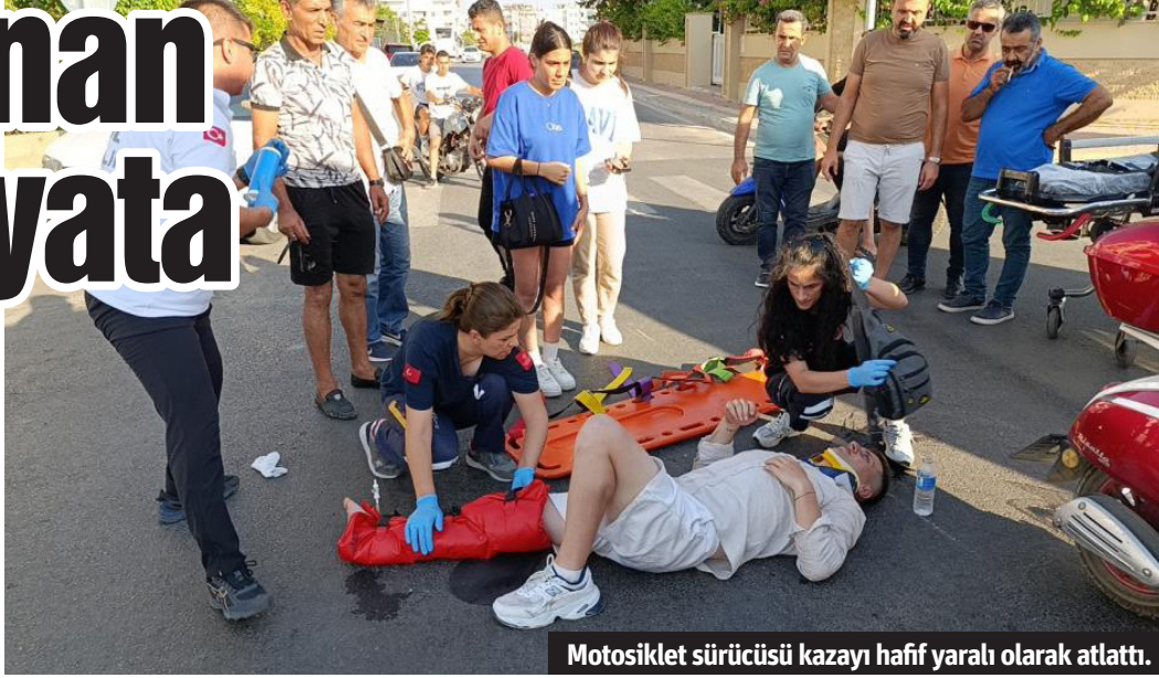
Motosiklet sürücüsü kazayı hafif yaralı olarak atlattı.

Manavgat'ta midibüs ile motosiklet kafa kafaya çarpıştı. Motosiklet sürücüsü kaskı parçalanmasına rağmen kazayı hafif yaralı olarak atlattı.