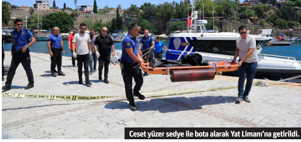
Ceset yüzer sedye ile bota alarak Yat Limanı'na getirildi.

OLAY, saat 13.30 sıralarında Muratpaşa'nın Fener Mahallesi, Baba Burnu Mevkii'nde meydana geldi. Amatör dalgıçlık yapan ve yüzmek için denize giren bir vatandaş, yapay şelalenin denize döküldüğü noktadaki kayalıklarda insan vücuduna benzer bir cisim fark etti. Kayalık alana yaklaşan ve cismi inceleyen vatandaş, yayılan kökü koku sonrası deniz polisi ile irtibata geçerek durumu bildirdi. İhbar üzerine olay yerine giden Antalya Emniyet Müdürlüğü Deniz Limanı Şube Müdürlüğü ekipleri, kol, bacak