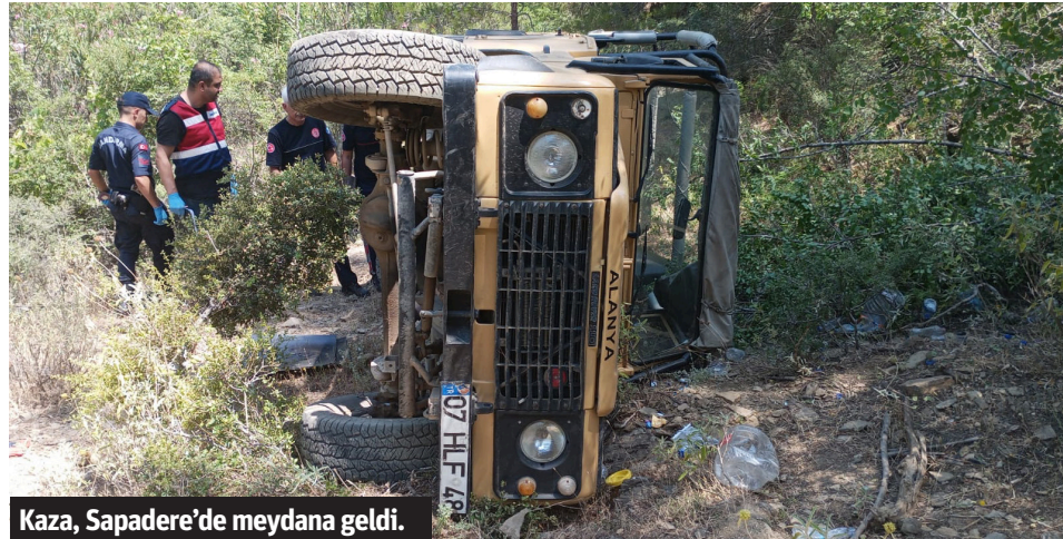
Kaza, Sapadere'de meydana geldi.

Alanya'da uçuruma yuvarlanan safari aracındaki 1 kişi ölürken, 3 kişi yaralandı. Olay yerinden kaçan sürücü ormanlık alanda jandarma tarafından yakalanırken, yaralanan 1'i çocuk 3 kişi hastaneye kaldırıldı.