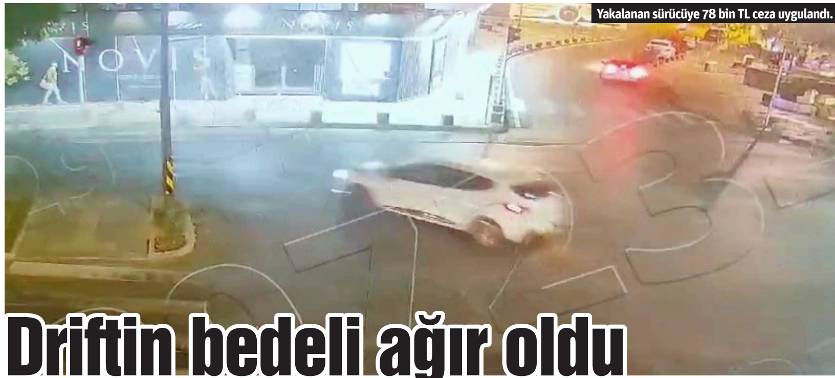
Yakalanan sürücüye 78 bin TL ceza uygulandı.