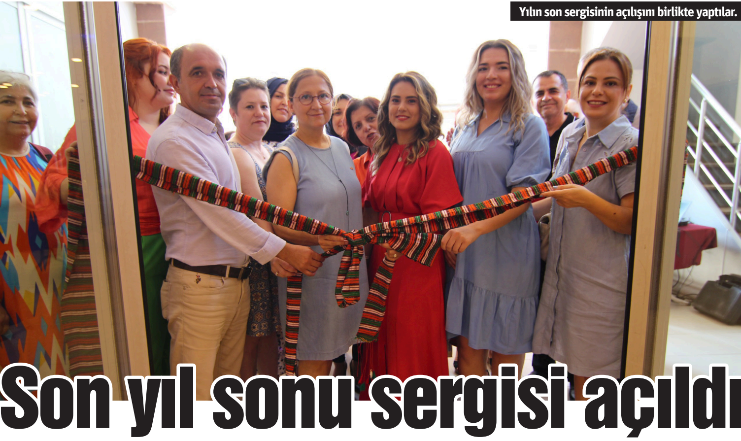
Yılın son sergisinin açılışını birlikte yaptılar.