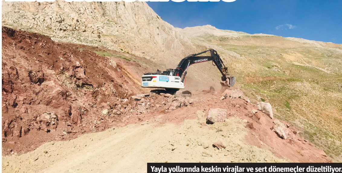
Yayla yollarında keskin virajlar ve sert dönemeçler düzeltiliyor.