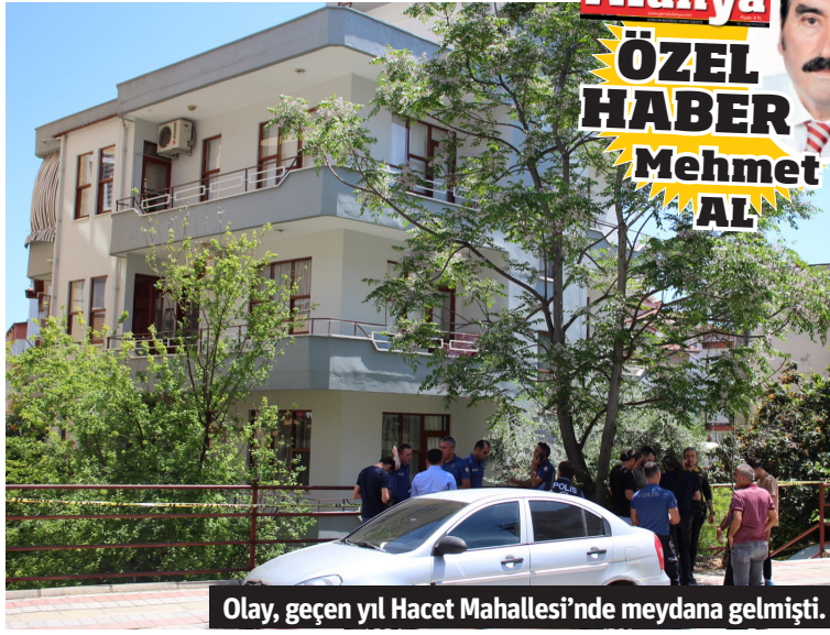
Olay, geçen yıl Hacet Mahallesi'nde meydana gelmişti.