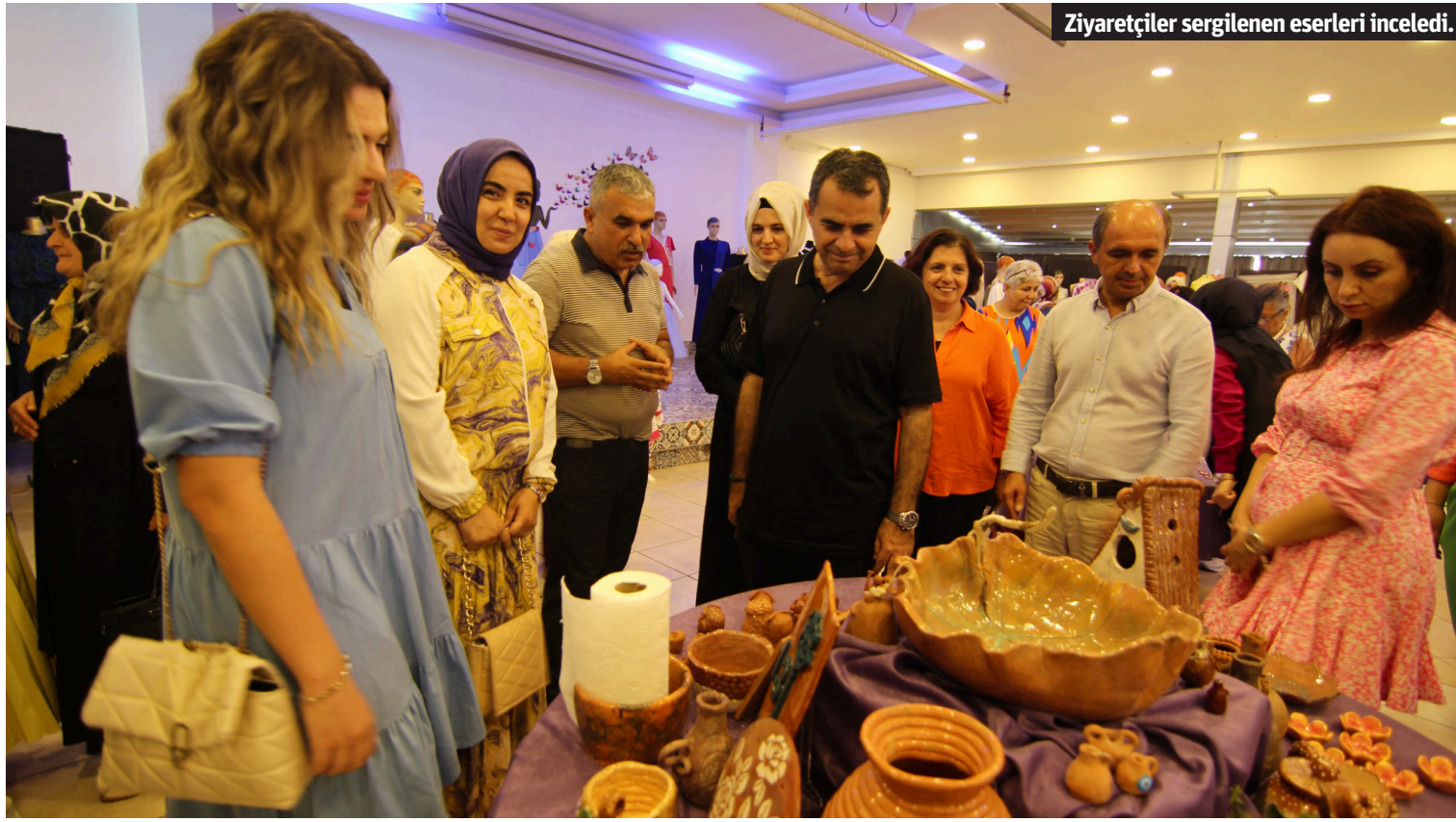
Ziyaretçiler sergilenen eserleri inceledi.

kuaförlük branşlarında eğitim aldı. Sergide ayrıca bu yıl ilk kez açılan kuaförlük meslek kursuna katılan kursiyerler de saç bakımı konusundaki becerilerini katılımcılara gösterdiler. 20 AĞUSTOS'TAN İTİBAREN YENİ BAŞVURULAR BAŞLIYOR Kursiyerler Alanya Belediyesi, İlçe Milli Eğitim Müdürlüğü ve Halk Eğitimi Merkezi'ne teşekkür ederek gelecek eğitim yılında da aynı şekilde kursların devam etmesini istedikler. 24-25 Haziran tarihlerinde açık kalacak sergiyi tüm vatandaşlar ziyaret edebilecek. Öte yandan, 2024-2025 Eğitim Öğretim döneminde açılacak kurslar için 20 Ağustos 2024 tarihinden itibaren Alanya Belediyesi Kültür ve Sosyal İşler Müdürlüğü Hasanağalar Konağı ile Mahmutlar Mahallesi El Sanatları Merkezine başvuru yapabilecek. Vatandaşlar, 0242 511 12 98 telefon numarası üzerinden konuyla ilgili bilgi alabilecekler. - Alanya Belediyesi / Bülten