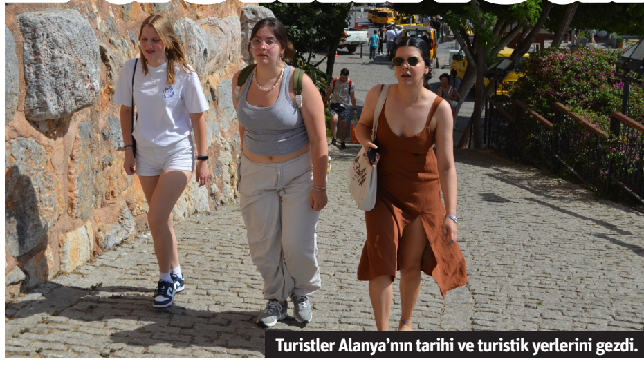
Turistler Alanya'nın tarihi ve turistik yerlerini gezdi.

KIBRIS'IN Limasol şehrinde yola çıkan Bahama bayraklı 265 metre uzunluğundaki 'Marella Discovery' isimli lüks kruvaziyer gemisi sabah saatlerinde Alanya Limanı'na demirledi. 758 mürettebatı bulunan 'Marella Discovery' ilçeye çoğunluğu İngiliz olmak üzere bin 758 turist getirdi. Gemiden inen turistlerin bazıları tur otobüslerini ve safari ciplerini tercih ederken büyük çoğunluğu Alanya'nın tarihi ve turistik yerlerini gezmeyi tercih etti. 'Marella Discovery' saat 17.00'de Rodos Adası'na gitmek üzere Alanya Limanı'ndan ayrıldı. - Erkan Uysal