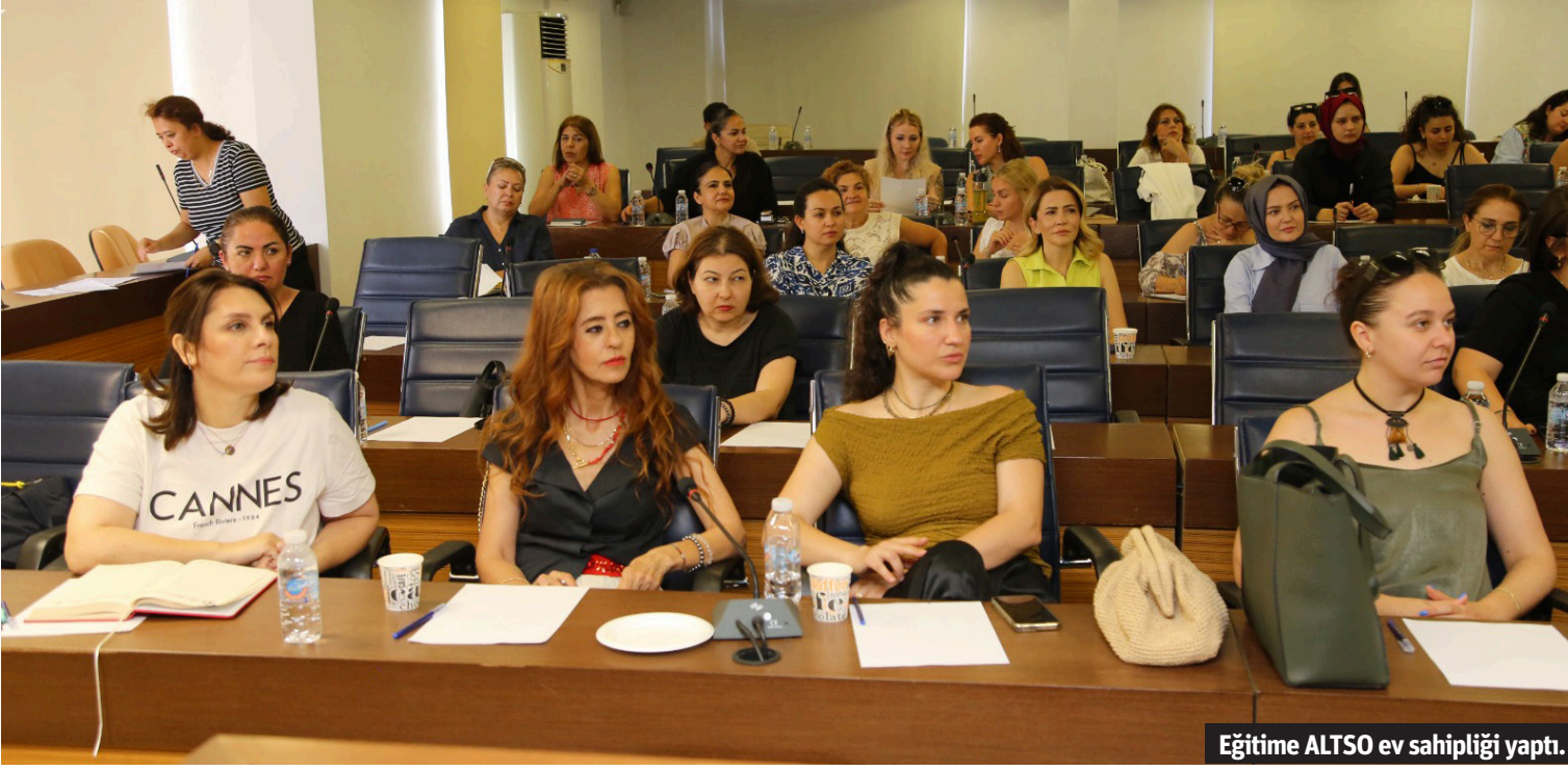
Eğitime ALTSO ev sahipliği yaptı.