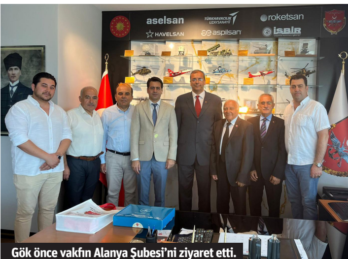
Gök önce vakfın Alanya Şubesi'ni ziyaret etti.