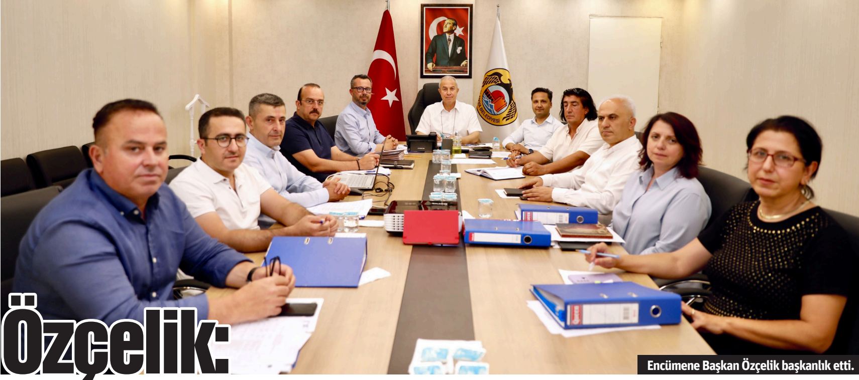
Encümene Başkan Özçelik başkanlık etti.