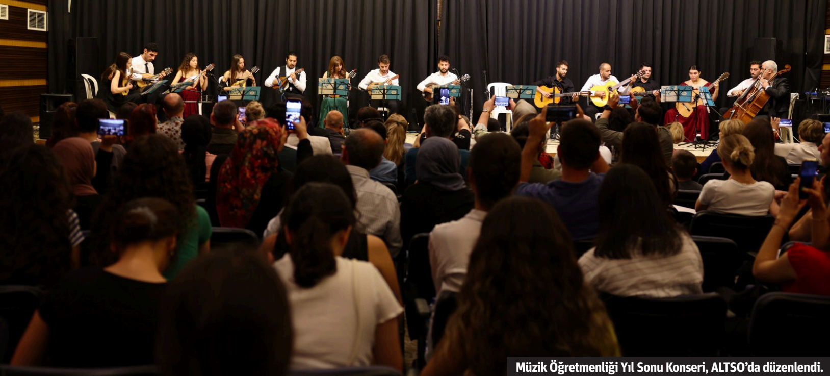
Müzik Öğretmenliği Yıl Sonu Konseri, ALTSO'da düzenlendi.

ALKÜ Eğitim Fakültesi Müzik Eğitimi Ana Bilim Dalı tarafından düzenlenen organizasyonda yapılan müzik konserleri dinleyicileri mest ederek dinleyicilerden tam not alıyor.