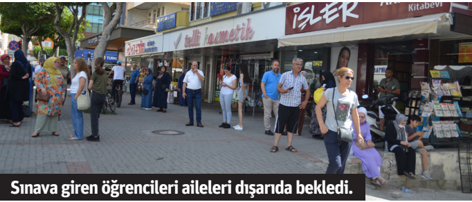
Sınava giren öğrencileri aileleri dışarda bekledi.

Alanya'da üniversite hayali kuran 22 bin 697 aday hafta sonu gerçekleştirilen YKS'de ter döktü. TYT, AYT ve YDT oturumlarına katılan adayların sınav sonuçları 17 Temmuz'da açıklanacak.