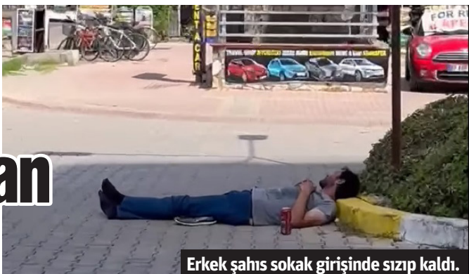
Erkek şahsın sokak girişinde sızıp kaldı.

Alanya'da yolun ortasında alkolden sızan erkek şahsa jandarma ekipleri müdahale etti. Şahsı uyurken cep telefonu kamerası ile kaydeden vatandaş, "Abi kendi memleketimde ben böyle tatil yapamıyorum. Helal olsun adama" yorumunda bulundu.