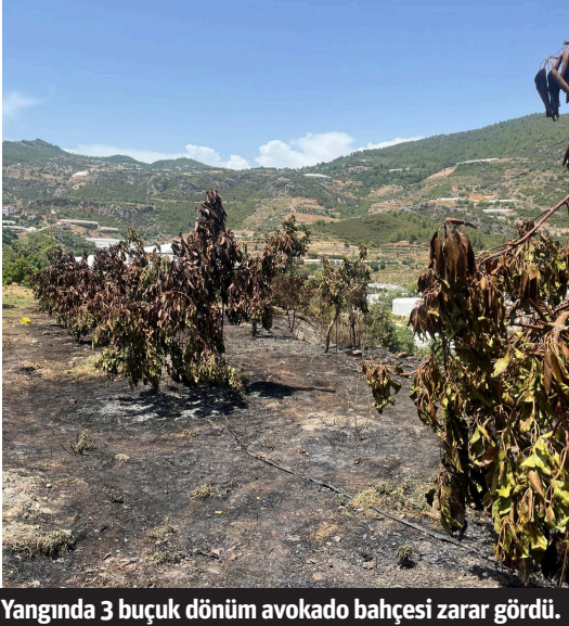
Yangında 3 buçuk dönüm avokado bahçesi zarar gördü.