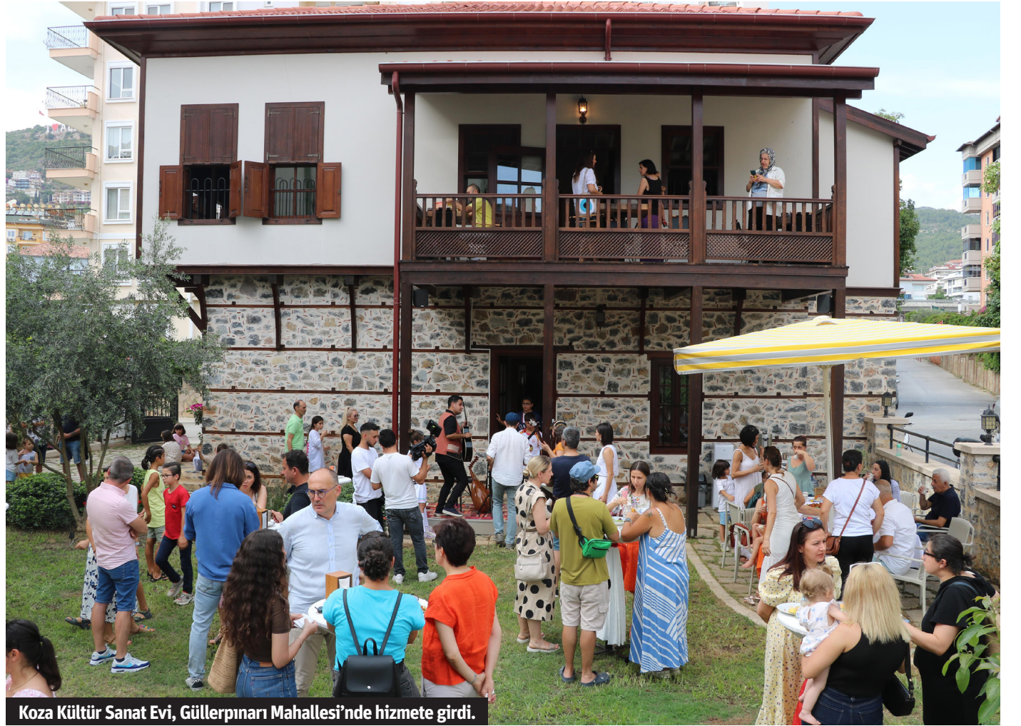
Koza Kültür Sanat Evi, Güllerpınarı Mahallesi'nde hizmete girdi.