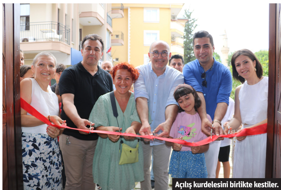
Açılış kurdelesini birlikte kestiler.