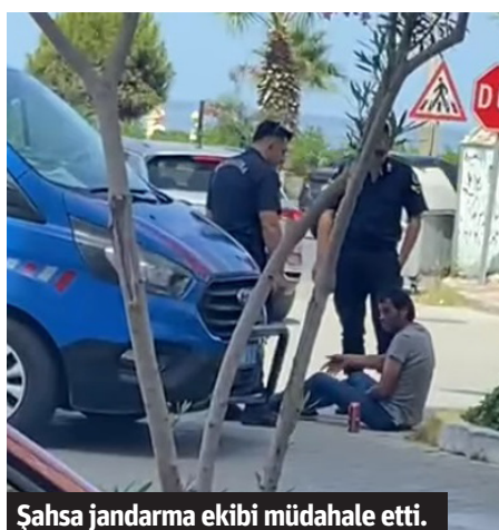
Şahsa jandarma ekibi müdahale etti.

Alanya'da yolun ortasında alkolden sızan erkek şahsa jandarma ekipleri müdahale etti. Şahsı uyurken cep telefonu kamerası ile kaydeden vatandaş, "Abi kendi memleketimde ben böyle tatil yapamıyorum. Helal olsun adama" yorumunda bulundu.