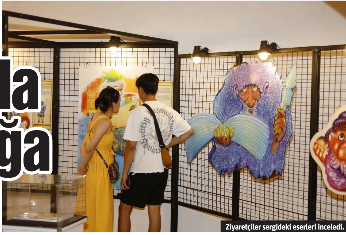
Ziyaretçiler sergideki eserleri inceledi.

Tarihi mekanları sanatla buluşturan Alanya Belediyesi, Kale'deki Bedesten Çarşısı'nda "Zaman Tünelinde Alanya" adlı sergiyi açtı. Yaz boyunca açık kalacak sergi, ücretsiz ziyaret edilebilecek.