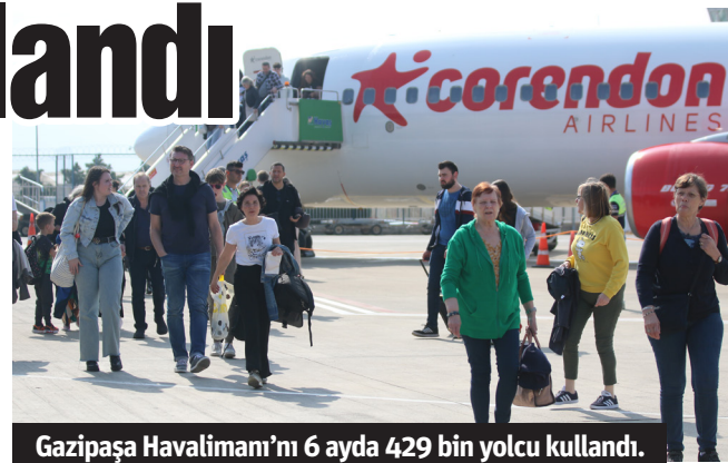
Gazipaşa Havalimanı'nı 6 ayda 429 bin yolcu kullandı.

Haziran'da Türkiye genelinde hizmet veren havalimanlarında iç hat yolcu trafiğinin 9 milyon 48 bin 214'e, dış hat yolcu trafiğinin ise 13 milyon 645 bin 102'ye ulaştığını kaydeden Bakan Uraloğlu, söz konusu ayda direkt transit yolcular ile toplam 22 milyon 723 bin 642 yolcuya hizmet verildiğini bildirdi. Uraloğlu, "2024 yılının Haziran ayında hizmet verilen yolcu trafiği 2023 yılının aynı ayı ile kıyaslandığında iç hat yolcu trafiğinde yüzde 6,4; dış hat yolcu trafiğinde yüzde 9,1 olmak üzere direkt transit dâhil toplam yolcu trafiği yüzde 7,9 artış gösterdi. Havalimanları yük trafiği ise haziran ayında iç hatlarda 87 bin 78 ton, dış hatlarda ise 376 bin 957 ton olmak üzere toplamda 464 bin 35 tona ulaştı" ifadelerini kullandı.