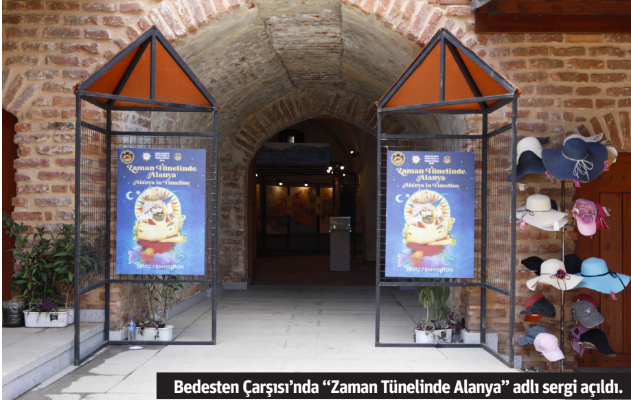
Bedesten Çarşısı'nda "Zaman Tünelinde Alanya" adlı sergi açıldı.

ALANYA tarihinin sistematik olarak anlatıldığı Zaman Tünelinde Alanya kitabında, iki kardeşin Damlatas Plajı'ndan başlayıp Damlatas Mağarası'nda son bulan zaman tüneline yolculuğu anlatılıyor. Tarihin Babası unvanıyla tanınan ünlü tarihçi Herodot ile başlayan kardeşlerin bu yolculuğu daha sonra; Kleopatra, Kir Fart, Ertokuş Bey, Alaeddin Keykubat, İbni Bibi, İbni Batuta, Kaygusuz Abdal, Kılıç Arslan, Gedik Ahmet Paşa, Piri Reis, Kanuni Sultan Süleyman, Evliya Çelebi, Kaptan Beafort, Hamdullah Emin Paşa ve Türkiye Cumhuriyeti'nin kuru-