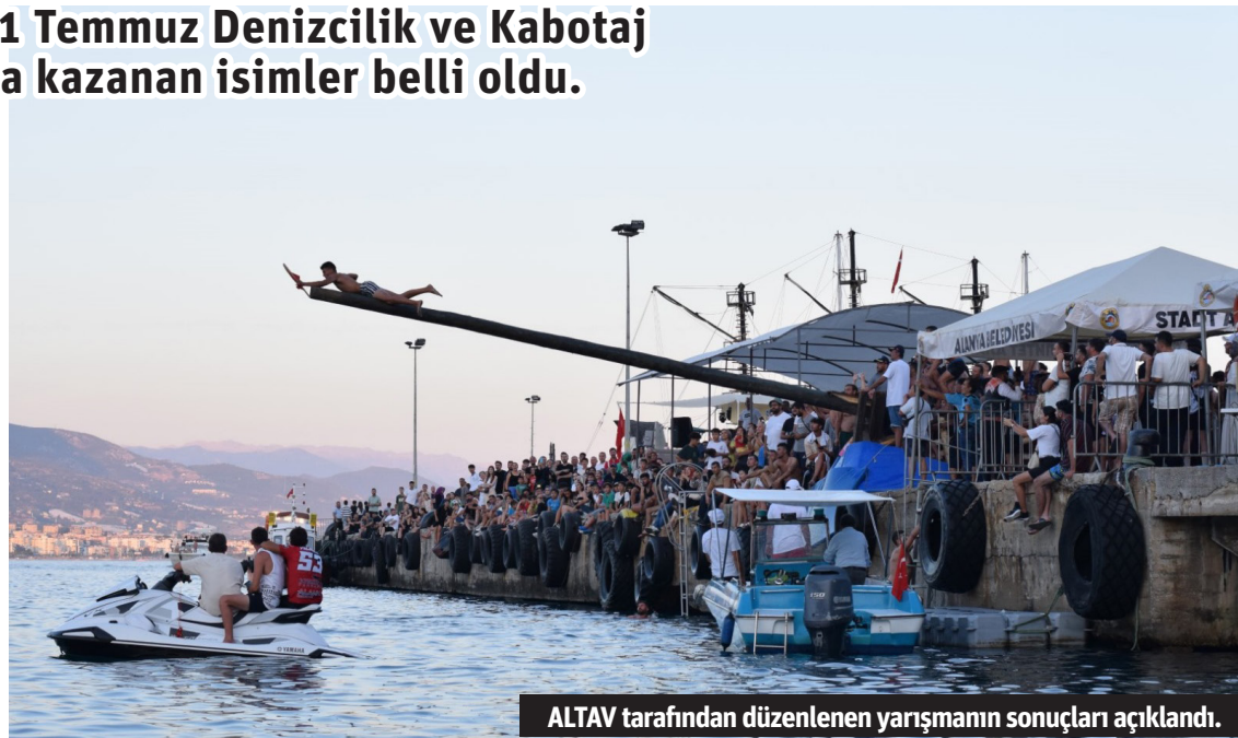
ALTAV tarafından düzenlenen yarışmanın sonuçları açıklandı.

ALANYA Turizm Tanıtma Vakfı (ALTAV) tarafından 1 Temmuz Denizcilik ve Kabotaj Bayramı kapsamında katılımcılar, fotoğraf yarışmasına aynı gün çektiği