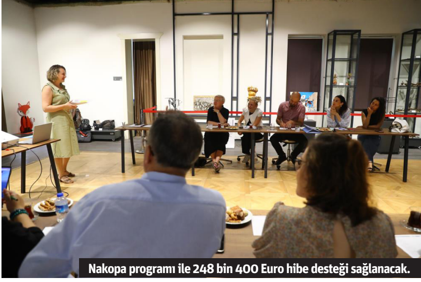
Nakopa programı ile 248 bin 400 Euro hibe desteği sağlanacak.

İKLİMİLE İLGİLİ SENARYOLAR SUNULACAK Projeye, Antalya Çevre Eğitim ve İnovasyon Merkezi'nde hareketli görüntülerini yer aldığı interaktif bir öğrenme ortamı sağlanacak. Bu amaçla oluşturulacak kübik odada, insan kaynaklı iklim değişikliğine ilişkin senaryolar ve infografikler üç