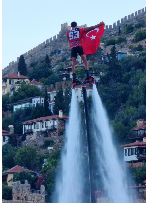
10 bin TL'lik ödül 5 yarışmacı arasında paylaşılacak.

ALTAV tarafından düzenlenen '1 Temmuz Denizcilik ve Kabotaj Bayramı Fotoğraf Yarışması'nda kazanan isimler belli oldu.