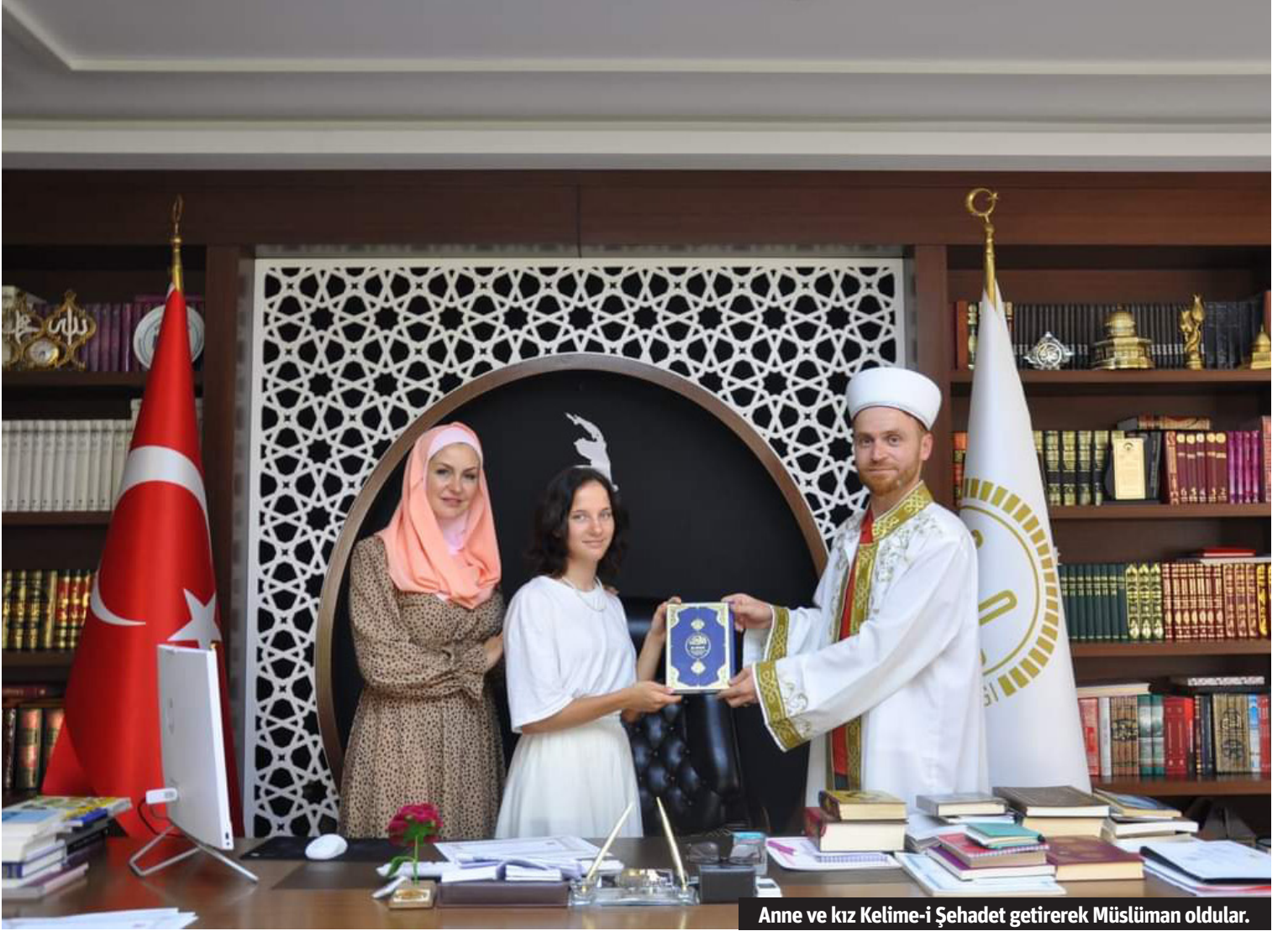
Anne ve kız Kelime-i Şehadet getirerek Müslüman oldular.