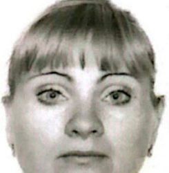
Motosikletin çarptığı Kornutiak hastanede yaşamını yitirdi.

Alanya'da Ukrayna uyruklu kadına yaya geçinden karşıya geçmeye çalışırken, motosiklet çarptı. Motosiklet sürücüsü ve Ukraynalı kadın kaldırıldığı hastanede hayatını kaybetti.