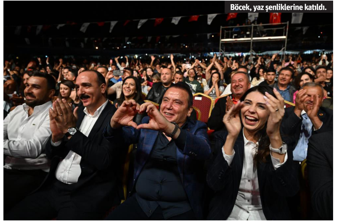
Böcek, yaz şenliklerine katıldı.

kardeşimle iş birliği içerisinde bu yaz şenliklerini düzenledik. Emegi geçen çalışma arkadaşlarıma,