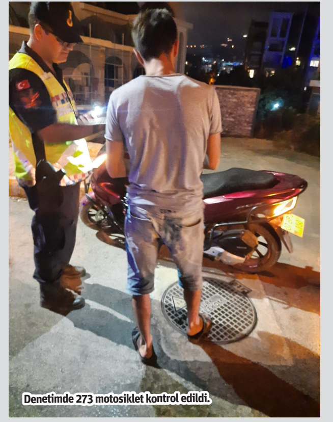
Denetimde 273 motosiklet kontrol edildi.

ardından ambulansla hastaneye kaldırıldı. Kazanın ardından, trafik polisinin kazanın nasıl yaşandığını sorması üzerine 34 HCP 584 plakalı otomobil sürücüsü Oğuzhan Avcı, diğer aracın sağ şeritten gelip sol tarafa dönmek için önüne kırdığını, frene basmasına rağmen elinden bir şey gelmediğini söyledi. Diğer aracın sürücüsü Basri Eryıldız ise, sol şeritten gelip sinyali vererek dönmeye hazırlandığı sırada arkasından hızla gelen aracın önce aydınlatma direğine ardından da kendi aracına çarpıp refüjden karşı şeride attığını söyledi. Kaza sırasında devrilen aydınlatma direği ise trafikteki bazı araçların hasar görmesine neden oldu. - İHA