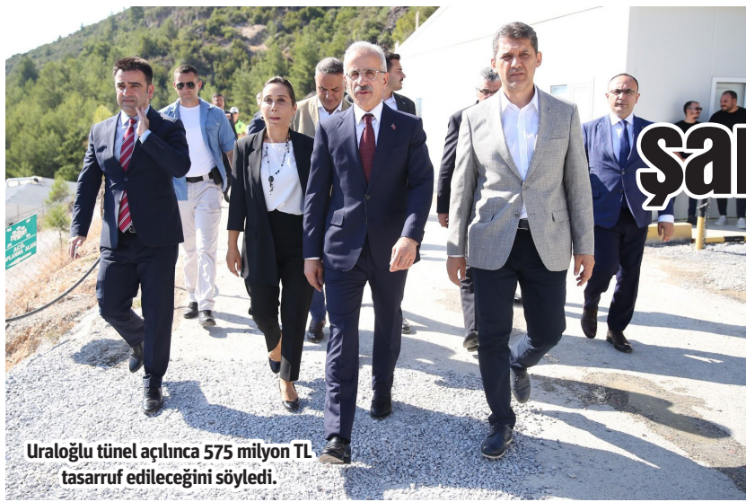
Uraloğlu tüneli açılına 575 milyon TL tasarruf edileceğini söyledi.