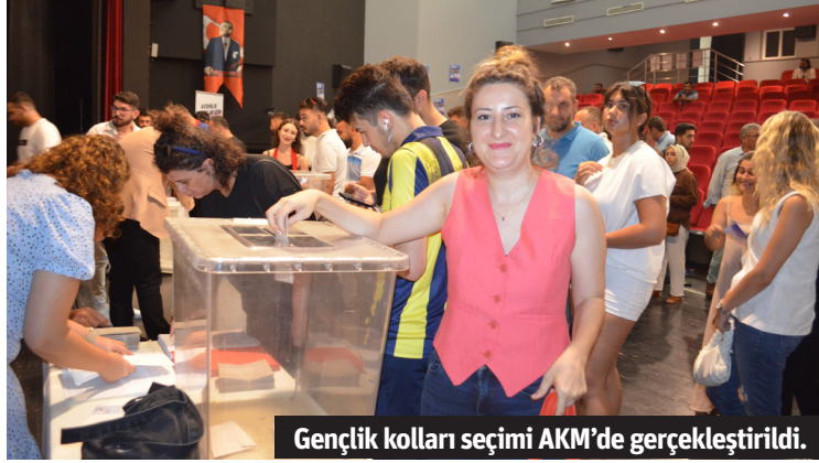
Gençlik kolları seçimi AKM'de gerçekleştirildi.