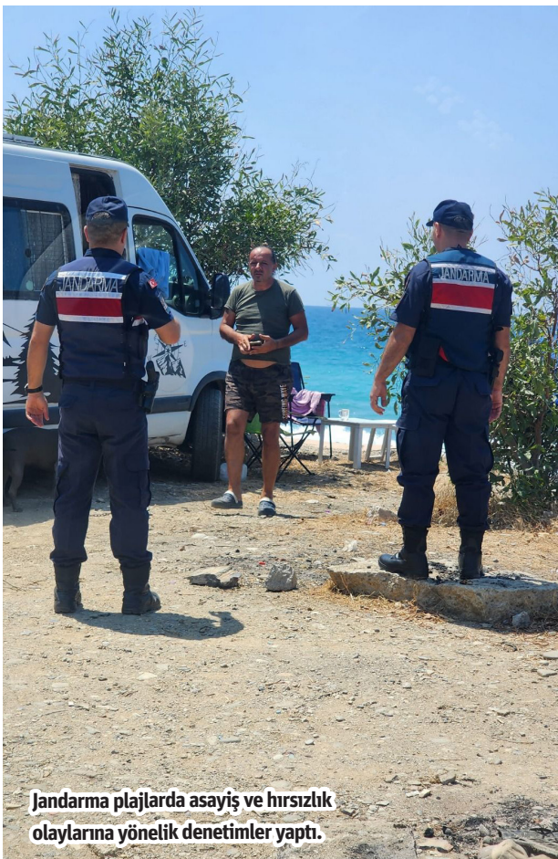
Jandarma plajlarda asayiş ve hırsızlık olaylarına yönelik denetimler yaptı.

ALANYA İlçe Jandarma Komutanlığı sahil şeridi ve plajlarda asayiş ve hırsızlık olaylarına yönelik denetimleri sıkılaştırdı. Alanya İlçe Jandarma Komutanlığı tarafından önceki gün Demirtaş, Keşefli, Yeşilöz ve Uğrak mahalleleri ile Aydap Haraberler Mevkii'nde bulunan sahil şeridi ve plajlarda asayiş ve hırsızlık olaylarına yönelik denetimler yapıldı. Denetimlerde; Demirtaş, Keşefli, Yeşilöz ve Uğrak mahalleleri ile Aydap Haraberler Mevkii'nde bulunan sahil şeridi ve plajlarda, hırsızlık ve otodan hırsızlık olaylarına karşı şüpheli şahıs ve çevre kontrolleri yapılmış olumsuz bir durum ile karşılaşmadığı bildirildi. - Alanya Kaymakamlığı / Bülten