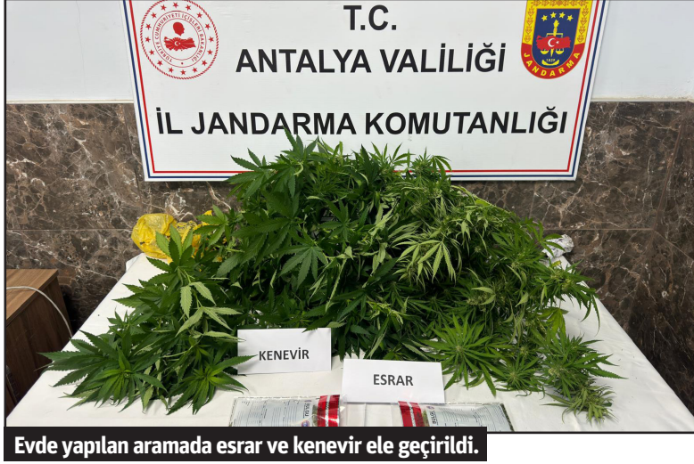
Evde yapılan aramada esrar ve kenevir ele geçirildi.

Alanya'da iki kişinin evinin bahçesinde jandarma tarafından 7 kök Hint keneviri ele geçirildi. Olayla ilgili gözaltına alınan 2 şüpheli serbest bırakıldı.