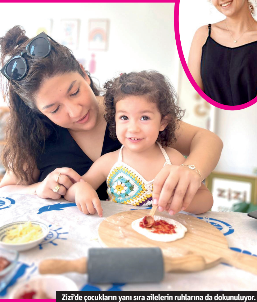
Zizi'de çocukların yanı sıra ailelerin ruhlarına da dokunuluyor.