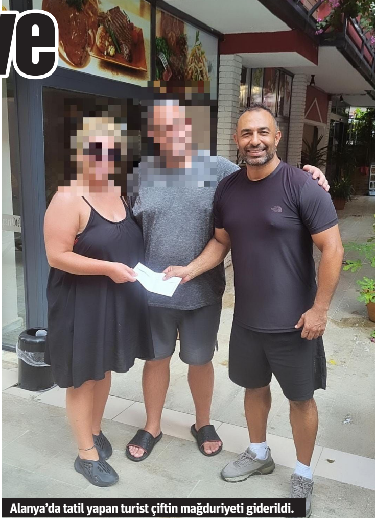
Alanya'da tatil yapan turist çiftin mağduriyeti giderildi.

ALANYA'DA bir otelde konaklayan ve bir tur acentesinden kanyon turu satın alan turist çift, otellerini değiştirdikleri için tura farklı bir otelden katılacaklarını firmaya bildirdi. Ancak buna rağmen tura alınmadıklarını, hiçbir şekilde kendileriyle iletişime geçilmediğini belirten çift, ödedikleri paraları iade edilmediği konusunda da şikayette bulundular. Şikayet üzerine harekete geçen ve Alanya'da tatil yapan çiftte ulaşan Alanya Turizm Tamtama Vakfı (ALTAV) ve Türkiye Seyahat Acenteleri Birliği (TÜRSAB) Alanya Bölge Temsil Kurulu (BTK) Yönetim Kurulu üyeleri sorunu hızlı şekilde çözüme kavuşturdu.