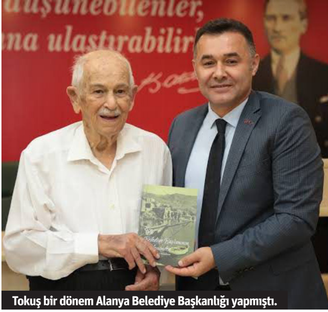
Tokuş bir dönem Alanya Belediye Başkanlığı yapmıştı.