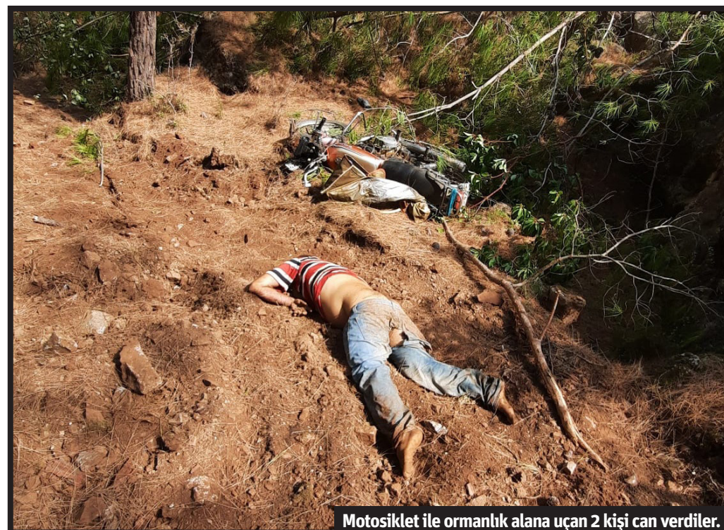
Motosiklet ile ormanlık alana uçan 2 kişi can verdiler.