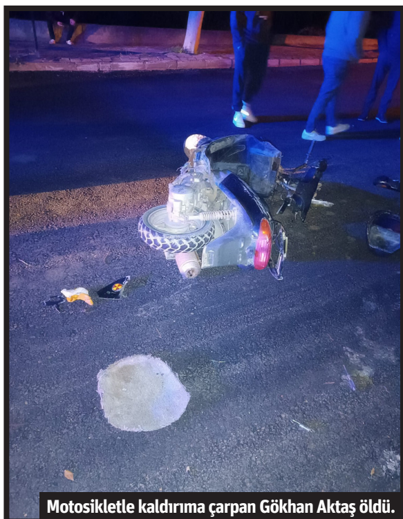
Motosikletle kaldırırma çarpan Gökhan Aktaş öldü.