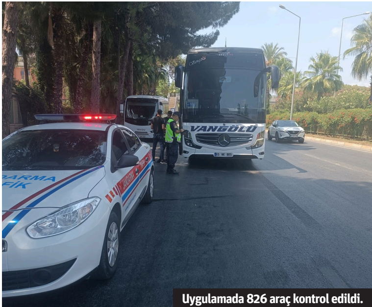
Uygulamada 826 araç kontrol edildi.

Başkanı olan, Alaaddin Beach Otel sahibi Tokuş, Alanya Hamdullah Emin Paşa Koleji'ni kuran ekibin de başındaydı. Tokuş'un cenazesi öğle namazına müteakip Gürses Camii'nde kılınan cenaze namazının ardından Bektaş Aile Mezarlığı'na defnedildi. - Gülşah Ataoglu