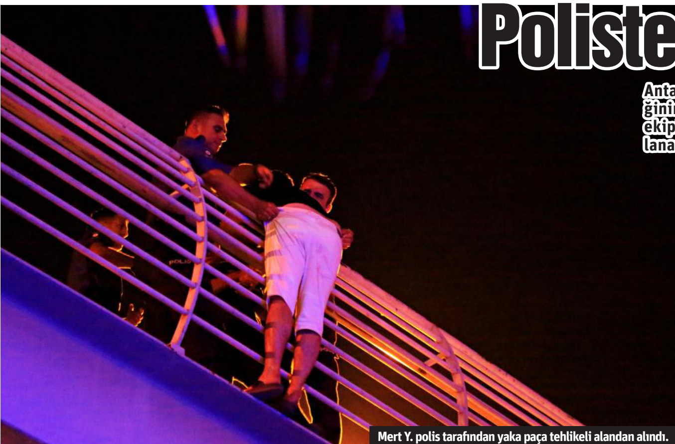
Mert Y. polis tarafından yaka paça tehlikeli alandan alındı.

Antalya'da ailevi nedenlerden ötürü bunalıma giren bir genç, araç trafiğinin en yoğun olduğu Gazi Bulvarı'nda bulunan üst geçide çıktı. Polis ekiplerinin telefon vermesinin ardından bir anlık dalgınlığından faydalanarak yakaladığı şahıs, kelepçelenerek polis merkezine götürüldü.