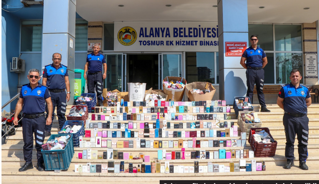
Sahte parfümler iş makinesi vasıtasıyla imha edildi.

ALANYA Belediyesi, özellikle yaz sezonunda artan seyyar satıcı faaliyetlerine karşı kapsamlı denetimler gerçekleştiriyor. Denetimlerini sıkılaştıran ekipler, halk sağlığını tehdit eden, merdiven altı üretilen binlerce şişe parfüme el koydu. Söz konusu çalışmalar sırasında, kaçak ve sahte parfüm sattığı tespit edilen çok sayıda işletme ve seyyar satıcıya müdahale edildi. Halk sağlığını tehdit eden ve ekonomik açıdan haksız rekabete yol açan sahte ürünlere karşı yürütülen mücadele sonucunda seyyar satıcılardan toplanan 7 bin 857 şişe parfümün, Alanya Belediyesi Tosmur Ek Hizmet Binası önünde sergilenmesinin ardından iş makinesi vasıtasıyla imha edildi. Ünlü markaların isimlerinin kullanılarak satışı yapılan sahte parfümlerin orijinal şişe ve kutuların birebir aynıyla ambalajlandığı gözlemlenirken, bu tür ürünlerin ciddi anlamda sağlık riskleri taşıdığına dikkat çekildi. Denetimlerin aralıksız devam ettiğini