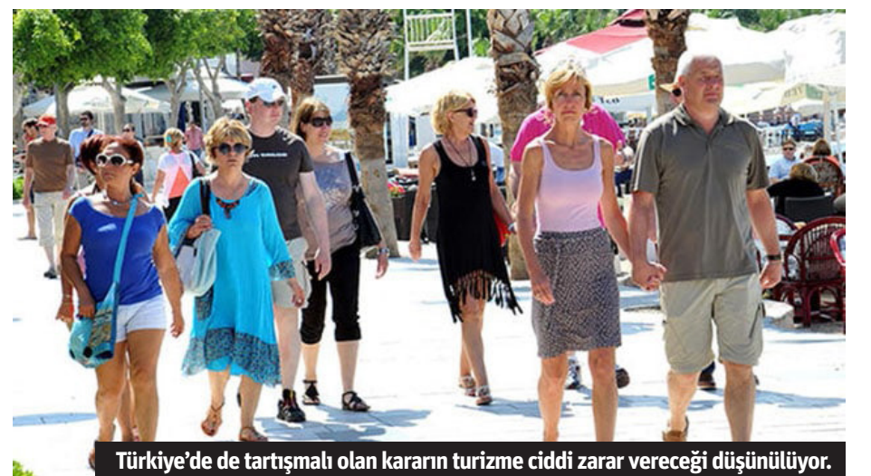
Türkiye'de de tartışmalı olan kararın turizme ciddi zarar vereceği düşünülüyor.

jının altını oyduğu Türkiye'de siyasetçilerin, başka bir destinasyona gitmek için bize yeni bir neden vermemeleri gerekir. Türkiye'de sokakta yaşayan 4 milyon köpek elbette bir sorun ve bunun ne onları bir sorun olarak gören yerel halka ne de onların acı çekmesinden izdirap duyan turistlere bir faydası var. Cumhurbaşkanı Erdoğan bu yıl, tüm sokak köpeklerinin yakalanması 30 gün içinde sahiplenilmeyenlerin öldürüleceği radikal bir çözüm çağrısı yaptı. 'ANCAK TÜM BARINAKLAR ZATEN DOLU' Türkiye Büyük Millet Meclisinde, saldırgan ve hasta olanların itlaf edilmesi, geri kalanların ise barınaklarda tutulması şeklinde, sulandırılmış olsa da, bir yasa onaylandı. Ancak şu anda mevcut tüm barınaklar tamamen dolu durumda ve milyonlarcasının nereye konacağı bilinmiyor. Hayvan hakları aktivistleri, orada birçoğunun öldürüleceği görüşünde.