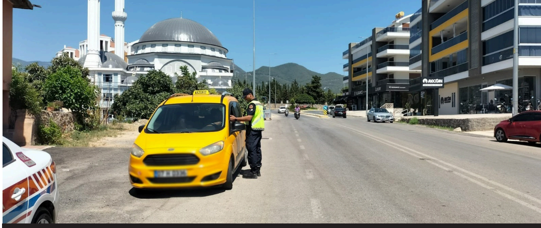
Denetimlerde toplam 4 milyon 778 bin 19 TL cezai işlem ve 80 gün ticari faaliyetten men cezası uygulandı.

ALANYA'NIN huzur ve güvenliği için kaymakamlık denetim ekipleri olarak 1 Haziran-1 Ağustos tarihleri arasında yapılan denetimlerde 2 bin 230 işletme kontrol edilerek turizmi olumsuz etkileyen faktörlerle mücadele kapsamında yazılı uyarda bulunuldu. Denetimlerde işletme dışından görülecek şekilde alkollü içecekleri iş yeri dışında görülecek şekilde satışa arz ettiği tespit edilen 3 işletmeye 180 bin TL cezai işlem uygulandı. Hanuççuluk yaptığı tespit edilen 15 işletmeye toplamda 80 gün süre ile ticari faaliyetten men edilerek ayrıca faaliyeti gerçekleştiren kişiye toplamda 30 bin 780 TL cezai işlem uygulandı. ALKOL SATIŞINA UYMAYANLARA 4 MİLYON TL CEZA