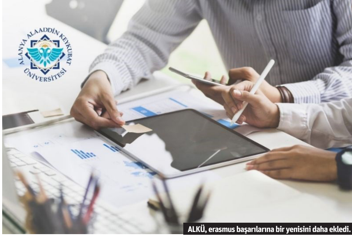
ALKÜ, erasmus başarılarına bir yenisini daha ekledi.

ALANYA Alaaddin Keykubat Üniversitesi (ALKÜ), akademik ve proje başarılarına her geçen gün yenisini eklemeye devam ediyor. ALKÜ, Erasmus KA131 bütçelerinin ardından açıklanan Erasmus KA171 bütçeleri ile büyük bir başarı elde etti. Buna göre, KA171 projesi kabul edilen ALKÜ, bütçesini 43 bin euro daha artırarak toplamda 198 bin 858 euroya ulaştı. ALKÜ, bütçe sıralamasında bir önceki yıla göre 5 sıra yükselerek 14. sıradan 9. sıraya çıktı. ALKÜ, KA171 projesi kapsamında bütçe almaya hak kazanan 117 kurum arasında en çok bütçe alan 9. kurum oldu. KA171 projeleri kapsamında ilk 10 üniversite içinde yer alan ALKÜ; ODTÜ, Hacettepe ve Marmara gibi köklü üniversitelerle birlikte sıralamada yer alarak Erasmus+ projelerindeki etkinliğini ve uluslararası alandaki prestijini bir kez daha kanıtladı. Öte yandan Gürcistan da ALKÜ'nün ortakları arasına eklendi. K131 PROJESİNDE DE BAŞARILAR ARKA ARKAYA GELMİŞTİ ALKÜ'de Erasmus Koordinatörlüğü tarafından yürütülen KA131 projesinde de başarıları ikiye katlanmıştı. ALKÜ Erasmus Koordinatörlüğü'nün 2023 yılında 88 bin 250 euro olan KA131 bütçesi, yüzde 92,63 oranında artırılarak 170 bin euroya yükseltildi. KA171 bütçe sıralamasında 108 üniversite arasında 14. sırada olan ALKÜ, Erasmus KA131 bütçeleri sıralamasında Türkiye genelindeki 207 üniversite arasında 22 sıra yükselerek 81. sıraya yerleşti. ALKÜ, bu başarıyla KA131 projesinde bütçesini ikiye katladı.