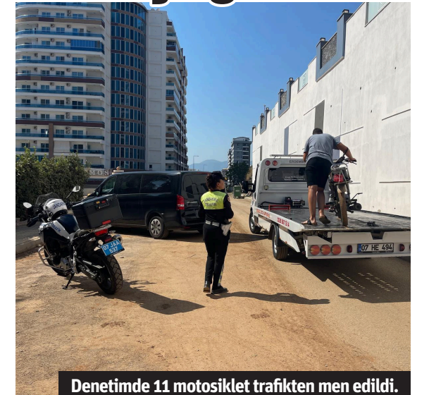
Denetimde 11 motosiklet trafikten men edildi.

ALANYA İlçe Jandarma Komutanlığı tarafından Kestel-Mahmutlar ve Kargıcak mahallelerinde motosiklet sürücülerine yönelik trafik uygulaması yapıldı. Yapılan uygulamada 198 motosiklet kontrol edildi. Denetimde 30 motosiklet sürücüsüne 144 bin 779 TL cezai işlem uygulanarak 11 motosiklet trafikten men edildi. Denetimde 1 araç yakalandı. - Alanya Kaymakamlığı / Bülten