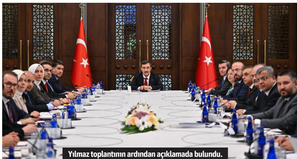
Yılmaz toplantısının ardından açıklamada bulundu.

Cumhurbaşkanı Yardımcısı Cevdet Yılmaz, "e-Devlet Kapısı kullanıcıları kira kontratlarını yıl sonuna kadar e-Devlet Kapısı üzerinden yapabilecekler" dedi. "Dijital Türkiye ve Bürokrasinin Azaltılması Toplantısı"nda konuşan Yılmaz, "e-Devlet Kapısı kullanıcıları kira kontratlarını yıl sonuna kadar e-Devlet Kapısı üzerinden yapabilecekler. 'Özel sigortalarım' bütünlük hizmetinin kademeli olarak geliştirilmesi ile kullanıcılar tüm polise bilgilerine tek nokta üzerinden erişim sağlayabilecek ve işlemlerini gerçekleştire-