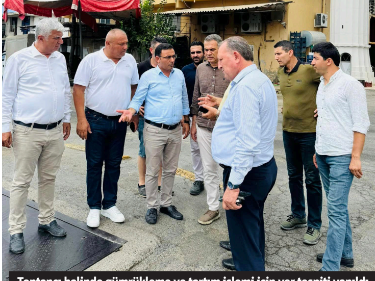
Toptancı halinde gümrükleme ve tartım işlemi için yer tespiti yapıldı.