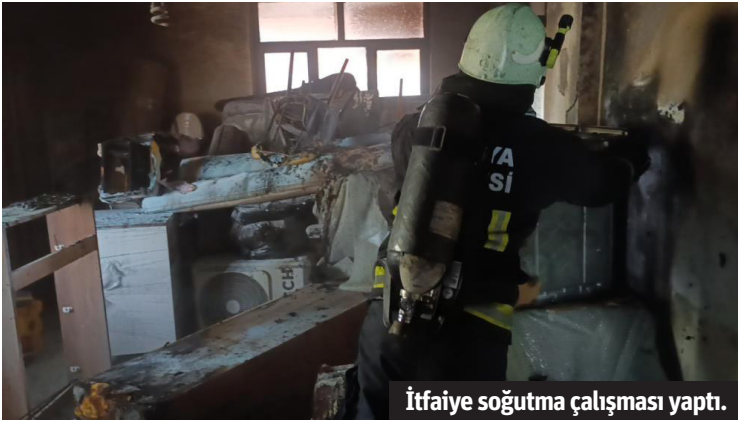
İtfaiye soğutma çalışması yaptı.

MANAVGAT'TA bir iş yerinin deposunda çıkan yangına ilk müdahaleyi vatandaşlar hortumlarla yaparken depoda bulunan ev eşyaları büyük ölçüde zarar gördü. Olay, Manavgat'ın Dikmen Mahallesi, Nardibi Kümeevler Mevkii'nde bulunan bir işyerinde meydana geldi. İşletmenin depo olarak kullanılan bölümünde çıkan yangın korku dolu anların yaşanmasına neden oldu. Depodan dumanların çıktığını gören vatandaşlar 112 Acil