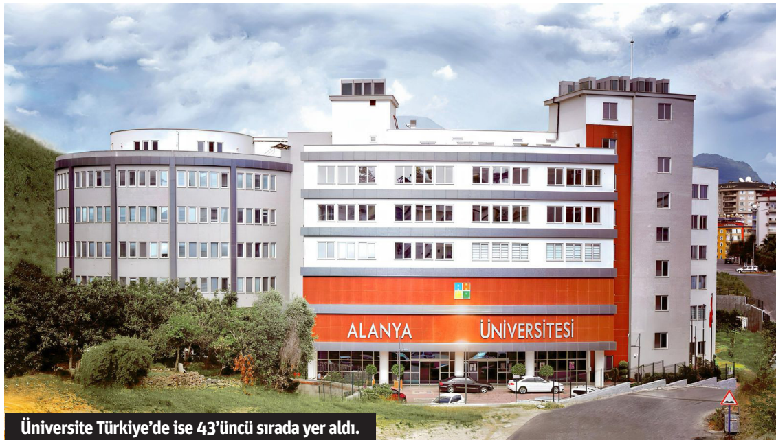
Üniversite Türkiye'de ise 43'üncü sırada yer aldı.

Mali sürdürülebilirlik açısından da değer-