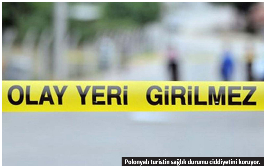
Polonyalı turistin sağlık durumu ciddiyetini koruyor.

Alanya'da tatil yaptığı otelde balkondan düşen 32 yaşındaki Polonyalı turist ağır yaralandı.