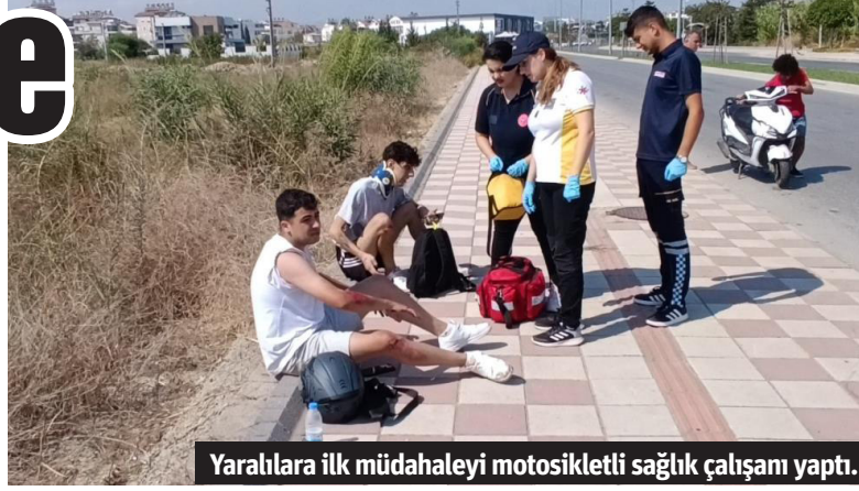
Yaralılara ilk müdahaleyi motosikletli sağlık çalışanı yaptı.