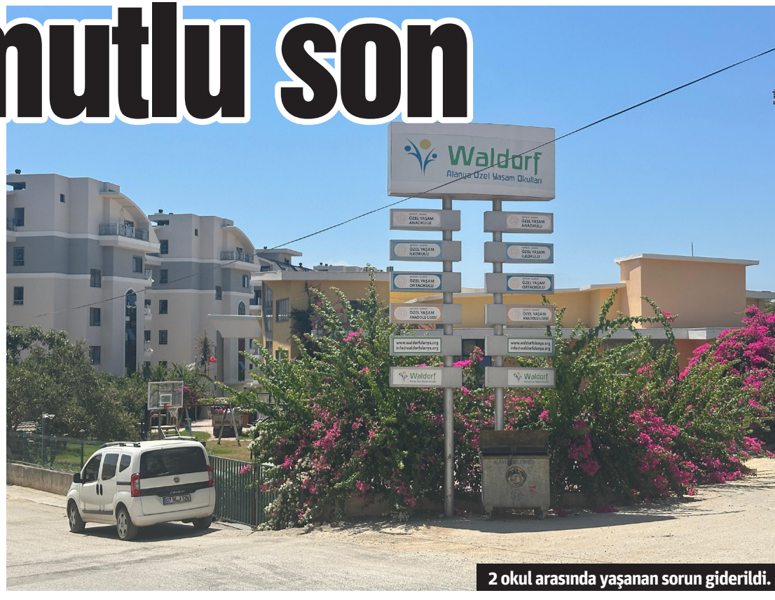
2 okul arasında yaşanan sorun giderildi.