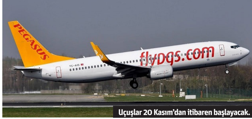
Uçuşlar 20 Kasım'dan itibaren başlayacak.

en popüler turistik noktalardan biri. 49,99 Euro'dan başlayan fiyatlarla flypgs.com veya Pegasus Mobil uygulamamızdan biletinizi hemen alarak, Kahire'nin gizemini keşfetmeye başlayabilirsiniz!" ifadelerine yer verdi. (Kaynak: Turizm Ajansı)