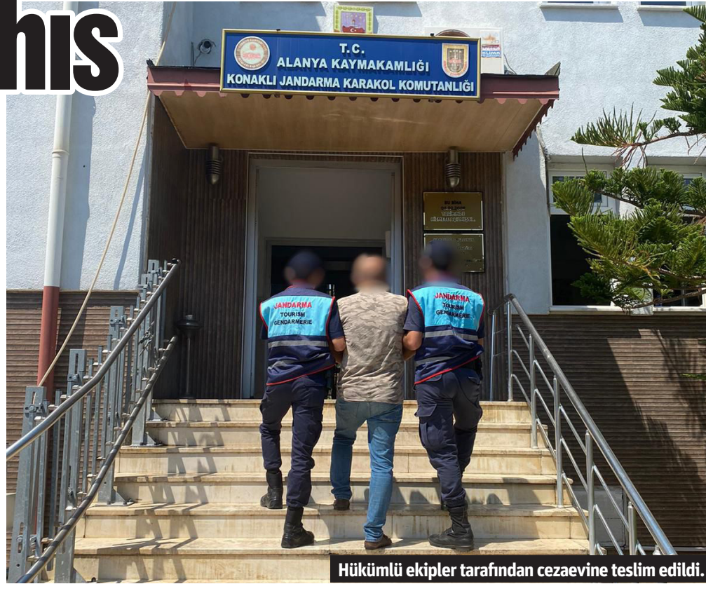
Hükümlü ekipler tarafından cezaevine teslim edildi.

ALANYA İlçe jandarma Komutanlığı Jandarma Suç Araştırma Timi'nin (JASAT) arananların yakalanmasına yönelik çalışmaları kapsamında ekipler, hakkında silahla yağma suçundan kesinleşmiş hapis cezası olan A.T'yi (48) ikametinde yakaladı. Hükümlü, karakoldaki işlemlerinin ardından cezaevine teslim edildi. (Mehmet AL)