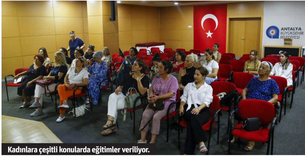
Kadınlara çeşitli konularda eğitimler veriliyor.

HEDEF DAHA GÜÇLÜ KADINLAR Kadın ve Aile Hizmetleri eğitimcilerinin hazırladığı sunumlar ve güçlü anlatımlarla desteklenen eğitimlere