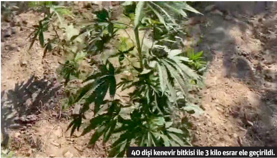
40 dişi kenevir bitkisi ile 3 kilo esrar ele geçirildi.

Alanya'da yasa dışı kenevir ekimi yapan 2 şahıs jandarma ekipleri tarafından yakalandı.