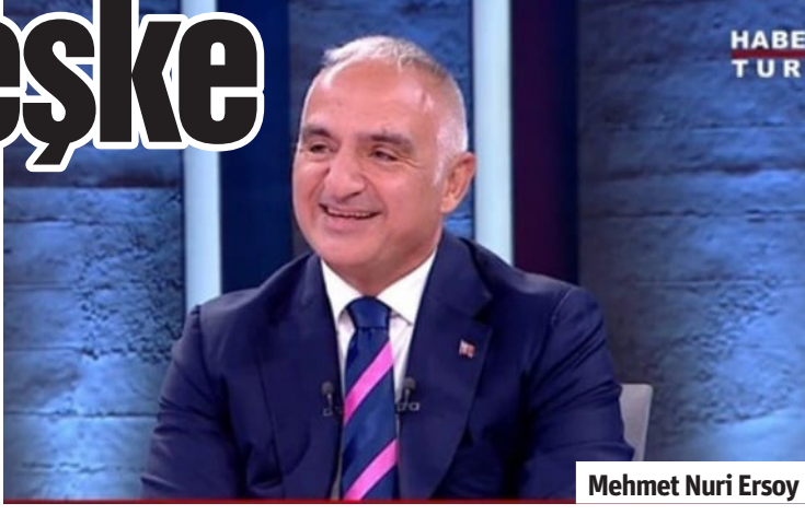
Mehmet Nuri Ersoy

reler tarafından seçim döneminde bunu siyasi muhalefet aracı olarak kullandılar. İrkçilik seviyesinde yapıldı. Bu hoş olmadı." 'AVRUPA'NIN BİRÇOK ÜLKESİNDEN DAHA İYİYİZ' Türkiye'nin turizm gelirinde Avrupa'nın birçok ülkesinden daha iyi durumda olduğunu ileri süren Ersoy turist başına gecelik harcamayla ilgili olarak ise "80 dolardan devralmışız 109 dolara yükselen gecelik gelir var. Şu anda birçok ülkeden daha iyi kişi başı gecelik gelir alıyoruz. Avrupa'daki birçok ülkeden daha iyiyiz." değerlendirmesini yaptı. (Kaynak: TurizmGüncel)