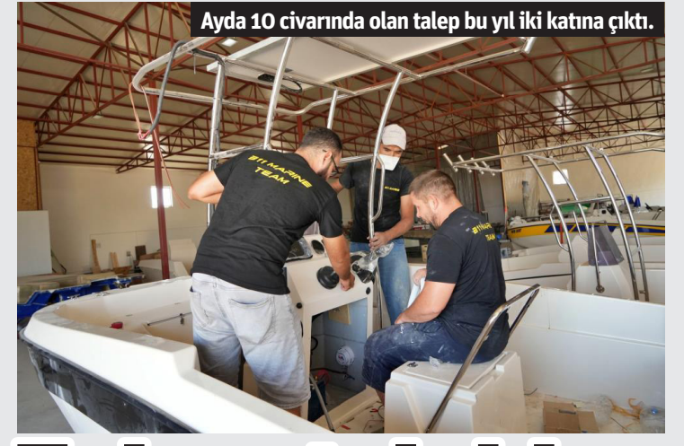
Ayda 10 civarında olan talep bu yıl iki katına çıktı.

DI" Samancı; arı zehrinin selülitlere doğal çare olabileceğine değinerek geliştirdiği formülü şu sözlerle anlattı: "Kadınların en sık karşılaştığı cilt problemlerinden biri olan selülit ile mücadelede, tamamen doğal bir selülit karşıtı sıkılaştırıcı jel formülü geliştirdik. Bu formülde, sarkık, çatlak ve selülit görünümünün azalmasına doğal olarak destek olmak için arı zehrinden faydalandık. Arı zehri ile birlikte, patentli saf Anadolu propolisini (A.P.E), kahve çekirdeği ekstraktı, hyaluronik asit ve aloe vera gibi cilt güzelliğini destekleyecek doğal bileşenler de yer alıyor. 4 hafta düzenli kullanımda cildin esnekliğini artırarak kalça, basen, bacak ve karın bölgesinin sıkışmasına ve incelmesine yardımcı olduğu 20 gönüllü ile gerçekleştirilen dermatolojik test ile ispatlanan formül, hassas ciltler için de uygun. Selülit problemleriyle doğal yollarla mücadele etmek üzere, etkinliği araştırılmış ve ispatlanmış arı zehri formüllerden gönül rahatlığıyla yararlanabilirsiniz." - İHA