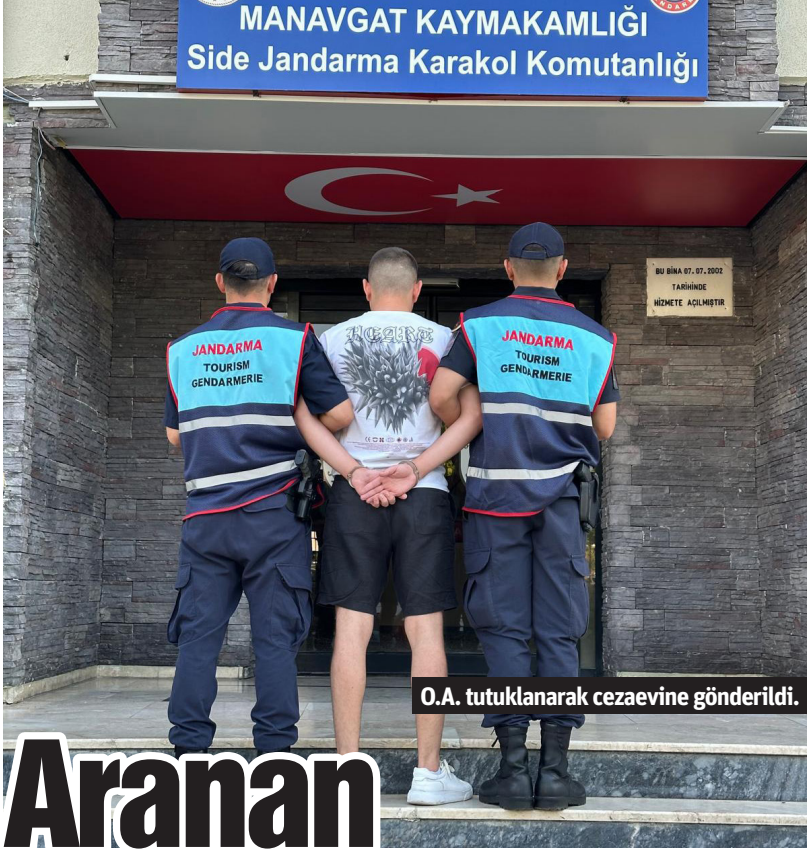
MANAVGAT KAYMAKAMLIĞI Side Jandarma Karakol Komutanlığı

GÖRÜNTÜLER hafta sonu sabah saatlerinde bir vatandaş tarafından cep telefonu kamerası ile kaydedildi. Hemen hemen her sezon ölümlü ya da yaralanmalı kazaların yaşandığı safari turlarına katılanlar ekiplerin denetimlerini artırmalarına rağmen kurallara uymamaya devam ediyor. Sabah saatlerinde gerçekleşen safari turunda araçtan sarkan yolcu kazaya davetiye çıkardı. Tepki çeken görüntülerin ardından vatandaşlar yetkililerden konuyla ilgili çözüm bulmalarını istedi. - Mehmet AL