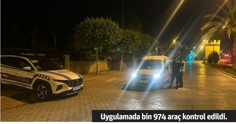
Uygulamada bin 974 araç kontrol edildi.

ALANYA İlçe Jandarma Komutanlığı tarafından genel trafik uygulaması yapıldı. Yapılan uygulamada bin 974 araç kontrol edilerek 161 araca 472