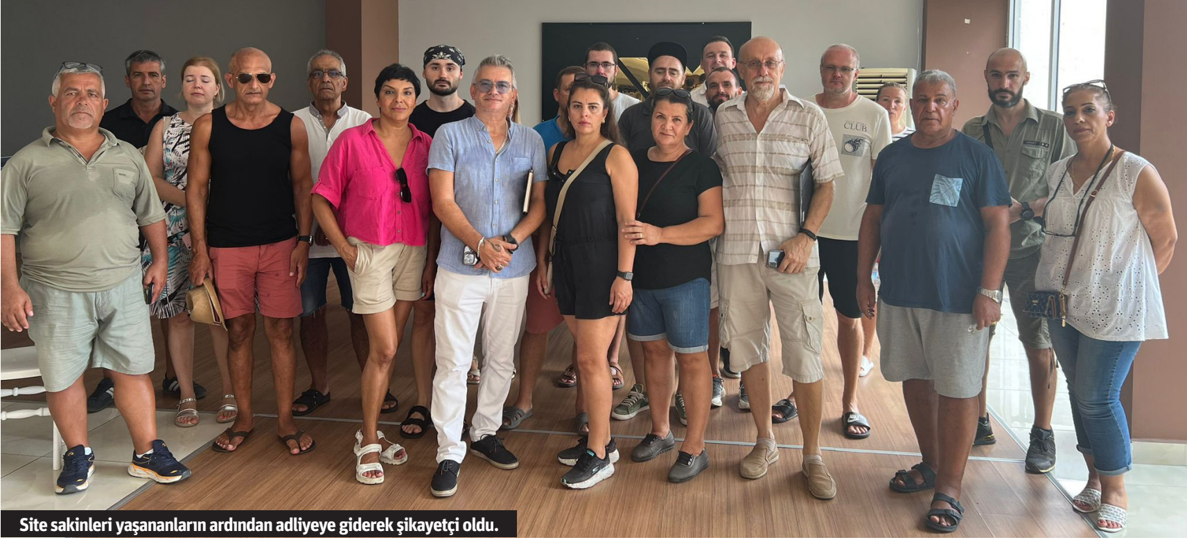
Site sakinleri yaşananların ardından adliyeye giderek şikayetçi oldu.

Alanya'da daha önce de birçok kez gündeme gelen 280 dairelik Another World Sitesi'nde gerçekleştirilen site yönetimi seçimi yine olaylı geçti.