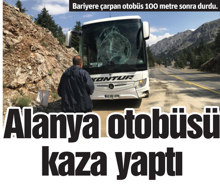
Bariyere çarpan otobüs 100 metre sonra durdu.