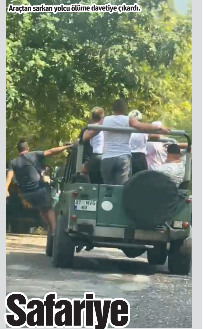
Araçtan sarkan yolcu ölümüne davetiye çıkardı.

uçmasını önleyerek, kaza ucuz atlatıldı. Kazada yaralanan olmazken, otobüsün ön camı patladı ve sağ kaportasında hasar meydana geldi. Otobüsün Alanya'dan aldığı 41 yolcu ile Konya'ya gittiği öğrenildi. Kaza yerine firma tarafından gönderilen başka bir otobüsle yolcular yollarına devam ederken, otobüs şoförü ise ifadesi alınmak üzere jandarma tarafından Akseki İlçe Jandarma Komutanlığı'na götürüldü. Kazayla ilgili inceleme başlatıldı. - İHA