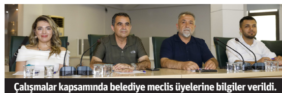
Çalışmalar kapsamında belediye meclis üyelerine bilgiler verildi.

ANA GÜNDEM MADDELERİ BELİRLENİYOR Stratejik planın ana temaları arasında çevre koruma, sürdürülebilir turizm, altyapı geliştirme, sosyal hizmetlerin iyileştirilmesi ve dijital dönüşüm yer alıyor. Özellikle iklim değişikliği ve çevresel sürdürülebilirlik konularına büyük önem veriliyor. Buna göre Alanya'nın yeşil alanlarının korunması ve artırılması, yenilenebilir enerji kaynaklarının kullanımı gibi projeler öne çıkıyor. DETAYLI RAPORLAR VE ANALİZLER HAZIRLANIYOR Alanya Belediyesi, uzmanlar ve akademisyenler tarafından oluşturulan alt komisyonlar aracılığıyla detaylı analiz-