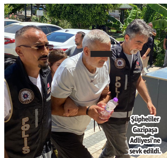
Şüpheliler Gazipaşa Adliyesi'ne sevk edildi.

tarafından soruşturma başlatılmıştı. Soruşturma kapsamında gerekli araştırmalar yapılarak, ilgili şahısların ifadelerine başvurularak suç teşkil eden tüm eylemler tespit edilmişti. Gazipaşa Cumhuriyet Başsavcılığı'nca "Suç İşlemek Amacıyla Örgüt Kurma, Rüşvet Almak, Rüşvet Vermek, Resmi Belgede Sahtecilik ve Görevi Kötüye Kullanma" suçlarına yönelik yürütülen