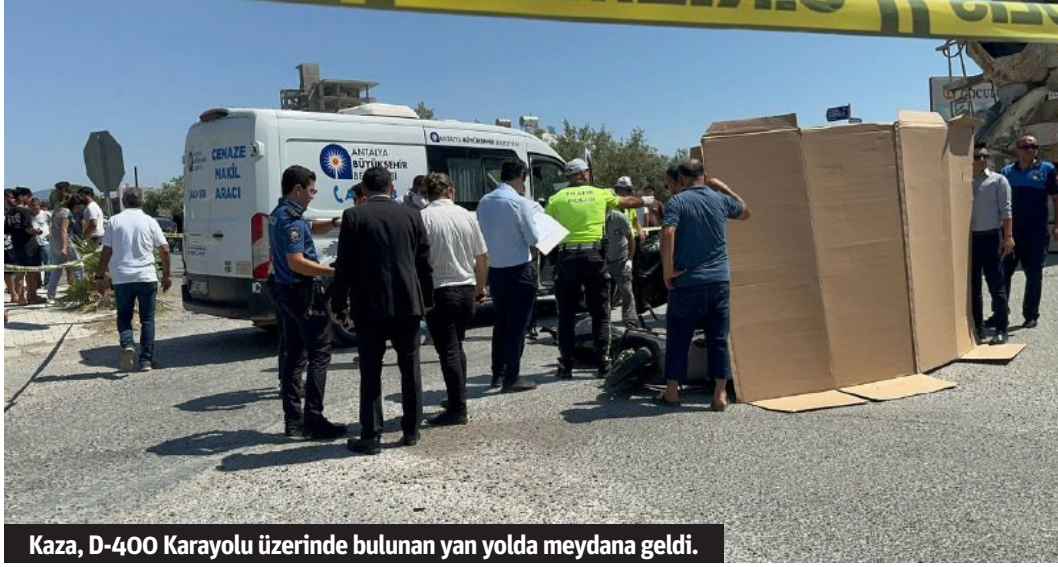
Kaza, D-400 Karayolu üzerinde bulunan yan yolda meydana geldi.