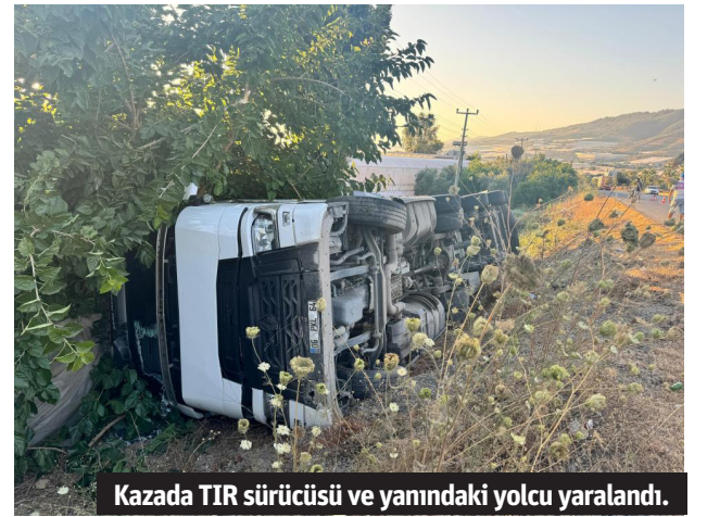
Kazada TIR sürücüsü ve yanındaki yolcu yaralandı.