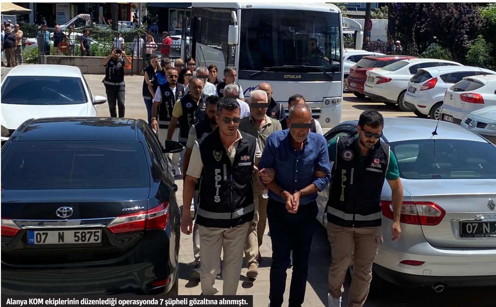
Alanya KOM ekiplerinin düzenlediği operasyonda 7 şüpheli gözaltına alındı.

Alanya KOM Grup Amirliği tarafından düzenlenen operasyon ile gözaltına alınan Gazipaşa eski Tapu Müdürü Z.Ç. ile 3'ü kadın toplam 7 kişi adliyeye sevk edilerek hakim karşısına çıktı.