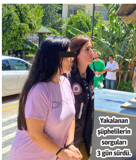
Yakalanan şüphelilerin sorguları 3 gün sürdü.