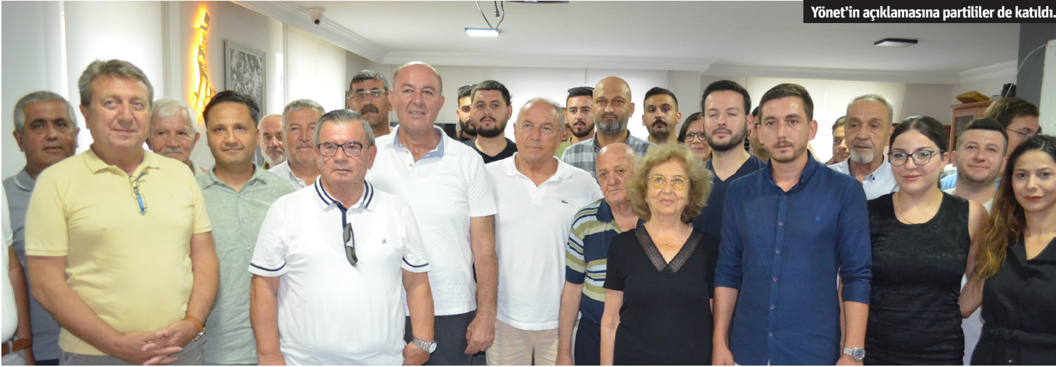
Yönet'in açıklamasına partililer de katıldı.