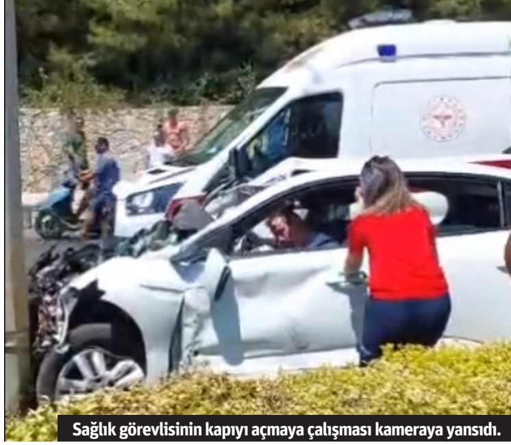
Sağlık görevlisinin kapıyı açmaya çalışması kameralara yansdı.