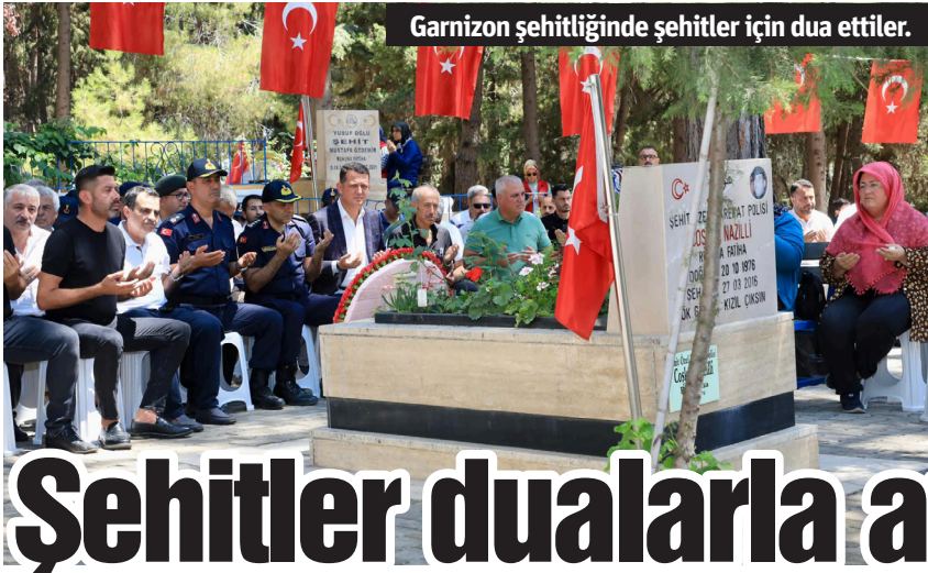
Garnizon şehitliğinde şehitler için dua ettiler.