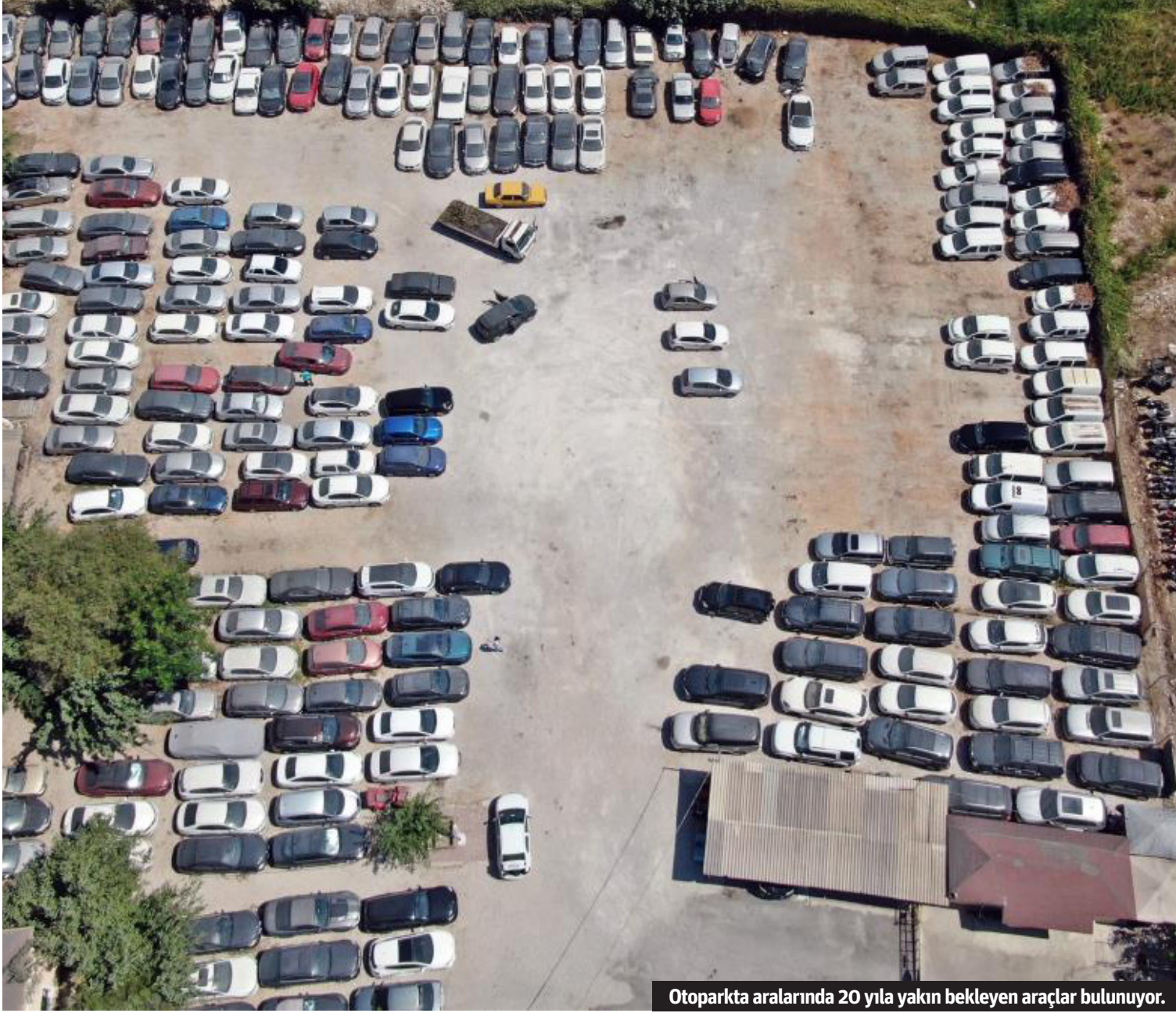
Otoparkta aralarında 20 yıla yakın bekleyen araçlar bulunuyor.

Antalya'da çoğunluğu haciz yoluyla bağlanan araçlar yediemin otoparklarında yıllardır bekliyor. Aralarında 20 yıla yakın bekleyen araçların da bulunduğu otoparkta 33 milyon TL değerinde lüks araçlar da yer alıyor.