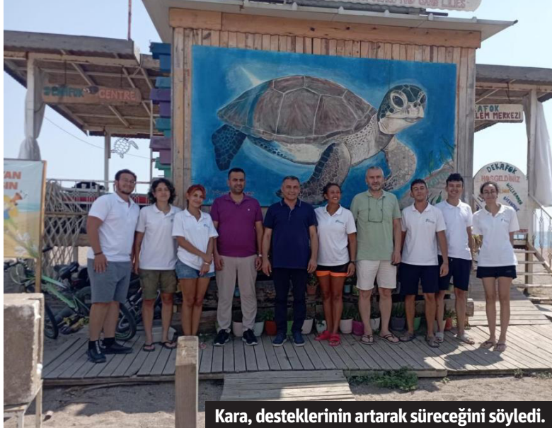
Kara, desteklerinin artarak süreceğini söyledi.

AKDENİZİN en sevimli ve nadir canlılarından olan caretta caretta, Manavgat kıyılarında güvenli bir şekilde yaşamlarını sürdürebilmek için belediyenin ve gönüllü çevre örgütlerinin çabalarıyla koruma altına alınıyor. Manavgat Belediyesi'nin öncülüğünde yürütülen koruma çalışmaları, deniz kaplumbağalarının yumurtlama alanlarının belirlenmesi, korunması ve izlenmesi gibi çeşitli faaliyetleri kapsıyor. Belediye, bilim insanları ve çevre gönüllüleriyle iş birliği yaparak, sahil şeridindeki kaplumbağa yuvalarını tespit ediyor ve bu alanları koruma altına alıyor. Yumurtlama dönemlerinde, yuvaların çevresinde dikkat çekici işaretler yerleştirilerek, insanların bu bölgelere girmemesi sağlanıyor. Bunun yanı sıra, kumsallarda yapılan temizlik çalışmaları