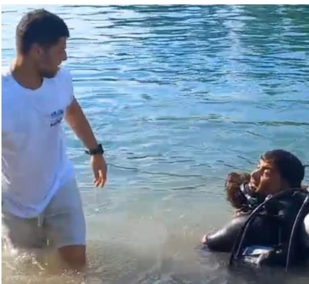
Dalgıçlar Yağz'ın cesedini bulmak için bölgede arama yaptı.

Manavgat'ta arkadaşları ile birlikte serinlemek için ırmağa giren genç, boğularak hayatını kaybetti.