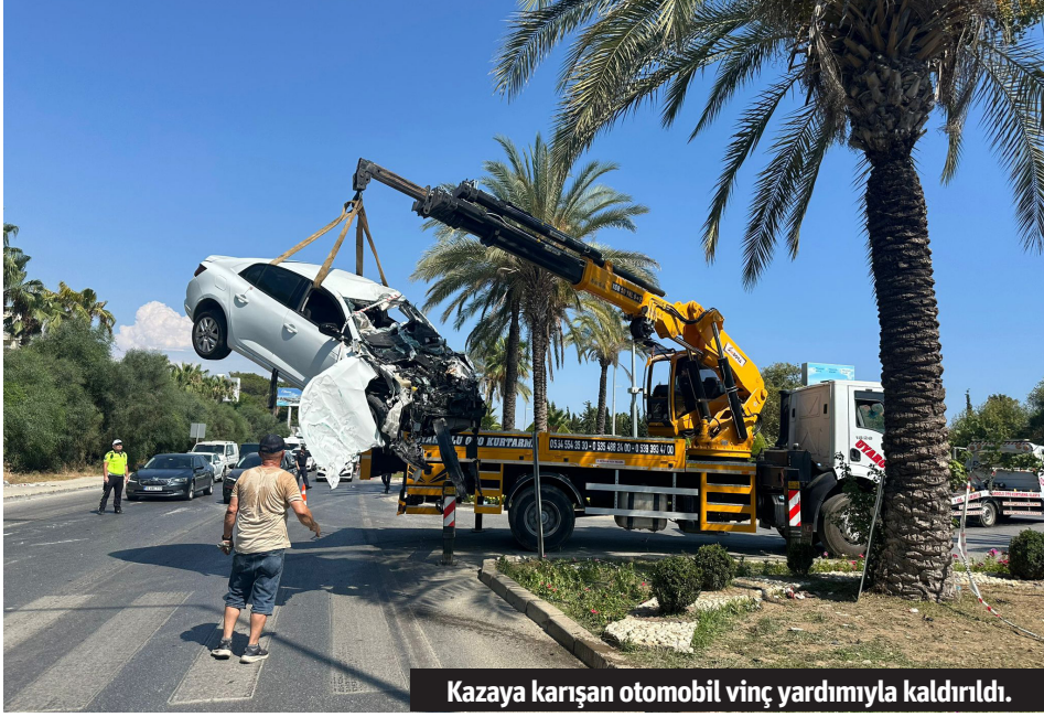
Kazaya karışan otomobil vinç yardımıyla kaldırıldı.

Alanya'da meydana gelen trafik kazasında 2'si ağır, 6 kişi yaralandı. Kazada araçta sıkışan yaralıyı gören kadın sağlık çalışanının kapıyı açmaya çalışması kameralara yansdı.