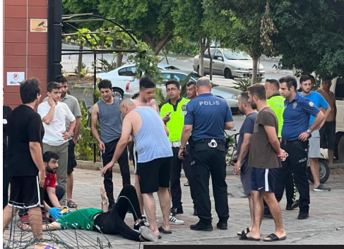
Kazada 2 kişi yaralandılar.