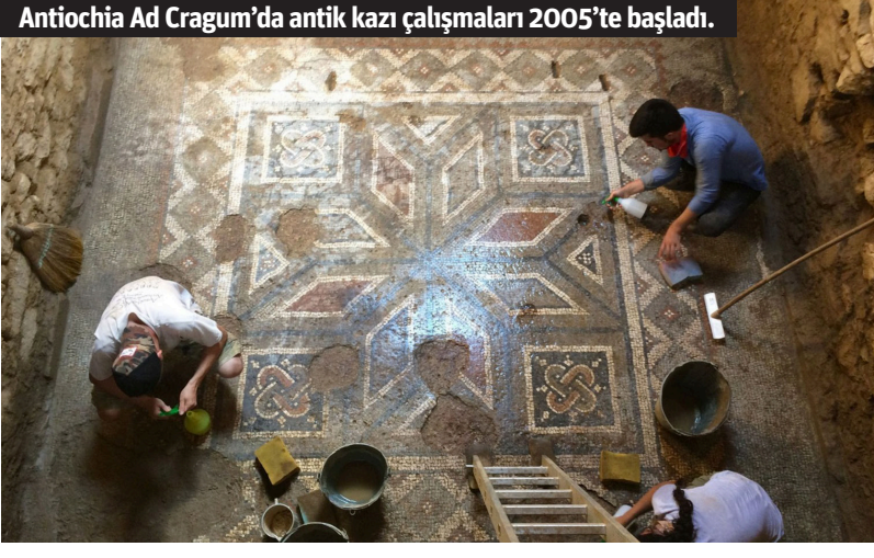
Antiochia Ad Cragum'da antik kazı çalışmaları 2005'te başladı.