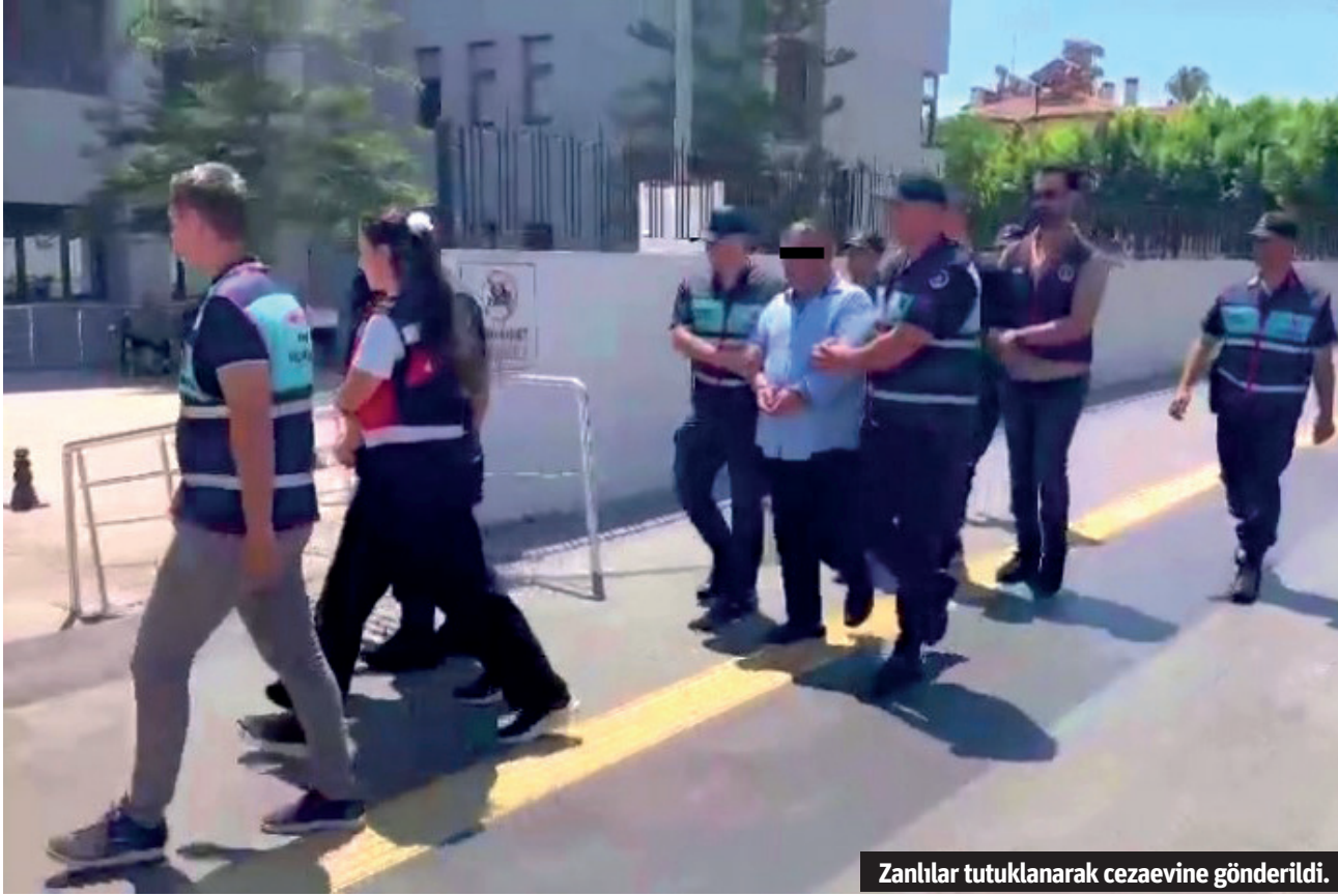
Zanlılar tutuklanarak cezaevine gönderildi.

Jandarma ekipleri yurt dışından yasa dışı yollarla uyuşturucu getirerek turizm bölgelerinde satan 3 kişiyi 5,5 kilo plaka esrar ile ele yakaladı. Zanlılar tutuklanarak cezaevine gönderildi.