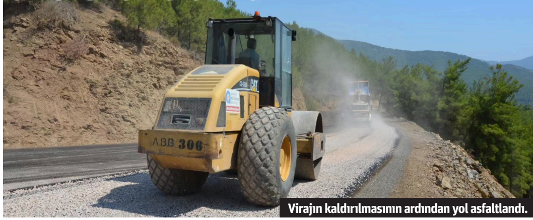
Virajın kaldırılmasının ardından yol asfaltlandı.

Antalya Büyükşehir Belediyesi Kırsal Hizmetler Dairesi Başkanlığı, Alanya'nın Yaylakonak Mahallesi grup yolundaki keskin virajı ortadan kaldırmak için başlattığı çalışmaları tamamladı. Dar ve oldukça keskin olan viraj kazalara yol açıyordu. Virajdaki tepe iş makineleriyle traşlanarak ortadan kaldırdı. Yol açım çalışmalarından sonra alt yapı çalışmaları gerçekleştirildi ve yol asfalta hazır hale getirildi. - Damla Erciyas