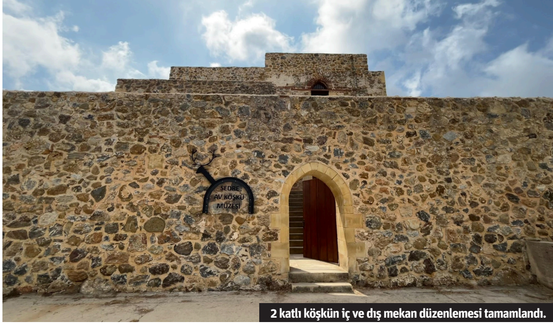
2 katlı köşkün iç ve dış mekan düzenlemesi tamamlandı.

SELÇUKLU dönemi yapılarından günümüze kadar ayakta kalan tarihi eserlerden Sedre Av Köşkü, Alanya Belediyesi tarafından kültür turizmine kazandırılıyor. Demirtaş Mahallesi Sedre Çayı kenarında bulunan 2 katlı köşkün iç ve dış mekan düzenlemesi tamamlandı. 8 asırlık tarihiyle dikkat çeken Sedre Av Köşkü'nün iç mekanında geçmişten günümüze avcılık tarihi, siyah beyaz fotoğraflar ile Alanya av kültürü ve köşkün mimari yapısı anlatılırken, dış mekanda ise Anadolu'daki Selçuklu av köşklere ve Alanya çevresindeki av köşklere aktarı-