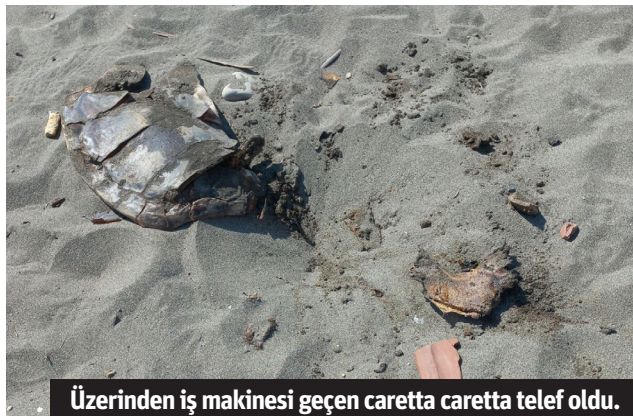
Üzerinden iş makinesi geçen caretta caretta telef oldu.