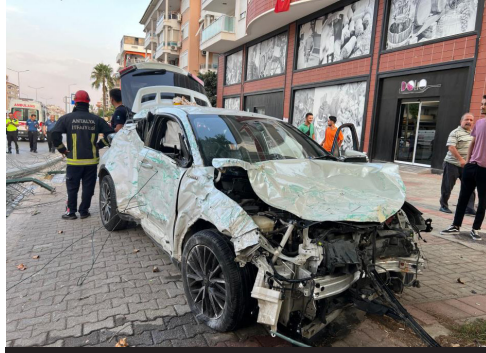
Kaza, Kadipaşa Mahallesi'nde meydana geldi.