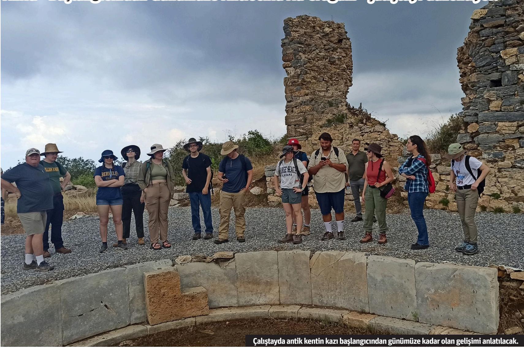
Çalıştayda antik kentin kazı başlangıcından günümüze kadar gelişimi anlatılacak.

Gazipaşa'da "Antiochia Ad Cragum" antik kentinin kazı çalışmalarına destek olan ALKÜ "Başlangıcından Günümüze Antiochia Ad Cragum" çalıştayını düzenliyor.