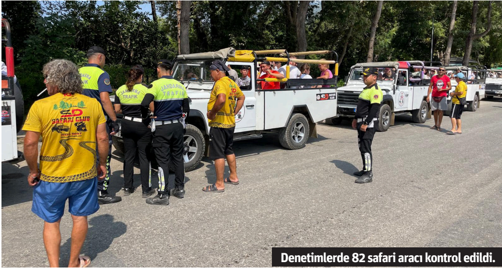
Denetimlerde 82 safari aracı kontrol edildi.

ALANYA İlçe Jandarma Komutanlığı tarafından Oba Alacami, Değirmendere, Dim Çayı ve Sapadere bölgelerinde safari araçlarına yönelik trafik denetlemeleri yapıldı. Yapılan denetlemelerde 82 safari