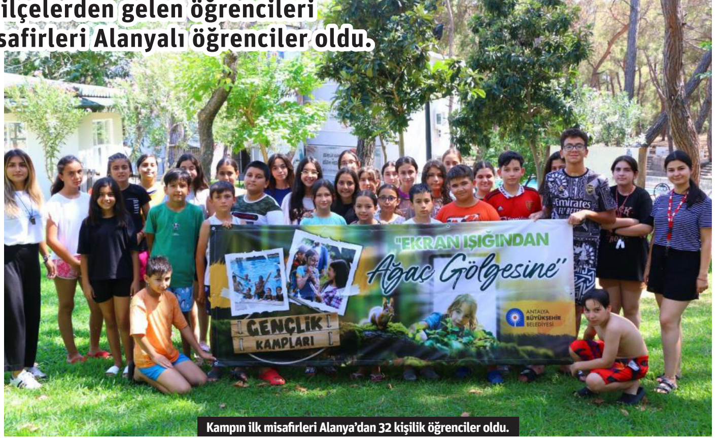
Kampın ilk misafirleri Alanya'dan 32 kişilik öğrenciler oldu.

Kampın yaz boyunca süreceğini söyleyen Çelik, "Tüm ilçelerimizden çocukları ve gençleri ağırlayacağımız bir program oluşturduk. Eylül ayına kadar sürecektir yaz kamplarımızda gençlerimizi burada misafir edeceğiz. Tüm ilçelerimizden öğrencilerimizi ilçeleri için belirtilen tarihler arasında kampımıza alacağız. Kontenjanlar sınırlı olan yaz kamplarımıza talepte bulunmak isteyen vatandaşlarımız için Antalya Büyükşehir Belediyemizin sosyal medya hesaplarından ve web sitemizin üzerinden başvurular alınacaktır. Tüm çocuk ve gençlerimizi doğa ile iç içe keyifli