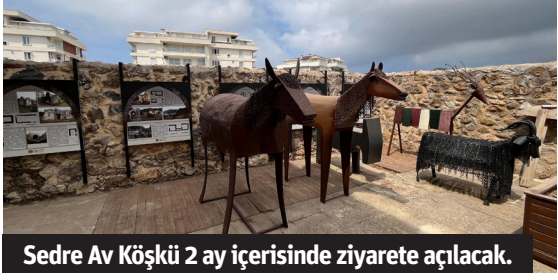
Sedre Av Köşkü 2 ay içerisinde ziyarete açılacak.

Alanya Belediye Başkanı Osman Tarık Özçelik, Selçuklu dönemi köşk mimarisinin nadir örneklerinden olan Sedre Av Köşkü'nün 2 ay içerisinde avcılık kültürünün sergilendiği özel bir mekan olarak ziyarete açılacağını söyledi.