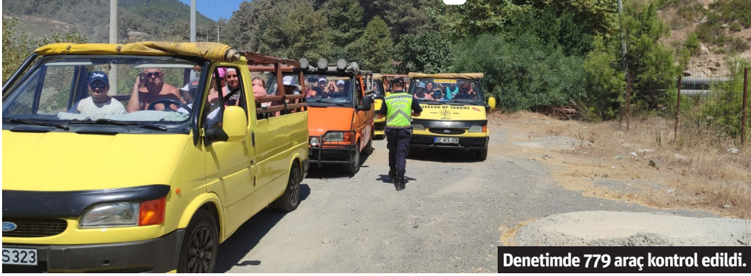
Denetimde 779 araç kontrol edildi.

Alanya'da jandarmanın yaptığı genel trafik uygulamasında kuralara uymayan 126 sürücüye 306 bin 356 TL cezai işlem uygulandı.