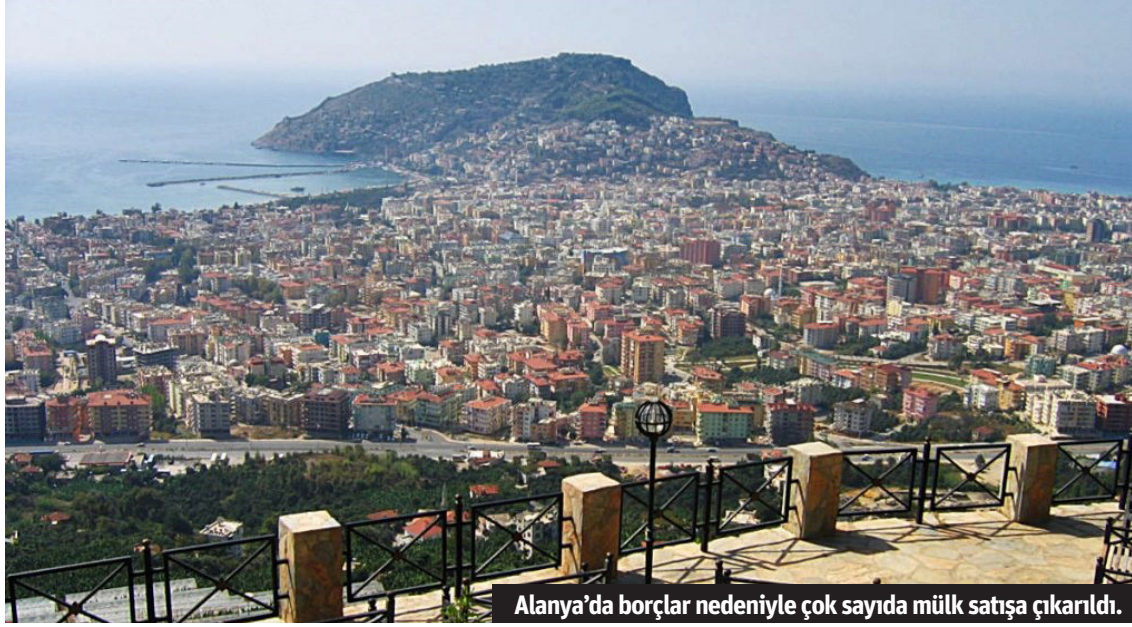
Alanya'da borçlar nedeniyle çok sayıda mülk satışa çıkarıldı.

satışları ilan edilen mülkler arasında otel hissesi, daire, arsa, tarla, kamyonet ve cip bulunuyor. Önümüzde hafta başlayacak ve aralık ayına kadar sürecek satış işlemleri açık artırma usulü ile gerçekleştirilecek. İcralık taşınmazlar arasından Uğrak Mahallesi'ndeki bir tarlanın fiyatı turizm camiasında gündem olan 70 milyon TL'lik otel hissesini geçmiş durumda. 18 dönüm-