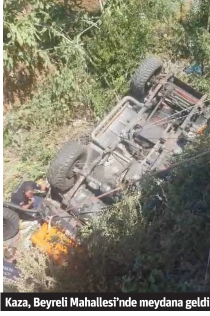
Kaza, Beyreli Mahallesi'nde meydana geldi.

ki vatandaşlar 112 Acil Çağrı Merkezi'ne ihbarda bulundu. İhbar üzerine bölgeye sağlık, itfaiye ve jandarma ekipleri sevk edildi. Kazada araçta bulunanlardan biri kendi imkanları ile kurtulurken, aracın altında sıkışan 2 kişiyi itfaiye ekipleri uzun süren çalışma ile çıkardı. Kazada yaralanan 3 kişi ambulanslarla hastaneye sevk edildi. - Kemal Cengiz