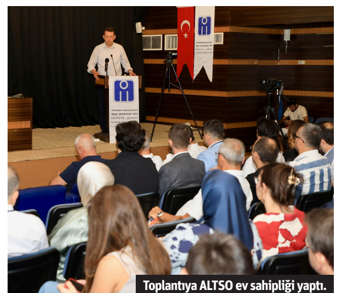
Toplantıya ALTSO ev sahipliği yapıldı.