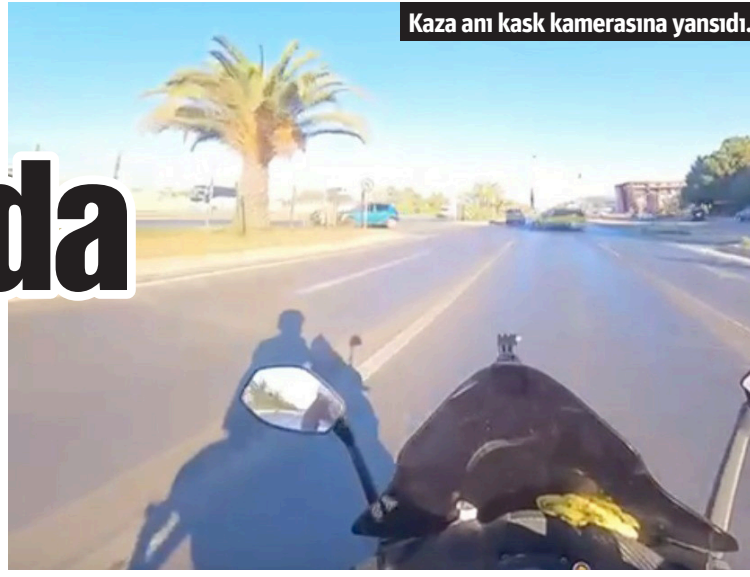
Kaza anı kask kamerasına yansdı.

ne gelen sağlık ekibi, yaptıkları kontroller de motosiklet sürücüsünün hayatını kaybettiğini belirledi. Ticari takside bulunan sürücü ve yabancı uyruklu 3 yolcu ise kazayı yara almadan atlattılar. Yücel'in cansız bedenini savcılık ve jandarmanın yaptığı incelemelerinin ardından Antalya Adli Tıp Kurumuna gönderildi.