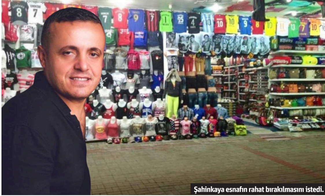
Şahinkaya esnafın rahat bırakılmasını istedi.

Euro sayıyor. Ben şu kadara verdim diye hava yapsın. Onlar için paranın nereden, nasıl geldiği pek önemli değil. Sonra bir umreye giderler, günahları af olur, geri gelirler. Tabi hepsi değil, içlerinde iyileri de var, ama genelini dini imanı Euro. Türk parası da değil. Mehmet Şimşek yanlış adreslerde balık avlıyor. Küçük esnafa ceza yazarak ekonomiyi düzeltmeye çalışıyor." şeklinde konuştu. - Kemal Cengiz