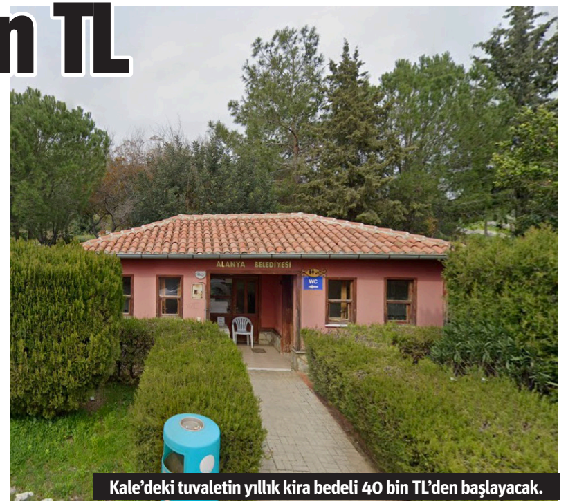
Kale'deki tuvaletin yıllık kira bedeli 40 bin TL'den başlayacak.

liplerinin açık artırması ile 2 milyon TL'yi geçmesi bekliyor. İhaleye girme şartlarını yerine getiren kişiler, gerekli belgeler ile birlikte 21 Ağustos Çarşamba günü saat 16.00'ya kadar Alanya Belediyesi Emlak ve İstimlak Müdürlüğü'ne teslim etmesi istendi. Talipliler 1200 TL karşılığında dosyayı alabilecek. İhaleye ait şartname ve diğer evraklar mesai saatleri içinde Emlak ve İstimlak Müdürlüğü'nden temin edilebilecek. - Kemal Cengiz