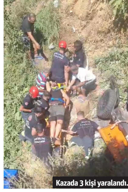
Kazada 3 kişi yaralandı.