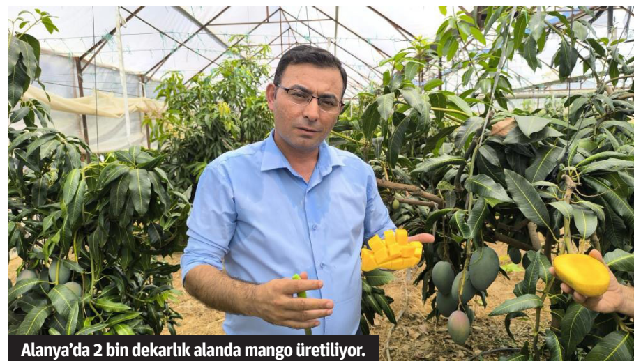
Alanya'da 2 bin dekarlık alanda mango üretiliyor.

hissedilen hava sıcaklığı 50 derecenin üzerinde. Bu şartlarda çok meşakkatli bir iş yapılıyor. Aynı zamanda üretimi için maliyet bakımından da çok ciddi bir yatırım gerektiriyor. Fidanı toprakla buluşturduğumuzdan meyve almına kadar yoğun bir süreç geçiyor. Bakımı, bitki koruma ile besleme ürünlerinin uygulanması, doğru zamanda su ihtiyacının karşılanması ve en önemlisi olan budama işleminin doğru yapılmasıdır. Şu anda örnek verecek olursak Keitt cinsi mango ağaçlarına budama işlemi yapılırken, diğer Naomi cinsinin şu anda budama işlemi yok. Mart ayında çiçeklenme döneminde ise yine budama işlemleri yapılıyor. Çünkü çiçek tutmayan kısımlar-