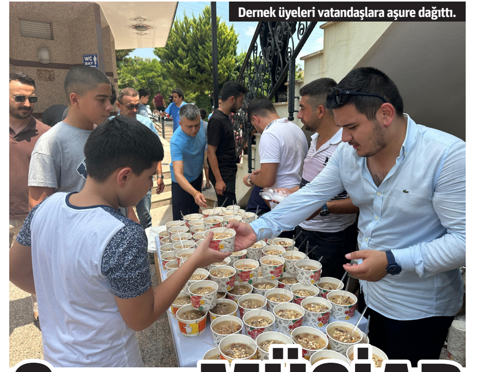
Dernek üyeleri vatandaşlara aşure dağıttı.