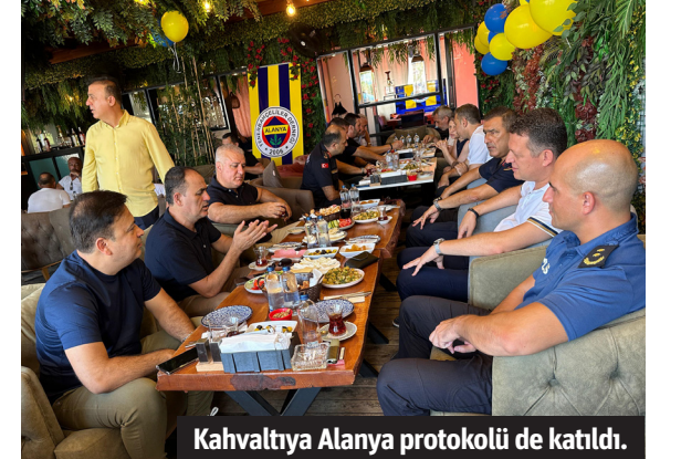
Kahvaltıya Alanya protokolü de katıldı.