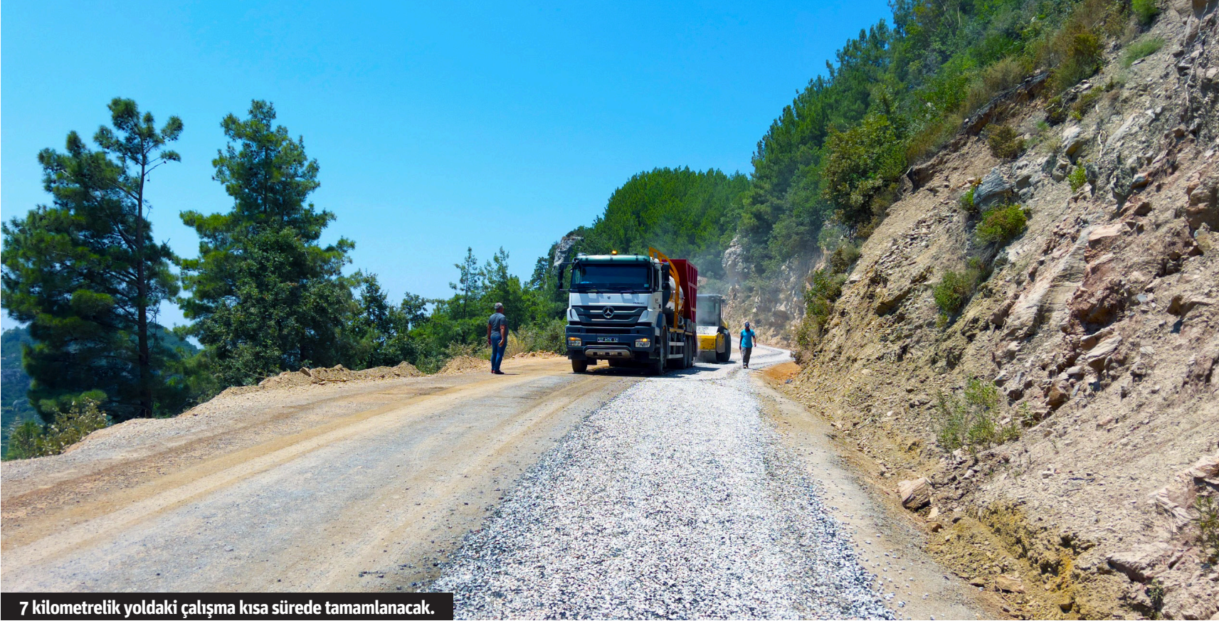
7 kilometrelik yoldaki çalışma kısa sürede tamamlanacak.

Alanya Belediyesi alt yapı ve hazırlık aşamalarını tamamladığı Mahmutseydi Çevre Yolu'nda sathi asfalt kaplama çalışması başladı. 4 mahalleyi birbirine bağlayan 7 kilometrelik yoldaki çalışma kısa sürede tamamlanarak vatandaşın kullanımına açılacak.