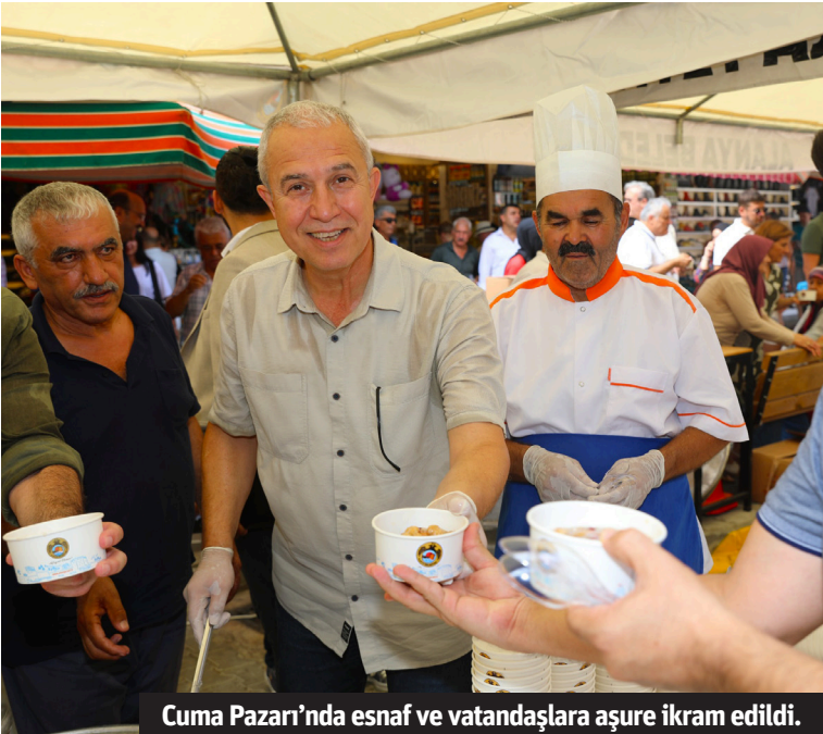
Cuma Pazarı'nda esnaf ve vatandaşlara aşure ikram edildi.

Alanya Belediyesi birlik, beraberlik ve paylaşmanın en güzel simgelerinden Muharrem ayı dolayısıyla Cuma Pazarı'nda ve belediye ana binasında vatandaşlara 5 bin kişilik aşure ikram etti.