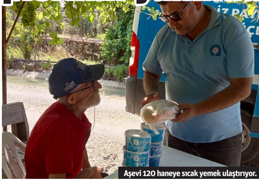
Aşevi 120 haneye sıcak yemek ulaştırıyor.

SÜT, MAMA VE GIDA DAĞITIMI YAPILIYOR Antalya Büyükşehir Belediyesi, Alanya Aşevi 23 personeli ile ihtiyaç sahiplerine sıcak yemek dağıtımının yanı sıra Halk Süt, Halk Mama ve Glütensiz gıda dağıtımını da gerçekleştiriyor. Aşevi, Alanya'da 2-5 yaş arasındaki çocuklar için her ay 625 haneye 5 bin litre süt dağıtımını yapıyor. 38 bebeğe Halk Mama, çölyak hastası 24 kişiye iki ayda bir olmak üzere 144 glütensiz gıda paketi desteği veriyor. - Antalya Büyükşehir Belediyesi / Bülten