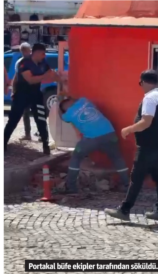
Portakal büfe ekipleri tarafından sökülüldü.