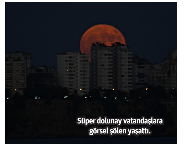
Süper dolunay vatandaşlara görsel şölen yaşattı.

ANTALYA'DA sıcaktan bunalarak Konyaaltı Sahili'ne akın eden vatandaşlar, süper ay manzarasını hayranlıkla izledi. Antalya'da akşam saatlerinde sıcaktan bunalarak kendilerini Konyaaltı Sahili'ne atan vatandaşlar, kentin silüetinin ardından bir anda beliren süper dolunayı hayranlıkla izledi. Kimi vatandaşlar cep telefonuna sarılarak bu anı ölümsüzleştirmek için fotoğraf çekerken, kimileri ise kamp sandalyelerinde bu güzel anın keyfini çıkardı. Ay, yörüngesinde dünyaya en yakın olması nedeniyle normalden yüzde 14 daha büyük ve yüzde 30 daha parlak görüldü. "GERÇEKTEN GÖRSEL BİR ŞÖLEN" Konyaaltı Sahili'nde piknik yapan ve süper dolunayın şehir silüetinin arkasından doğuşunu hayranlıkla izleyen vatandaşlardan Betül Türkoğlu, "3 senedir buradayım. Konyaaltı Sahili'ne ailemle birlikte pikniğe geldim. 3 senedir ilk defa böyle büyük bir dolunaya denk geldim. Gerçekten görsel bir şölen, denize yansması, yakamoz, Kaleiçi, Karaoğlan Parkı civarından doğdu. Muhteşem bir manzaraydı" dedi. - İHA