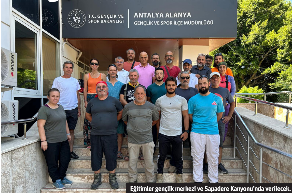
Eğitimler gençlik merkezi ve Sapadere Kanyonu'nda verilecek.

Alanya Gençlik ve Spor İlçe Müdürlüğü ev sahipliğinde 19 sporcu ve 4 antrenör, teorik ve pratik eğitim alacaklar. Pratik eğitimler 3 gün Sapadere Kanyonu'nda sürecek.