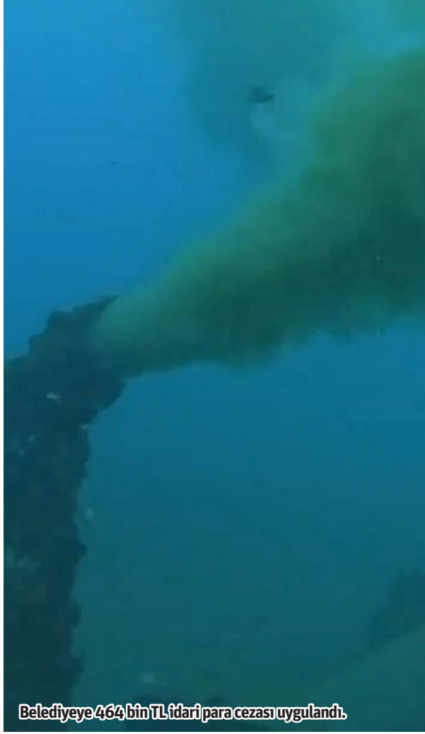
Belediyeye 464 bin TL idari para cezası uygulandı.

Antalya Büyükşehir Belediye Başkanı Muhittin Böcek, Alanya Okurcalar Arıtma Tesisi kapasitesini yüzde 40 artışla günde 28 bin mektre küpe yılda 3 milyon litreye çıkarıldıklarını söyleyerek “Denizimiz ve çevremiz tertemiz olsun diye canla başla çalışıyoruz. Antalya'mızın 19 ilçesinin geleceği için çalışmaya devam ediyoruz.” demişti. Antalya Büyükşehir Belediyesi Çevre Mühendisi