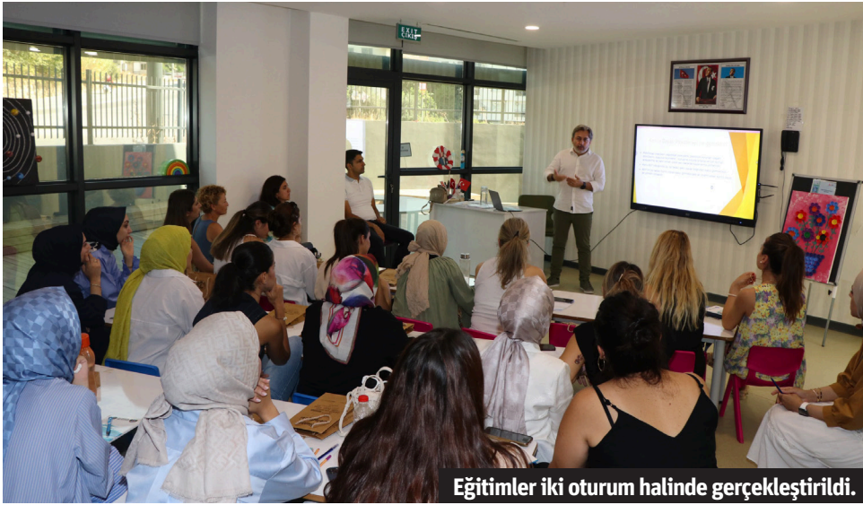
Eğitimler iki oturum halinde gerçekleştirildi.

Eğitim alanındaki hizmet birimlerinin hedef kitlelerine (öğretmen, ebeveyn, öğrenci) yönelik mesleki yeterlilik, kişisel gelişim, akademik başarı gibi hayat başarısını destekler nitelikteki alanları ve başlıkları kapsayarak eğitim kalitesini artırma amacıyla kurulan Alanya Belediyesi Eğitim Akademisi, ilk eğitimlerine başladı. Bu kapsamda Belediye çatısı altında hizmet veren etüt ve destek eğitim kurs merkezleri, kreşler ile kız yurdu öğretmenlerine eğitim verildi. EĞİTİMLER İKİ OTURUM HALİNDE VERİLİYOR Eğitimler, ISST Akredite İleri Düzey Şema Terapisti Uzman Klinik Psikolog