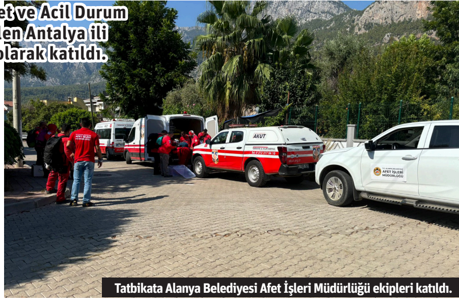
Tatbikata Alanya Belediyesi Afet İşleri Müdürlüğü ekipleri katıldı.

yesi Afet İşleri Müdürlüğü ekipleri gözlemci ve lojistik destek olarak hazır bulundu. Bine yakın arama kurtarma personelinin katıldığı tatbikata Antalya Valisi Hulusi Şahin de takip etti. Ekipler, AFAD Koordinasyon Merkezi'nden aldıkları koordinatlar doğrultusunda tatbikat senaryosuna uygun olarak görevlerini başarıyla tamamladı. - Alanya Belediyesi / Bülten