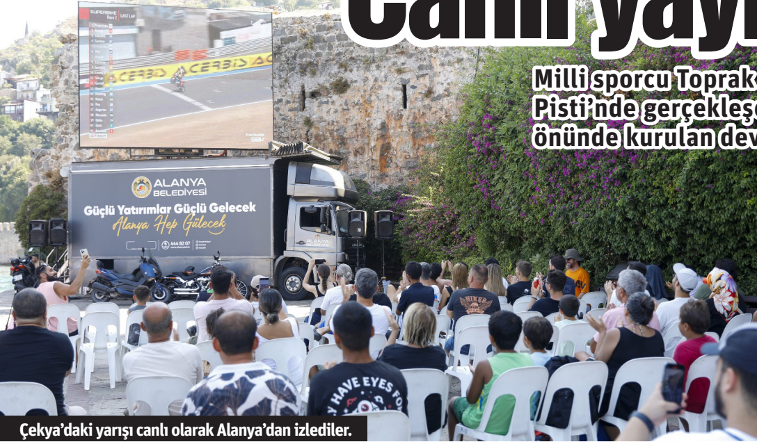
Çekya'daki yarış canlı olarak Alanya'dan izlediler.

Milli sporcu Toprak Razgathoğlu'nun WSBK Çekya Most Pisti'nde gerçekleşen yarışı, Alanya'da tarihi Kızılkule önünde kurulan dev ekranda sporseverlerle buluşturuldu.