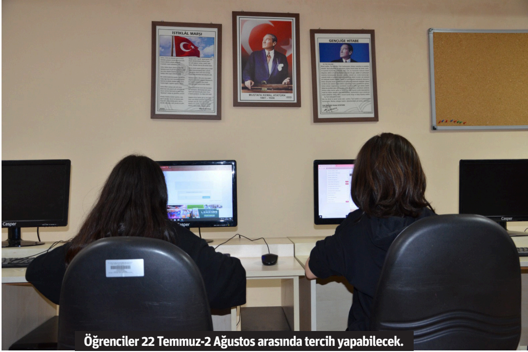
Öğrenciler 22 Temmuz-2 Ağustos arasında tercih yapabilecek.

TERCİH DESTEĞİ Antalya Büyükşehir Belediyesi tarafından kurulan Alanya ATABEM Kurs Mer-