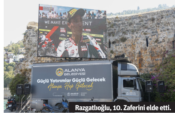
Razgathoğlu, 10. Zaferini elde etti.

MOTOR sporlarında Dünya Superbike Şampiyonası (WSBK) ve Dünya Supersport Şampiyonası (WSSP) heyecanı, Çekya Most Pisti'nde gerçekleşen etapla devam etti. Alanya Belediyesi ve Alanya Turizm Tanıtma Vakfı (ALTAV) iş birliğinde motor sporlarında dünyanın en prestijli yarışlarında mücadele eden milli sporcu Toprak Razgathoğlu ve Can Öncü ile Bahattin Sofuoğlu'nun yarışlarını, tarihi Kızılkule önünde kurduğu dev ekranda canlı yayınladı.