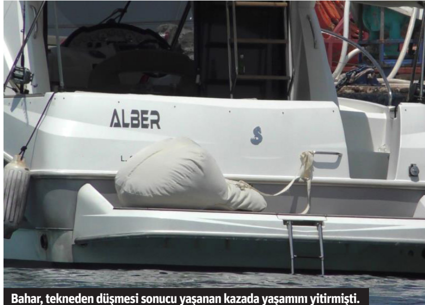
Bahar, tekneden düşmesi sonucu yaşanan kazada yaşamını yitirmişti.

KEMER'DE 19 Temmuz Cuma günü meydana gelen olayda Antalya Ticaret ve Sanayi Odası (ATSO) ve Antalya Organize Sanayi Bölgesi (AOSB) Başkanı Ali Bahar, kendisine ait "Alber" isimli tekne limana yanaştığı esnada tekneden düşen minderi almak için teknenin arka kısmına yöneldi. Tekneyi kullanan M.S.Ç. minderin alınması için manevra yaptığı sırada Bahar,