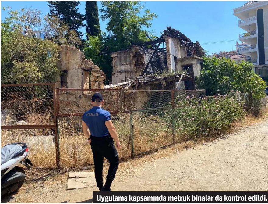
Uygulama kapsamında metruk binalar da kontrol edildi.

TÜRKİYE genelinde eş zamanlı olarak gerçekleştirilen Türkiye Huzur Güven Uygulaması kapsamında denetimler, ülke genelinde 10.00-12.00, 14.00-16.00 ve 20.00-22.00 saatleri arasında gerçekleştirildi. Alanya'da da aynı saat dilimlerinde yapılan denetimler, özellikle vatandaşların yoğun olarak bulunduğu yerler, metruk binalar, parklar ve bahçelerde yoğunlaştı. Denetimlerde emniyet güçleri, şehirde huzur ve güven ortamını korumak için geniş çaplı kontroller gerçekleştirdi. Alanya genelinde gerçekleştirilen bu denetimlerde 192 şahıs sorgulandı ve 35 araç kontrol edildi. Bu kontroller sırasında, emniyet güçleri vatandaşların kimliklerini ve araçların evraklarını detaylı bir şekilde inceledi. Uygulama