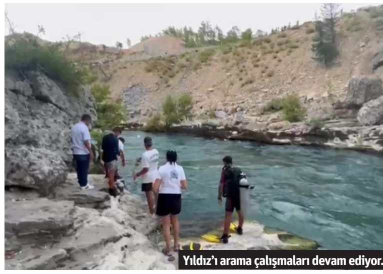
Yıldız'ı arama çalışmaları devam ediyor.

Dün akşam geç saatlere kadar süren arama çalışmalarına Manavgat İlçe Jandarma Komutanlığı Beşkonak Jandarma Karakolu ve komando ekipleri ile Jandarma kadavra köpeği Yel de eşlik etti. Gencin kaybolduğu bölgenin coğrafi konumu nedeniyle güç şartlar altında gerçekleştirilen arama çalışmalarında şu ana kadar her hangi bir ize rastlanmadı. Dün havanın kararması ile birlikte sona eren arama-kurtarma çalışmaları bu sabah erken saatlerde yeniden başladı. - İHA