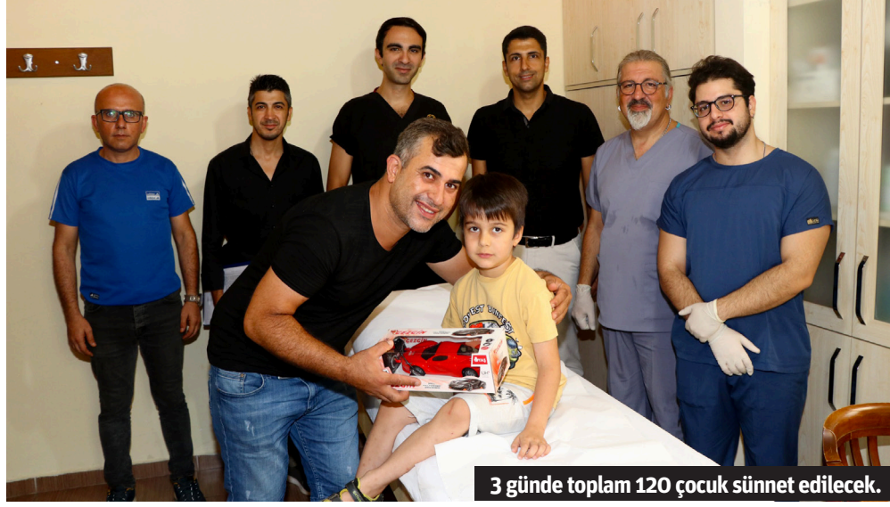
3 günde toplam 120 çocuk sünnet edilecek.

ALANYA Belediyesi'nin geleneksel hale getirdiği sünnet organizasyonu, Tevfik Hoca Evi Polikliniği'nde devam ediyor. 1 yaş altı ve 6 yaş üstü çocukların sünnet ettirilmesi için başvurular 1 Temmuz itibarıyla başlamıştı. Ailelerden gelen talepler doğrultusunda organizasyonun Ağustos ayı etkinliği başladı. Üç gün boyunca günde 40 olmak üzere toplam 120 çocuk, belediye sağlık ekipleri ve uzman personel tarafından hijyenik bir ortamda sünnet edilecek. Anne ve babaların yanı sıra nine ve dedeler de torunlarının mutlu gününe ortak oldu. Sünnet olan çocuklara hediye olarak çeşitli oyuncaklar verildi.