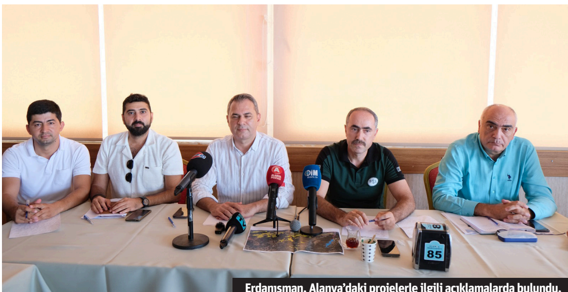
Erdanışman, Alanya'daki projelerle ilgili açıklamalarda bulundu.

YENİKÖY BARAJI İÇİN TARİH VERDİ Toplantıda DSİ Bölge Müdürü Erdanışman, Alanya'daki projeler üzerine açıklamalarda bulundu. 2015 yılında temeli atılan ve 3 yılda hizmete gireceği söylenen ancak 9 yıldır bitiremeyen Alan-