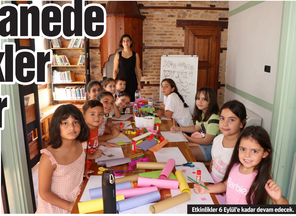
Etkinlikler 6 Eylül'e kadar devam edecek.

Yolculuk, 4 Eylül Çarşamba günü Origami Ayraç ile Soyut Düşünce Atölyesi ve 6 Eylül Cuma günü Pipetle Üfleme Sanatı atölyeleri gerçekleştirilecek. Aileler, 444 82 07-3401 üzerinden detaylı bilgilere ulaşarak atölyelere çocuklarını kayıt yaptırabiliyorlar. Uzman ekiplerin katıldığı atölyeler, özellikle okulların tatil olduğu dönemlerde çocukların zihinsel gelişimine katkı sunma amacıyla yapılmaya devam edecek. - Alanya Belediyesi / Bülten